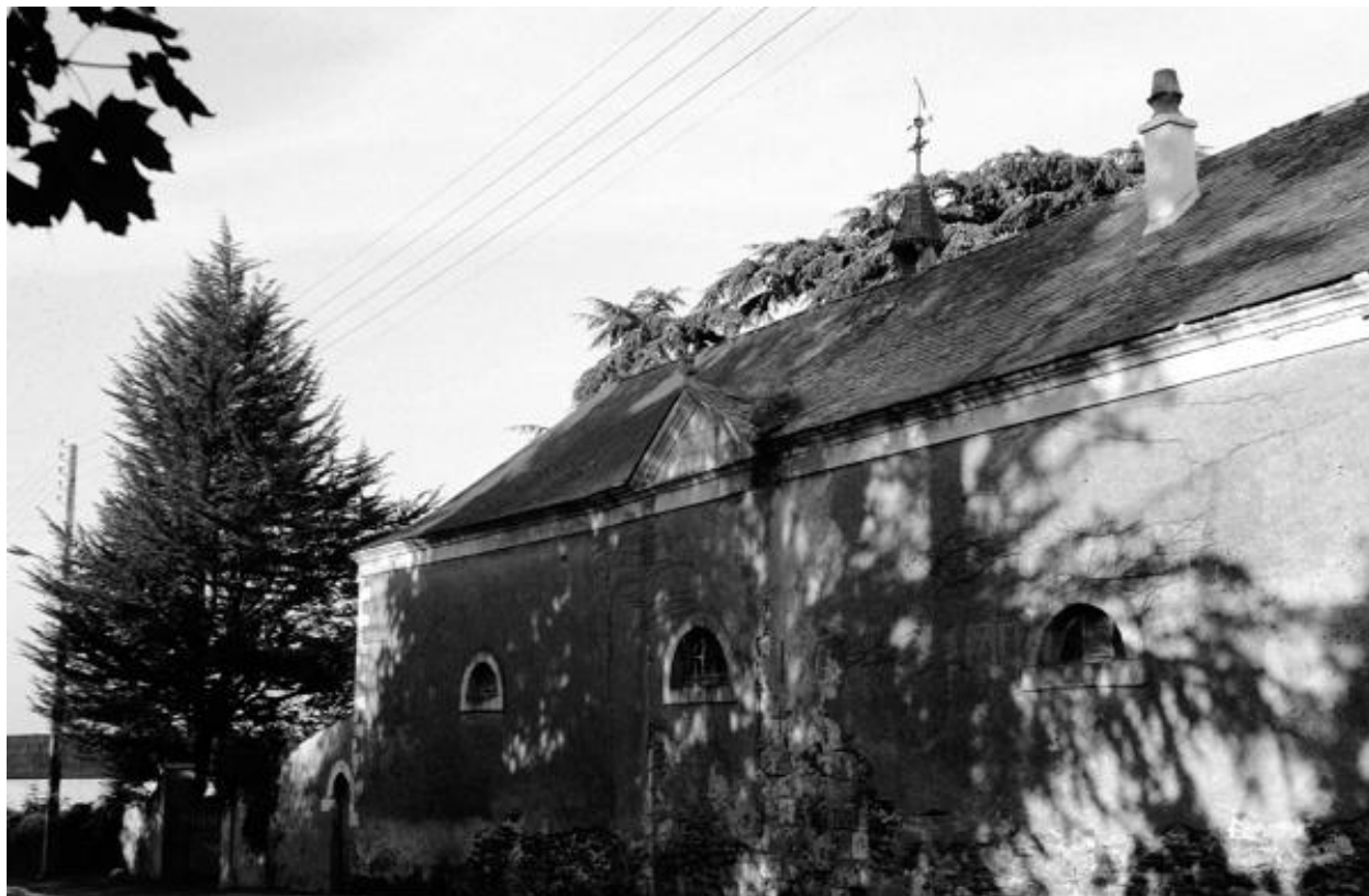
Façade sur rue, bâtiment privé abritant les vestiges du chevet de l'église du prieuré de Bénédictins (chapellerie saint Julien).