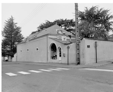
Façade sur rue, bâtiment privé abritant les vestiges de l'église du prieuré de Bénédictins.