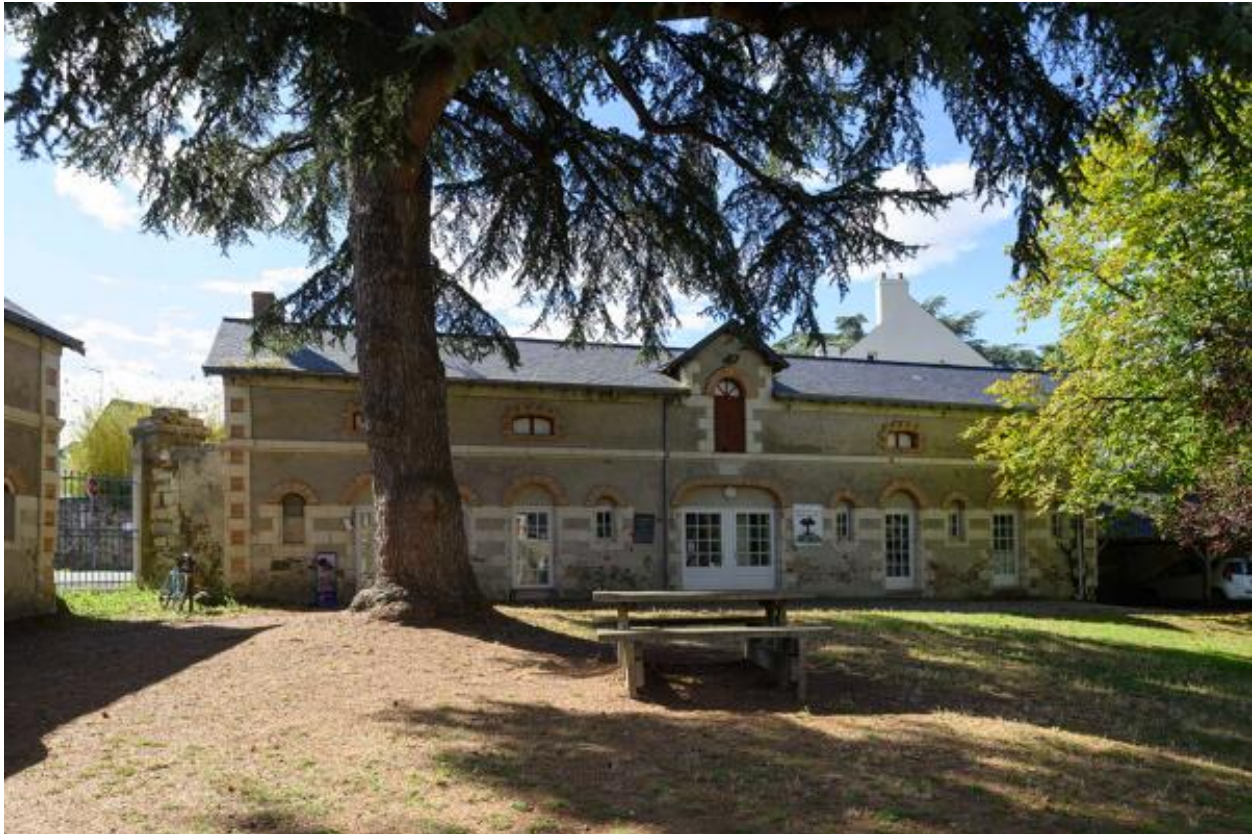
Vue des communs, partie ouest, ancien prieuré de Bénédictins.