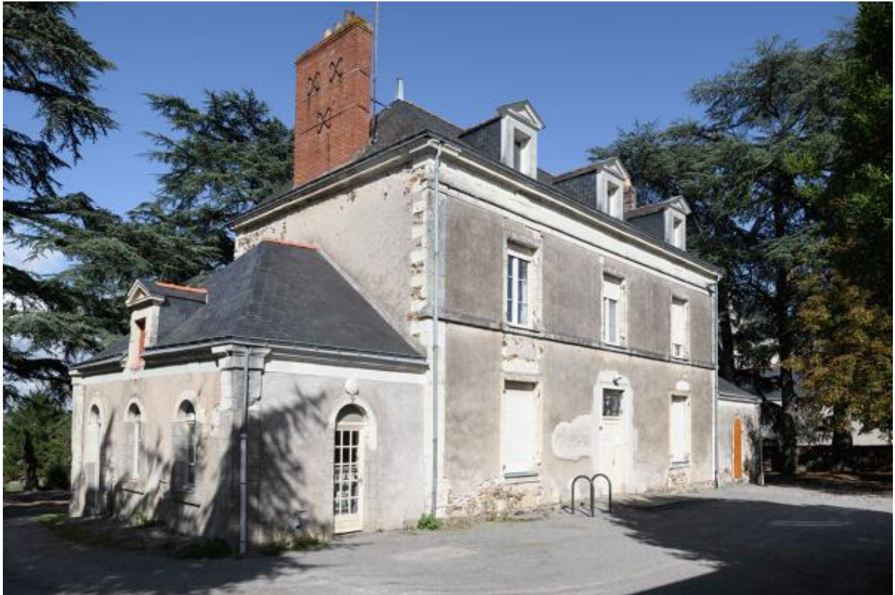
Vue d'ensemble de la façade sud, logis du XIXe siècle de l'ancien prieuré de Bénédictins.