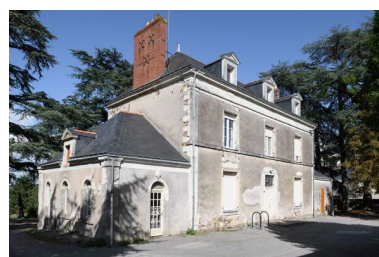
Vue d'ensemble de la façade sud, logis du XIXe siècle de l'ancien prieuré de Bénédictins. IVR52_20244900887NUCA