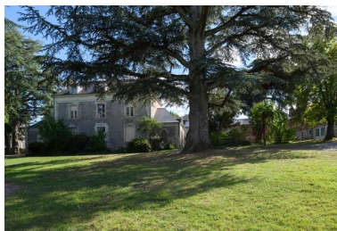
Vue d'ensemble, côté nord, de l'ancien prieuré et des communs.