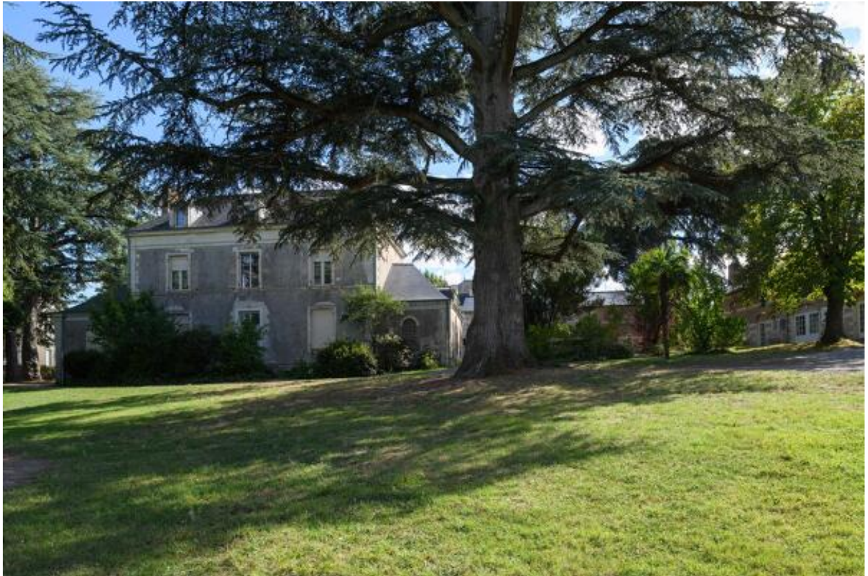
Vue d'ensemble, côté nord, de l'ancien prieuré et des communs.