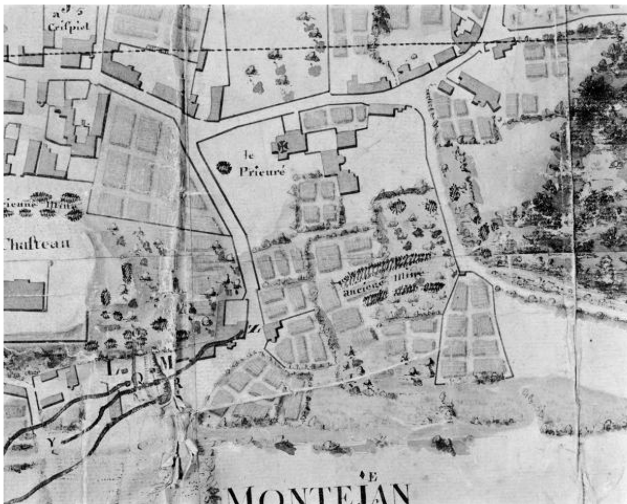
Plan général de Montjean et des veines de charbon de terre qui y sont connues. Partie ouest. Vers 1775-1780.