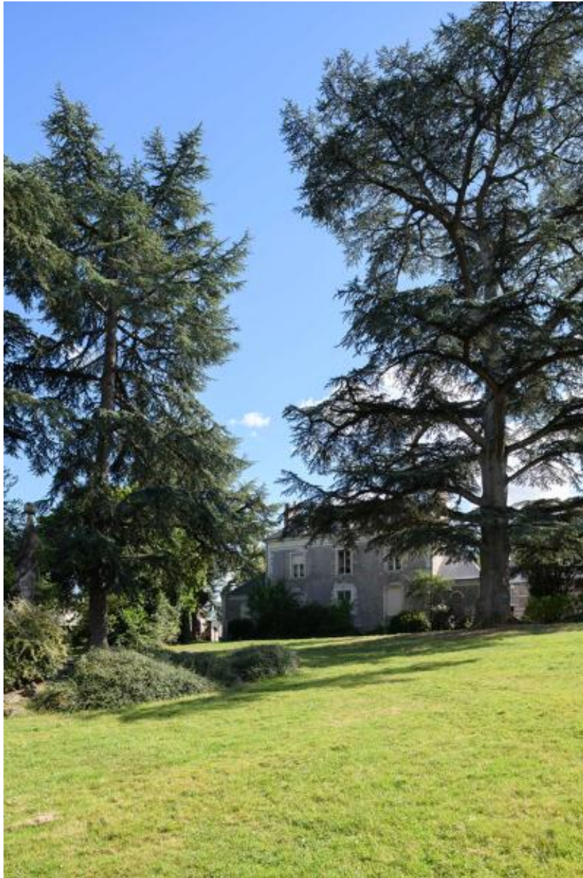
Vue d'ensemble de l'ancien prieuré depuis son parc, côté nord.