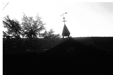
Détail de la toiture. IVR52_19724900360Z