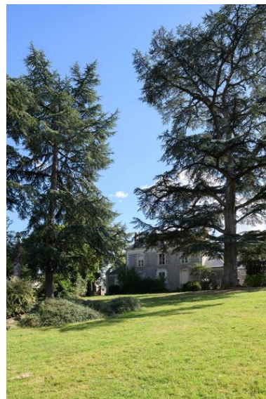
Vue d'ensemble de l'ancien prieuré depuis son parc, côté nord.