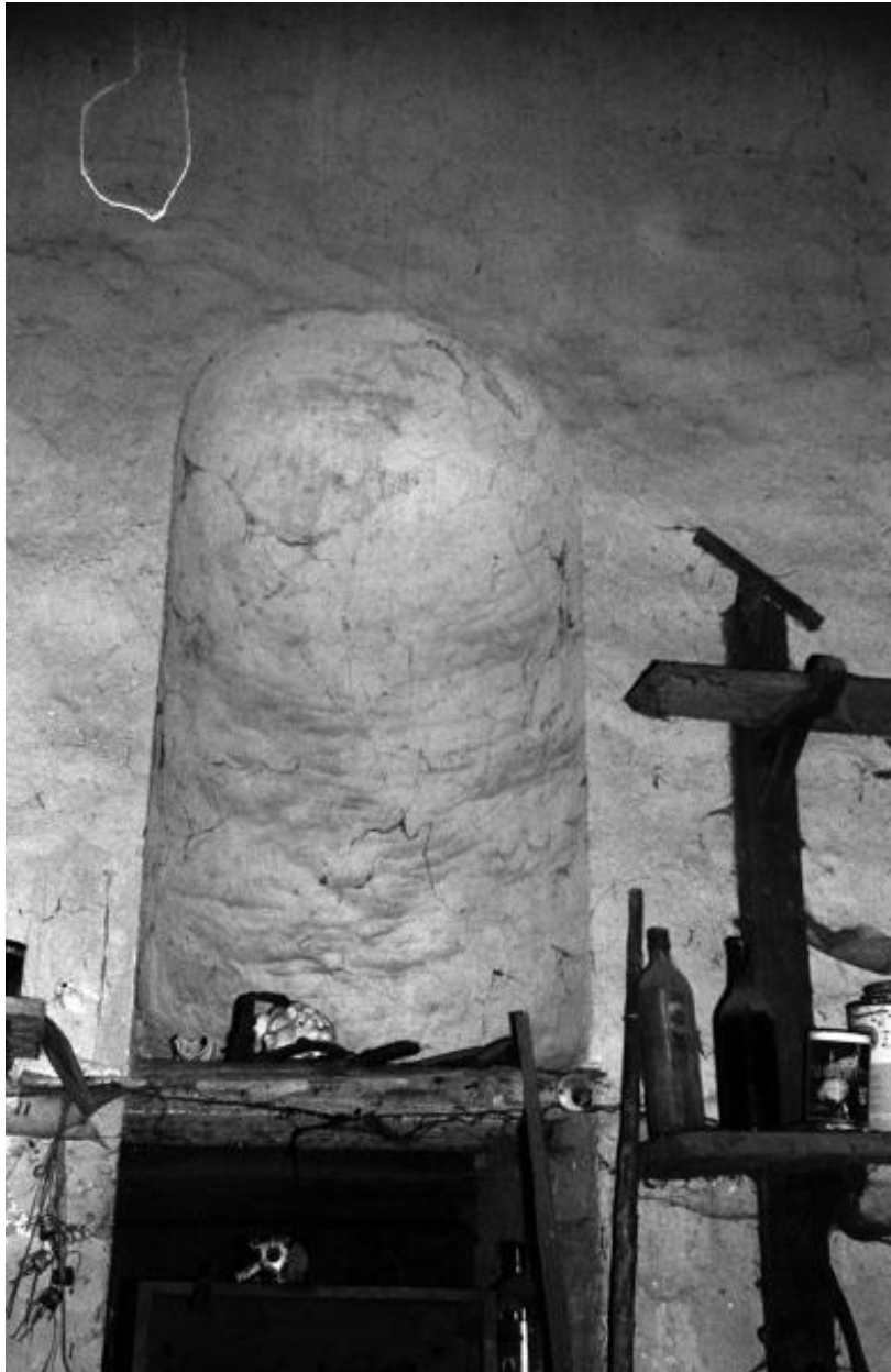
Détail d'une niche, chapellerie saint Julien, vestige du chevet de l'église du prieuré de Bénédictins.