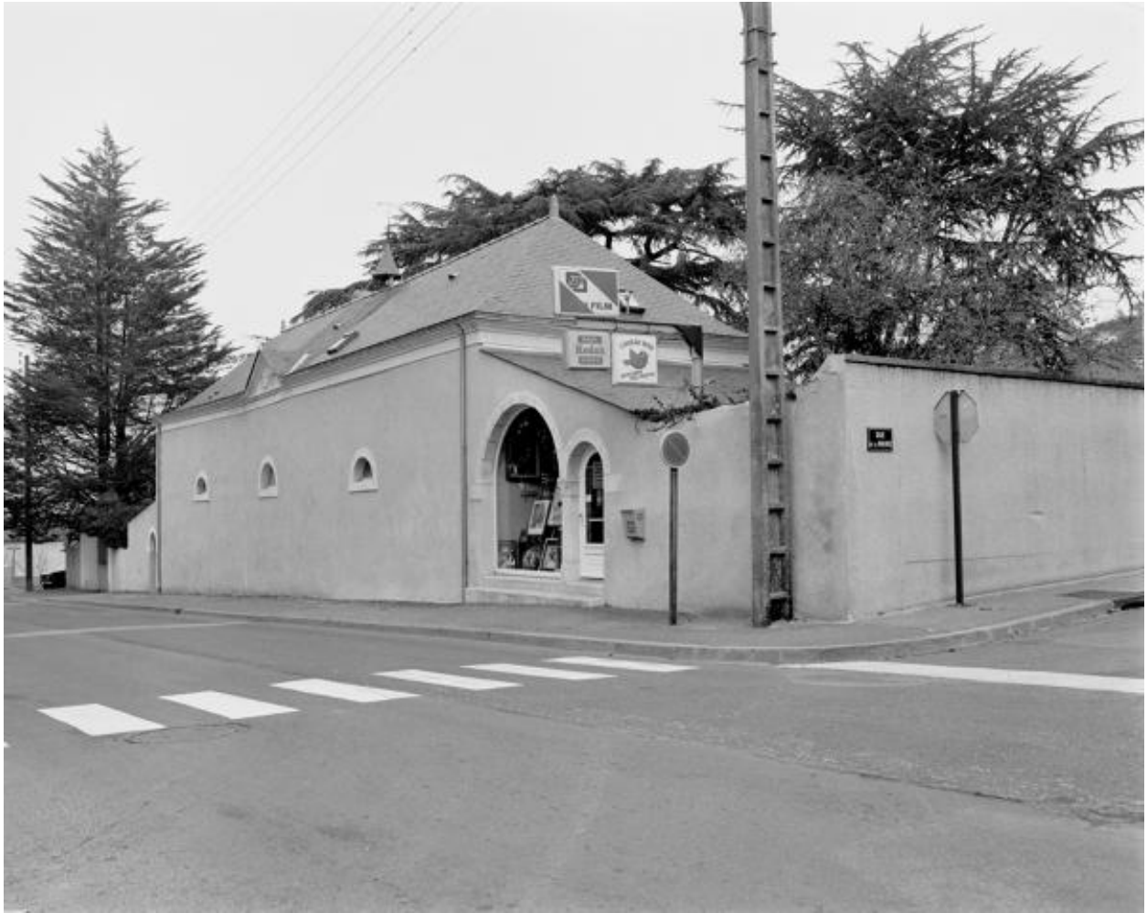
Façade sur rue, bâtiment privé abritant les vestiges de l'église du prieuré de Bénédictins.