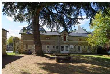
Vue des communs, partie ouest, ancien prieuré de Bénédictins.