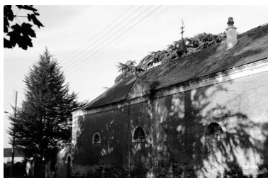
Façade sur rue, bâtiment privé abritant les vestiges du chevet de l'église du prieuré de Bénédictins (chapellerie saint Julien).