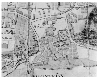
Plan général de Montjean et des veines de charbon de terre qui y sont connues. Partie ouest. Vers 1775-1780. (AM Montjean-sur-Loire ; non coté). IVR52_19834901687X