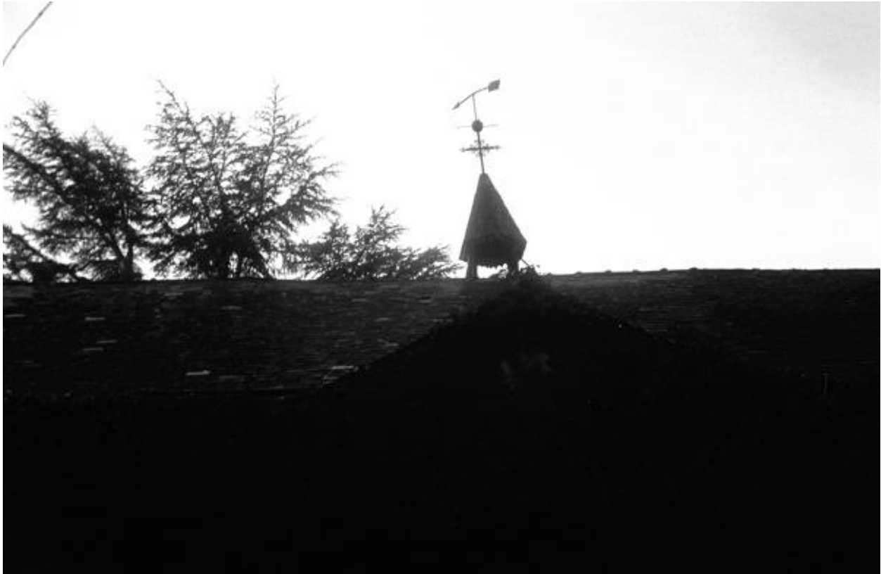
Détail de la toiture.