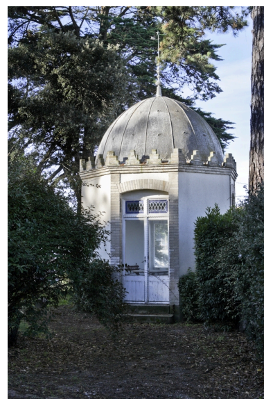
Entrée du kiosque, à l'est. IVR52_20094401275NUCA