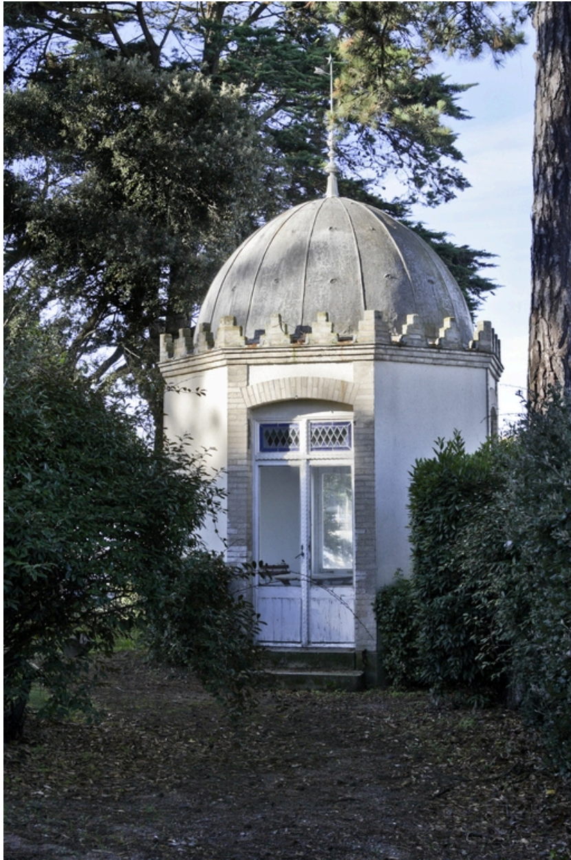
Entrée du kiosque, à l'est.