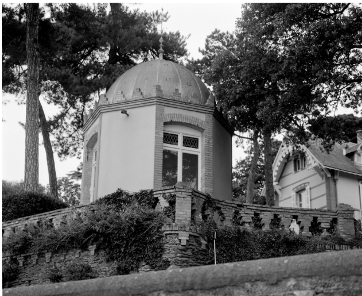
Vue de l'angle nord-ouest.