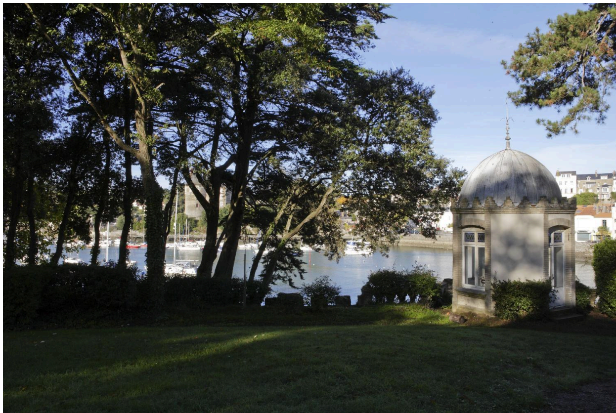
Vue d'ensemble du kiosque.