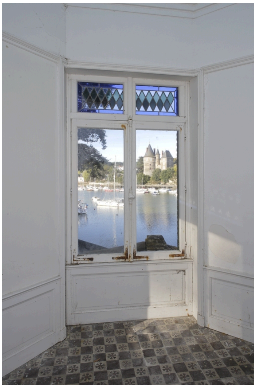
Vue intérieure du kiosque.