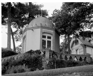
Vue de l'angle nord-ouest. IVR52_19984401595X