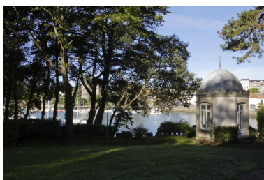
Vue d'ensemble du kiosque. IVR52_20094401285NUCA