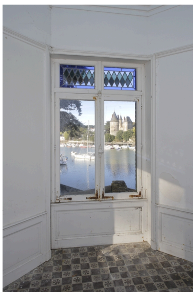
Vue intérieure du kiosque.