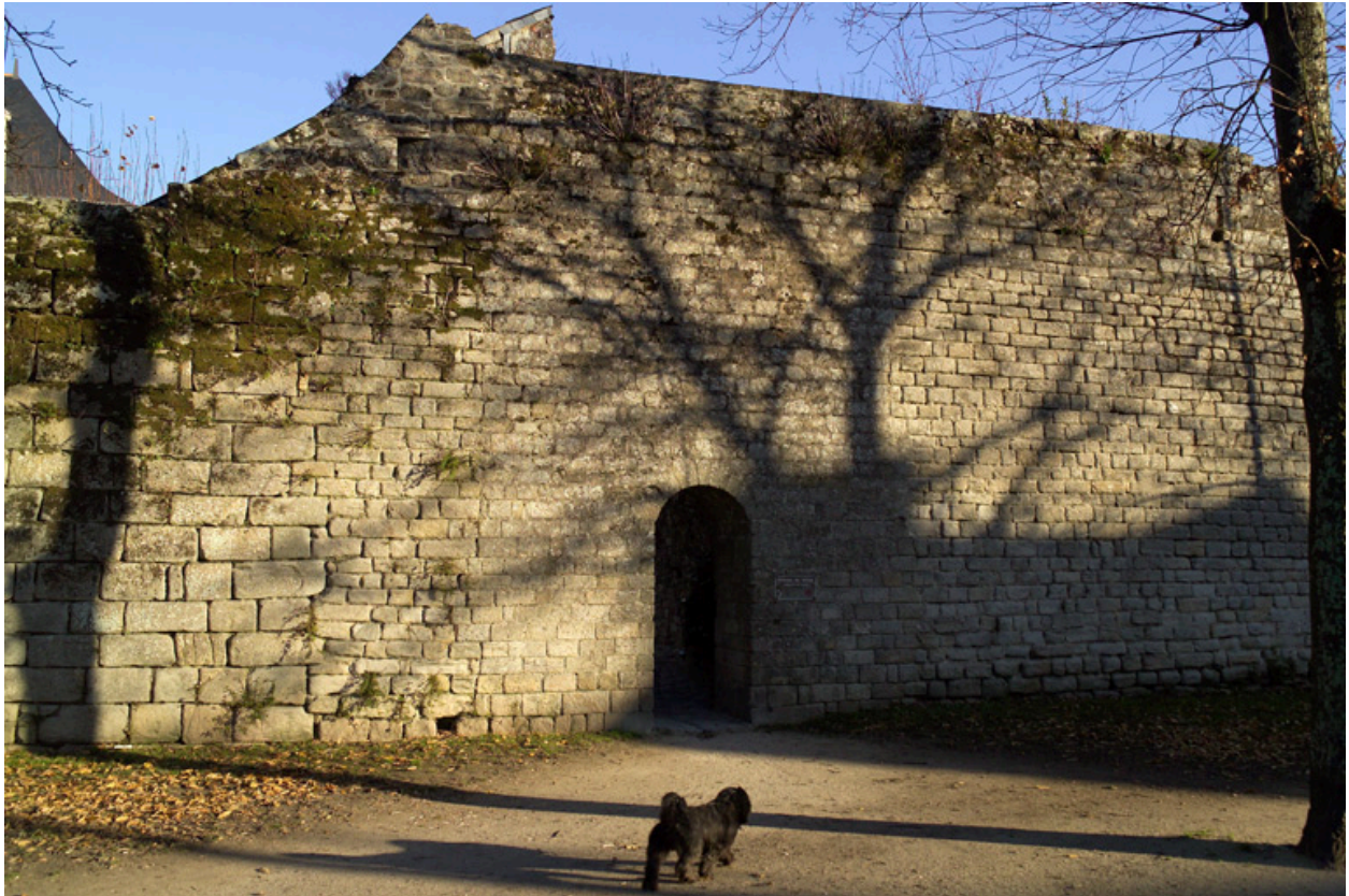
Vue générale de la poterne et de l'enceinte.