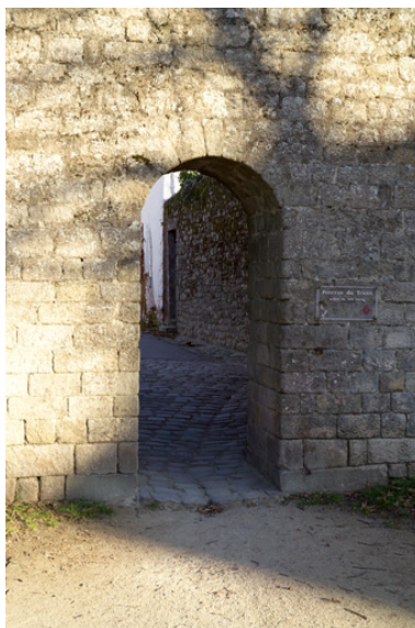
Passage.