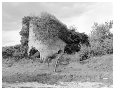
Le four et la rampe, vue d'ensemble depuis le sud-est, four du Grand Lièvre, Montjean-sur-Loire IVR52_19854901744X