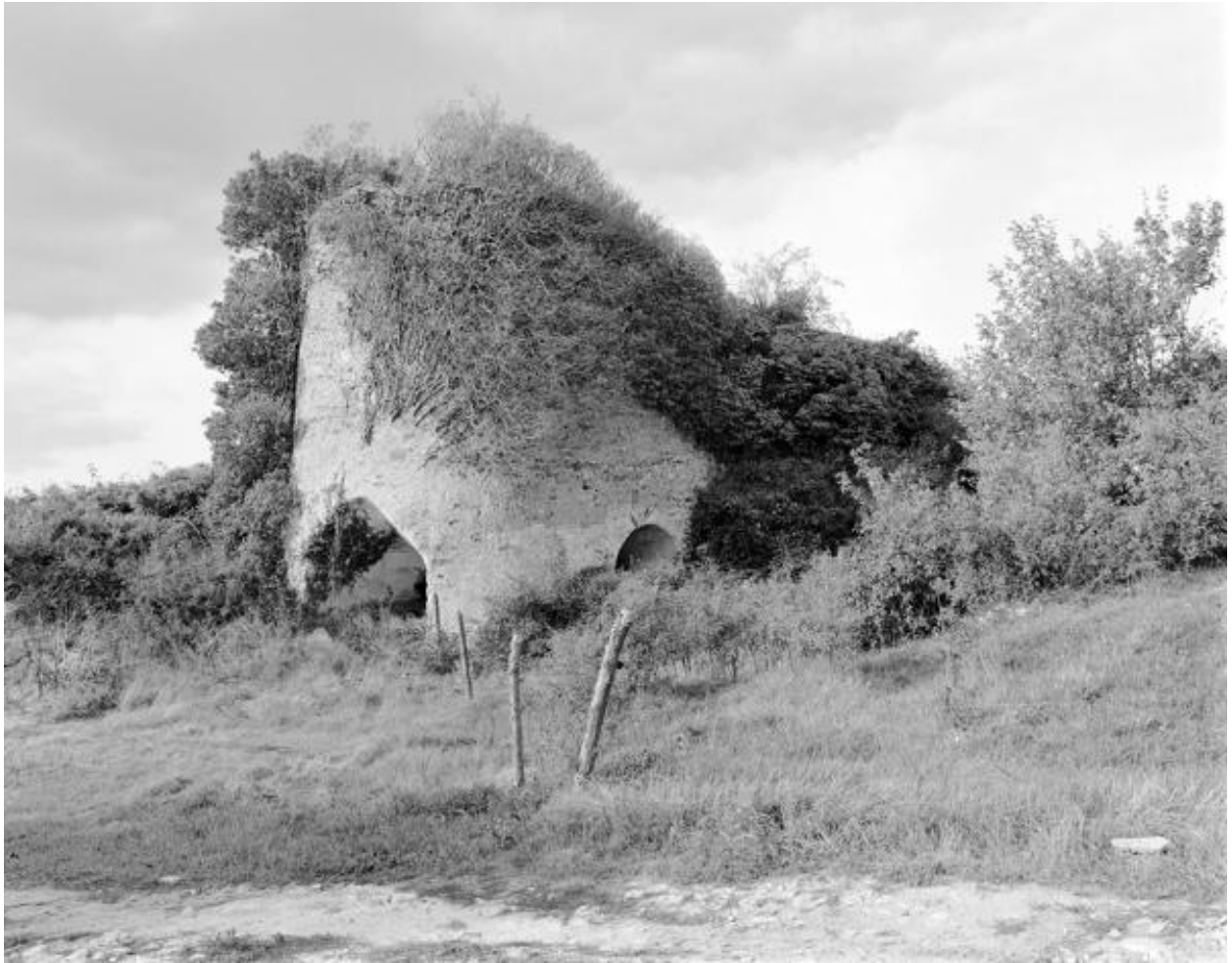
Le four et la rampe, vue d'ensemble depuis le sud-est, four du Grand Lièvre, Montjean-sur-Loire