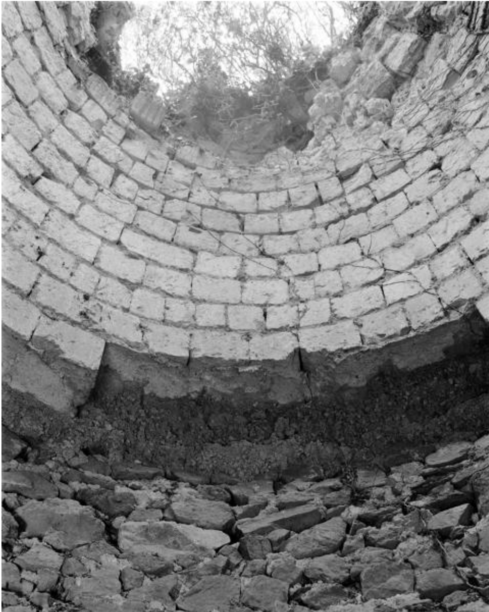
Chambre de combustion (robe en tuffeau et contre-robe en terre), four à chaux du Grand-Lièvre, Montjean-sur-Loire.