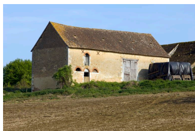
Grange-étable-fenil, vue depuis le nord-ouest.