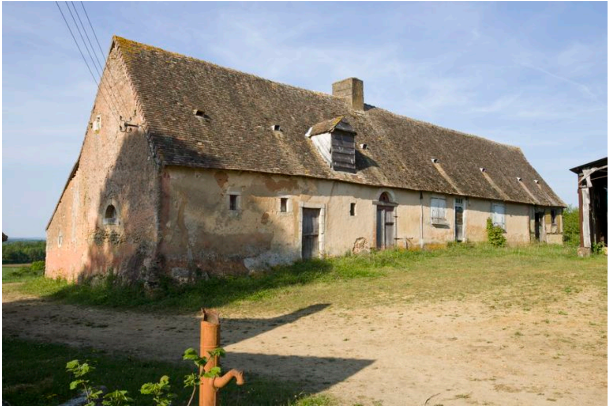
Logis vu depuis le sud-ouest.