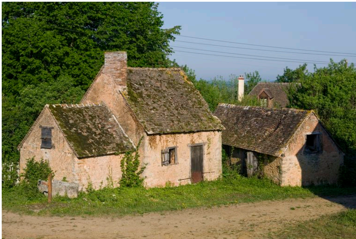
Fournil et porcherie, vus depuis le sud.