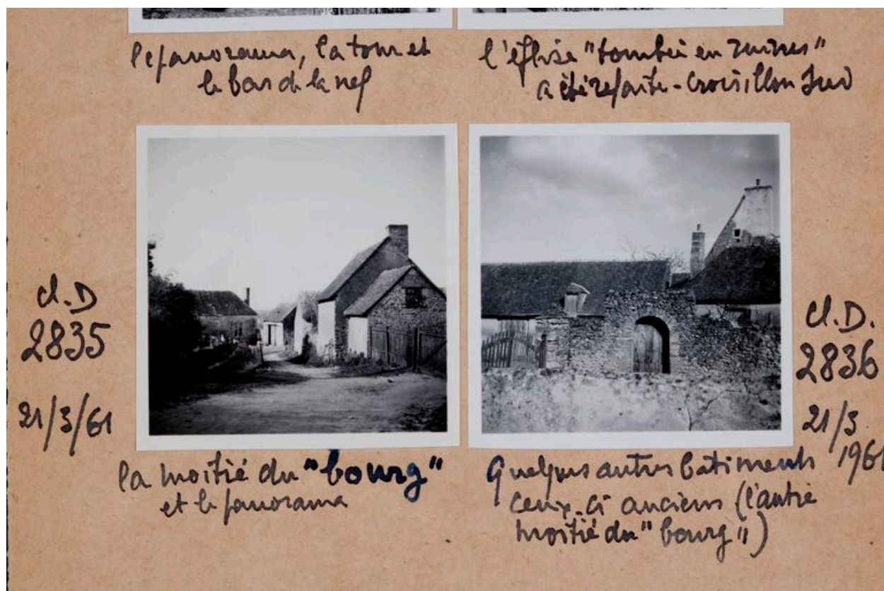
Vue du fournil en 1961.