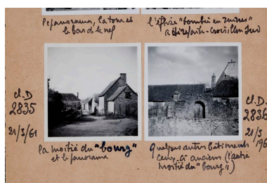
Vue du fournil en 1961.