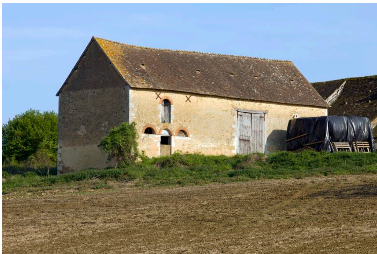
Grange-étable-fenil, vue depuis le nord-ouest.