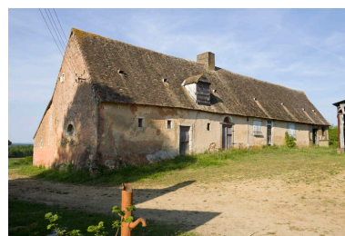
Logis vu depuis le sud-ouest. IVR52_20117200512NUCA