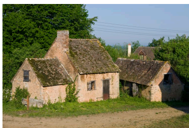
Fournil et porcherie, vus depuis le sud. IVR52_20117200521NUCA