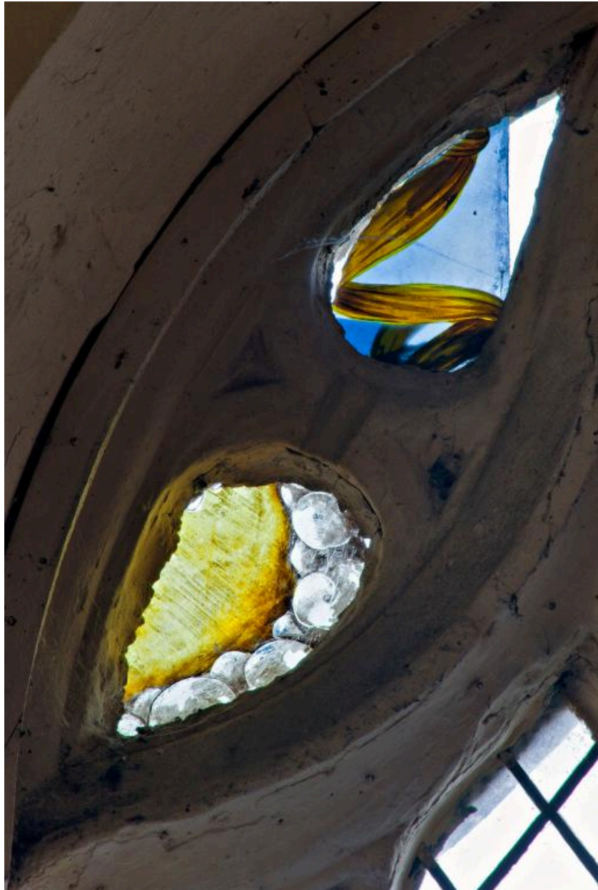
Verrière : détail.