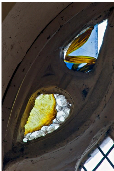
Verrière : détail. IVR52_20117201564NUCA