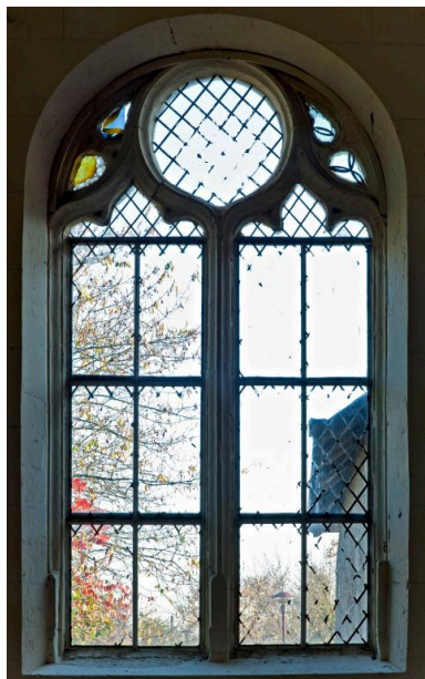
Verrière : vue générale.