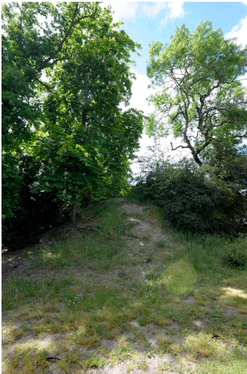
Détail d'un tertre aménagé dans le jardin.