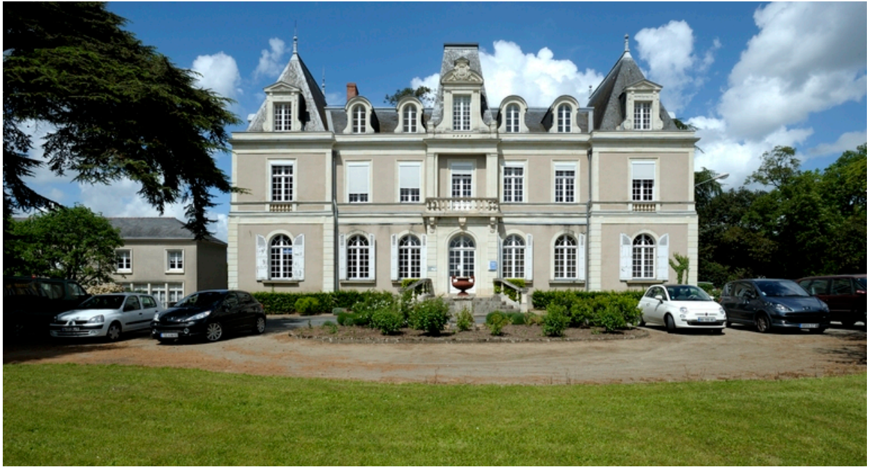
Vue de la façade sud.