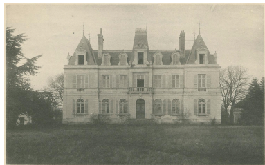
Château de la Roche-Morna. Photographie, 2e moitié XIXe siècle. IVR52_20174901769NUCA