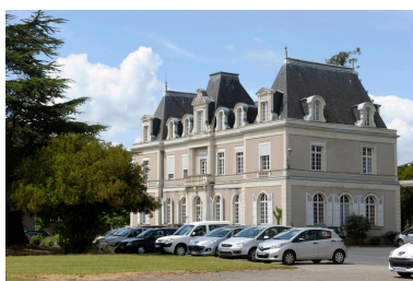
Vue du château depuis le sud-est.