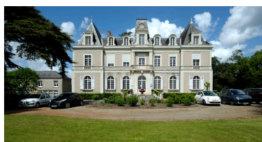
Vue de la façade sud. IVR52_20134900623NUCA