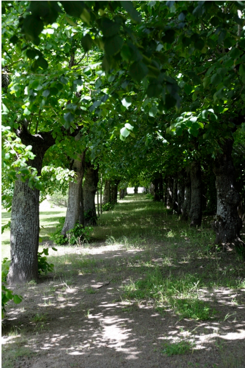
Vue de l'allée de tilleul.