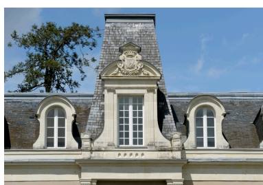
Détail des lucarnes de la façade sud.