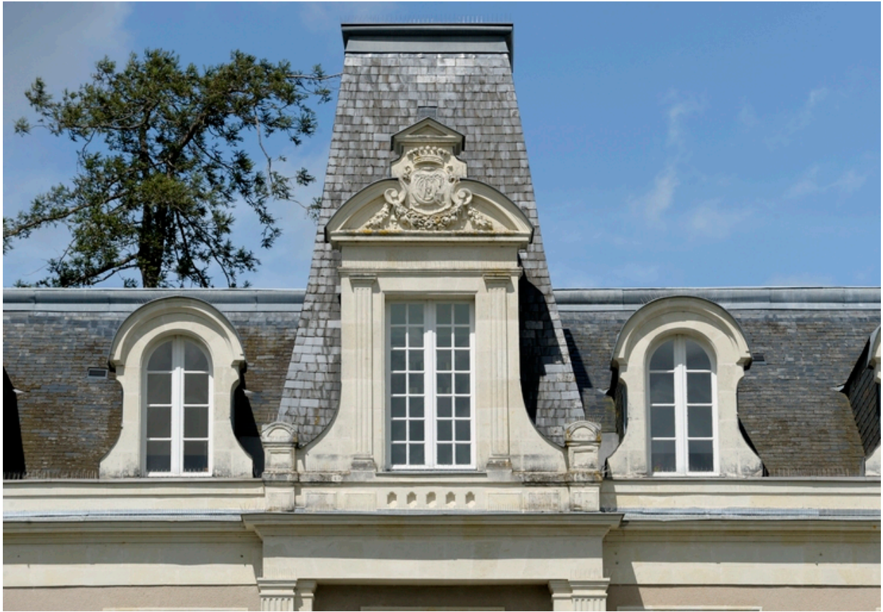
Détail des lucarnes de la façade sud.