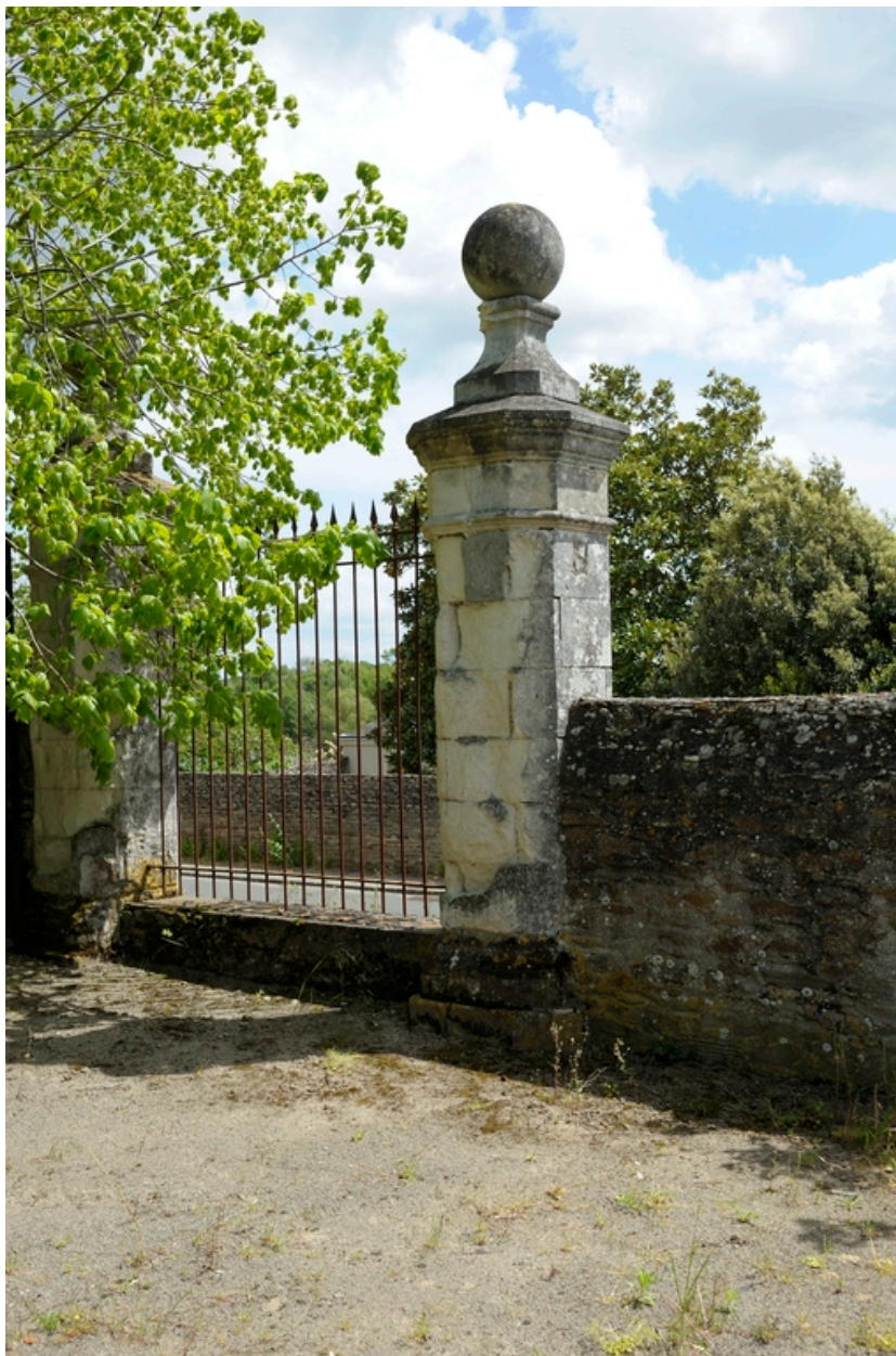
Vue de l'ahah aménagé dans le mur de clôture, côté Loire.