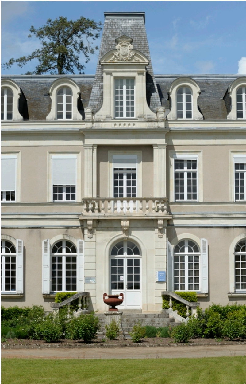
Détail de la travée centrale de la façade sud.