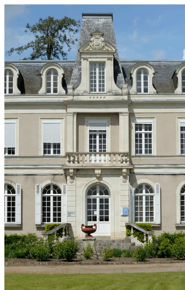
Détail de la travée centrale de la façade sud.