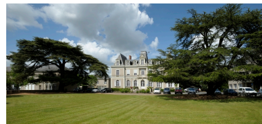
Vue d'ensemble depuis le sud. IVR52_20134900625NUCA