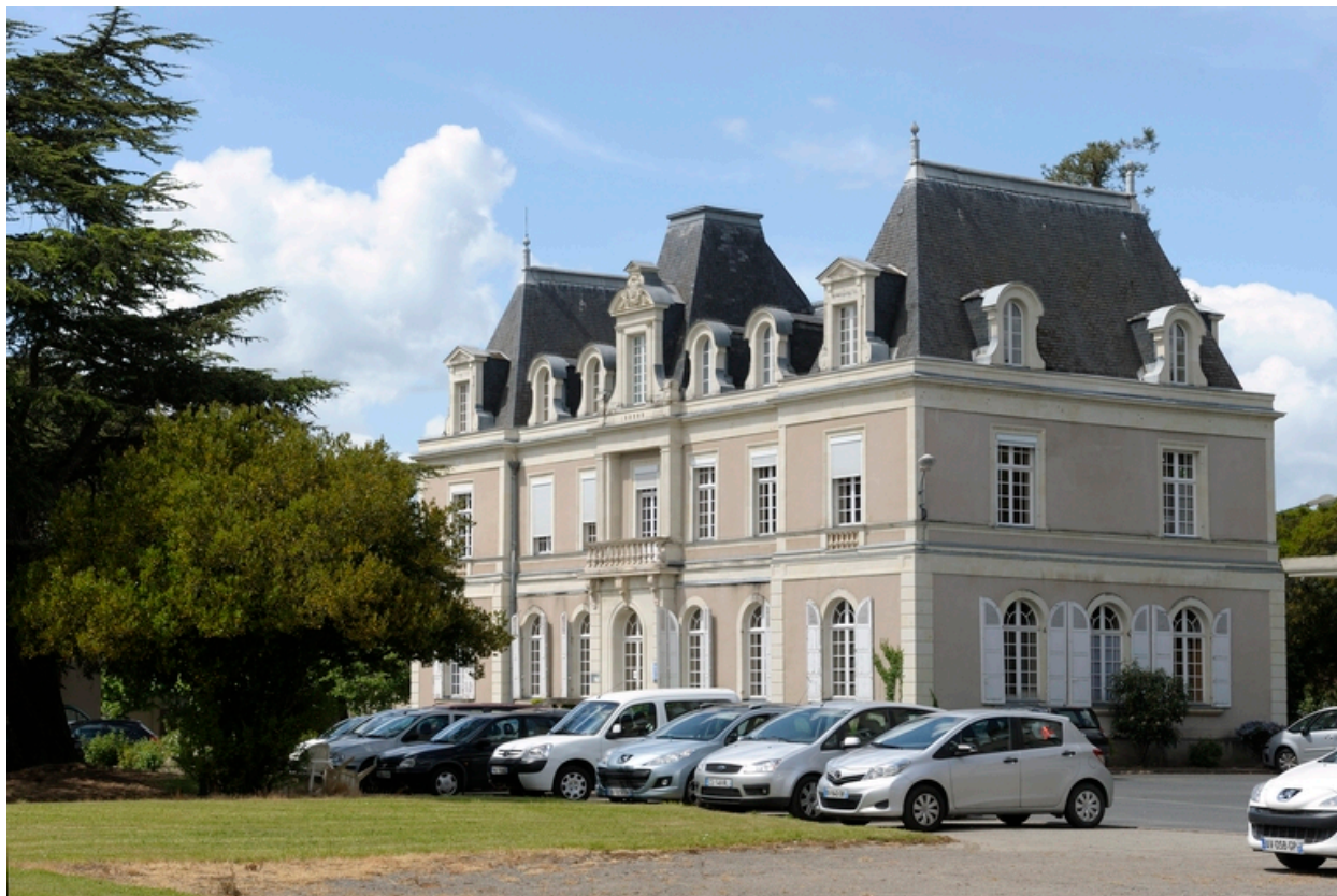
Vue du château depuis le sud-est.