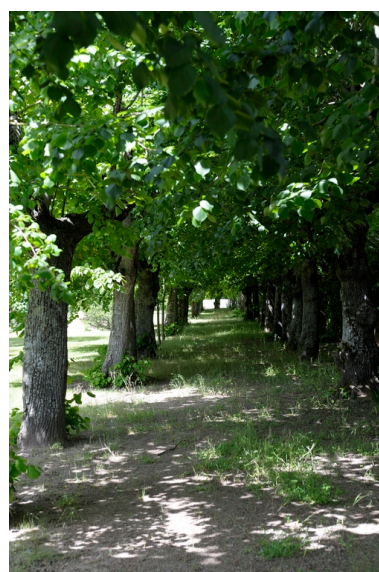
Vue de l'allée de tilleul.