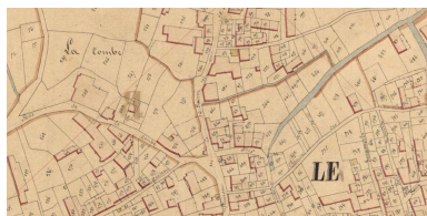
La parcelle 454, au centre, sur le plan cadastral de 1836.

Repro. Yannis Suire IVR52_20198501629NUCA