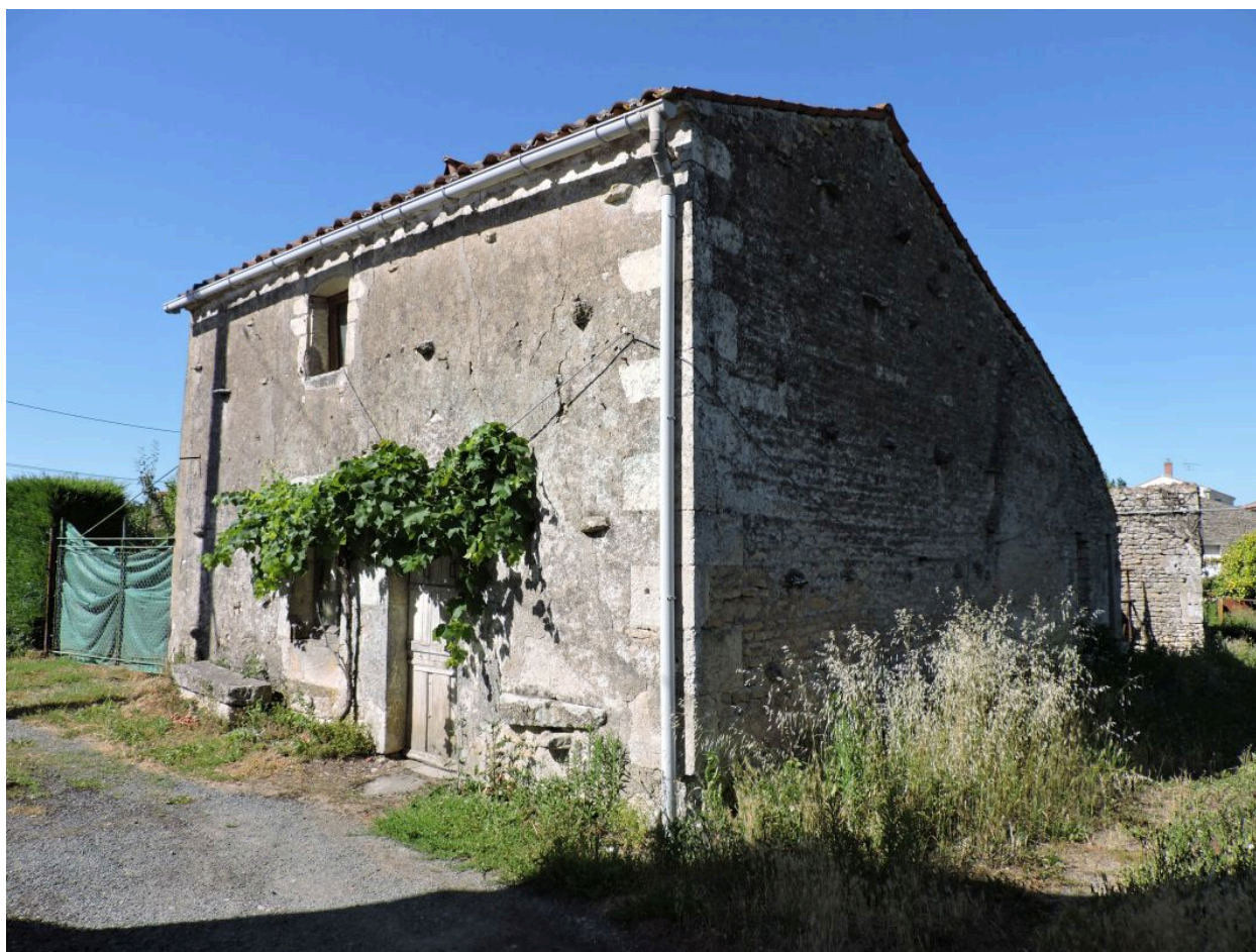
La maison vue depuis le sud.