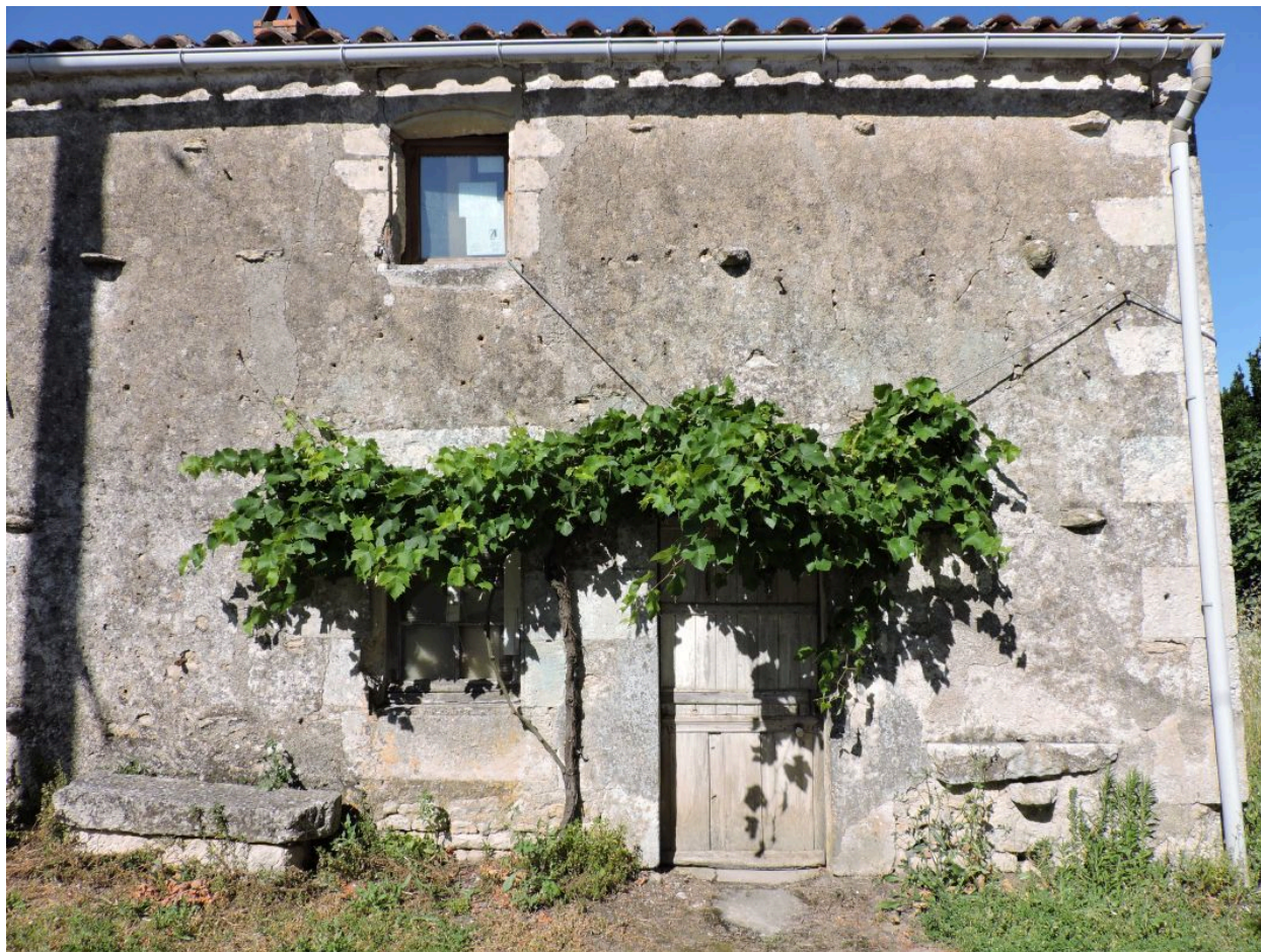
La façade de la maison.