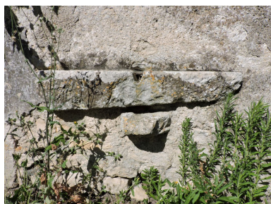
La pierre d'évier.

IVR52_20198501708NUCA