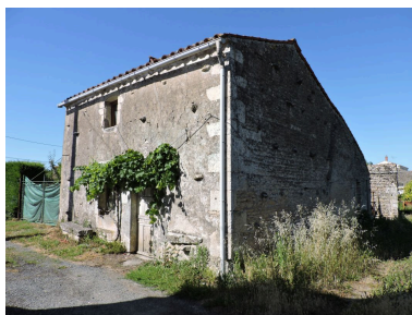
La maison vue depuis le sud.

Repro. Yannis Suire IVR52_20198501629NUCA