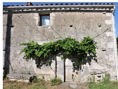
La façade de la maison.

IVR52_20198501707NUCA