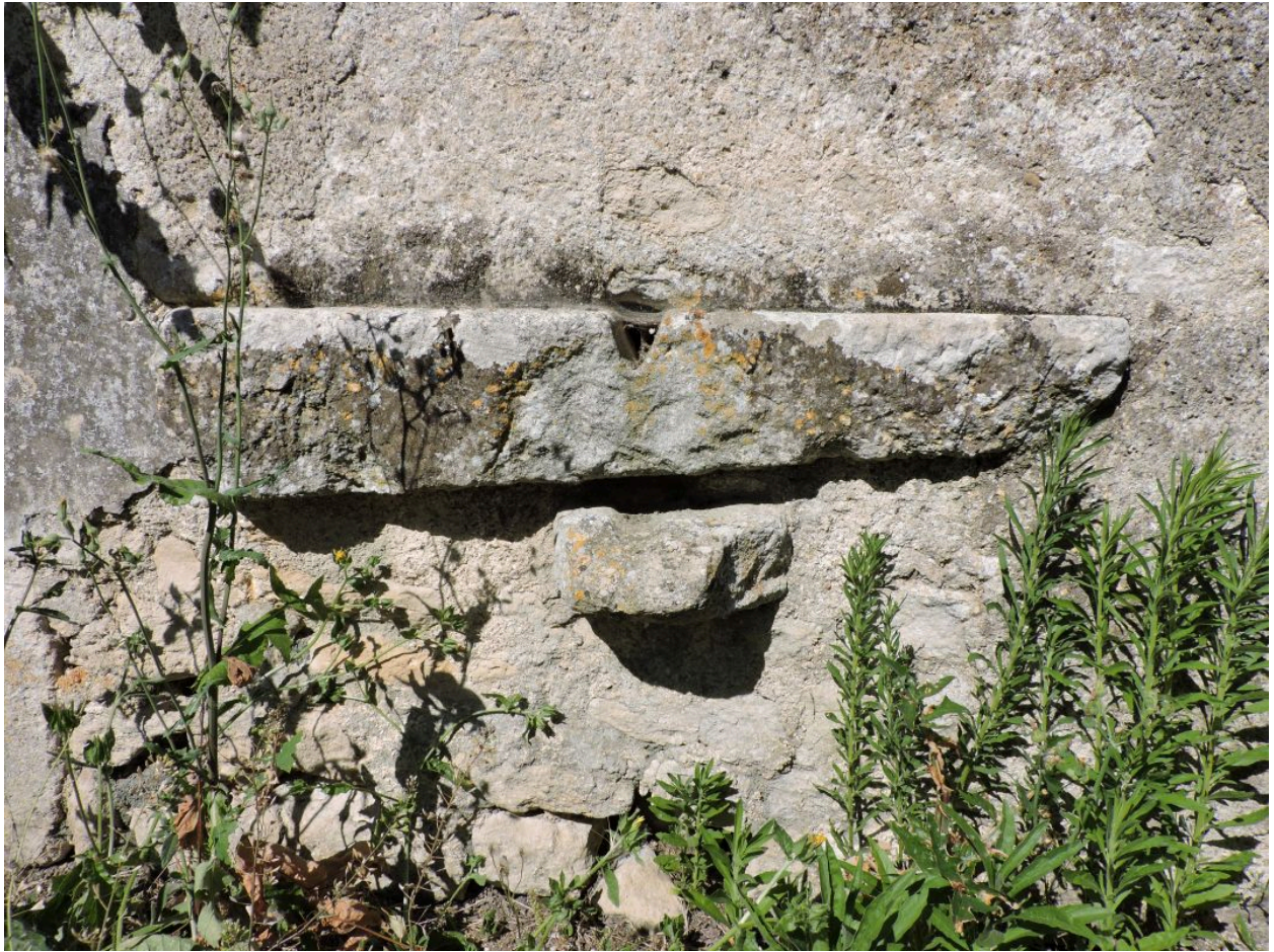
La pierre d'évier.