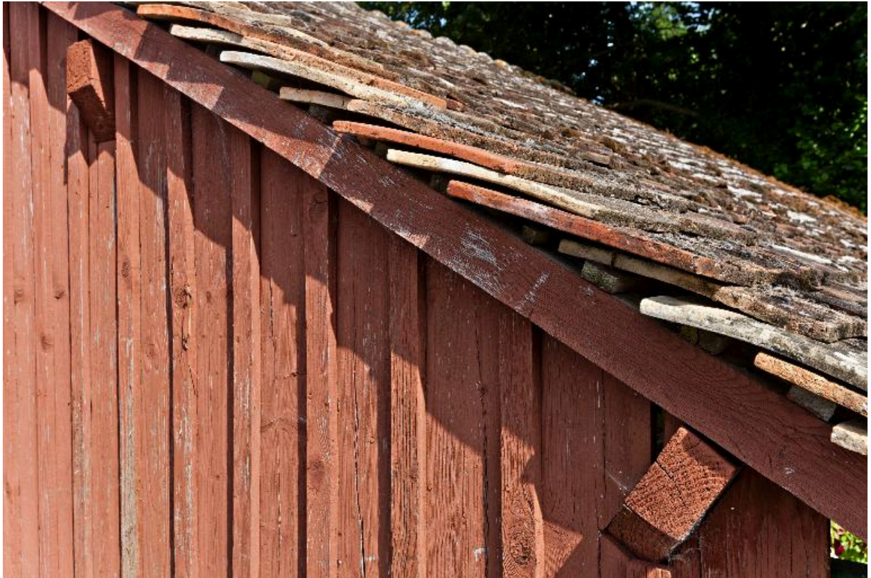
Détail de l'essentage de planches du pignon gauche.