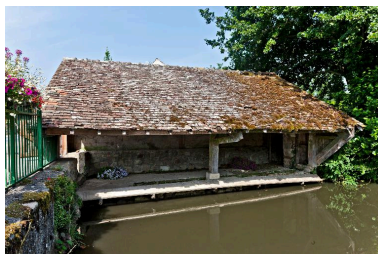
Vue générale. IVR52_20147201762NUCA

IVR52_20147201746NUCA