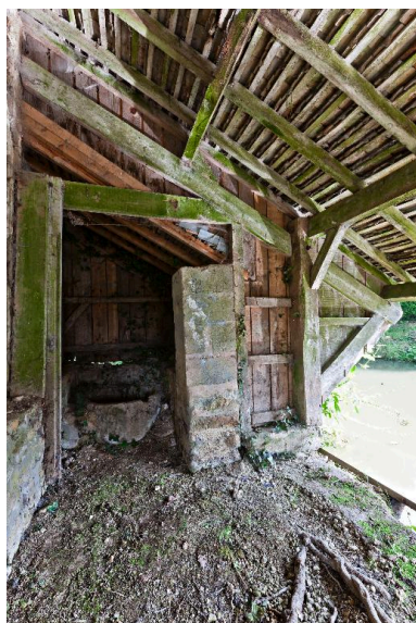
Vue intérieure. Au fond, l'emplacement de la chaudière.

IVR52_20147201761NUCA