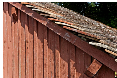
Détail de l'essentage de planches du pignon gauche. IVR52_20147201763NUCA