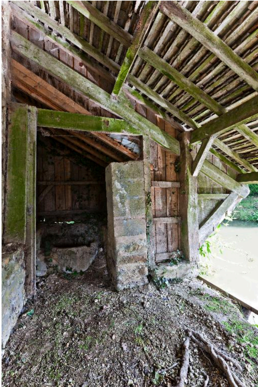
Vue intérieure. Au fond, l'emplacement de la chaudière.