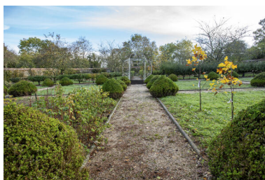
Le potager.