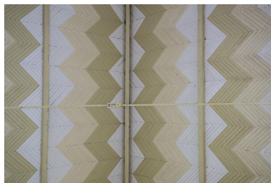
L'orangerie, détail du plafond.