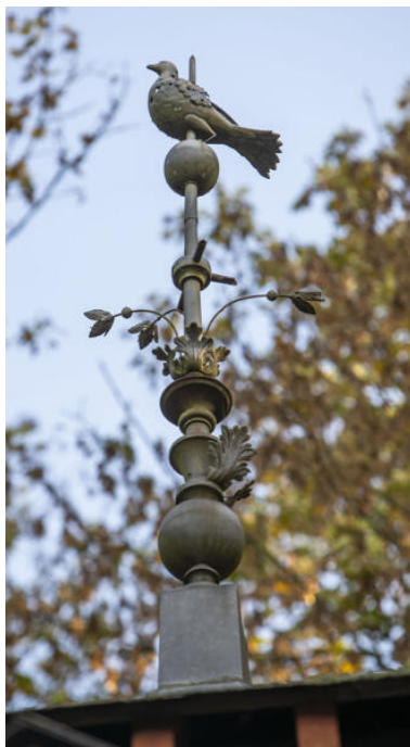
Le pavillon carré au centre du commun en hémicycle, détail de l'épi de faîtage.