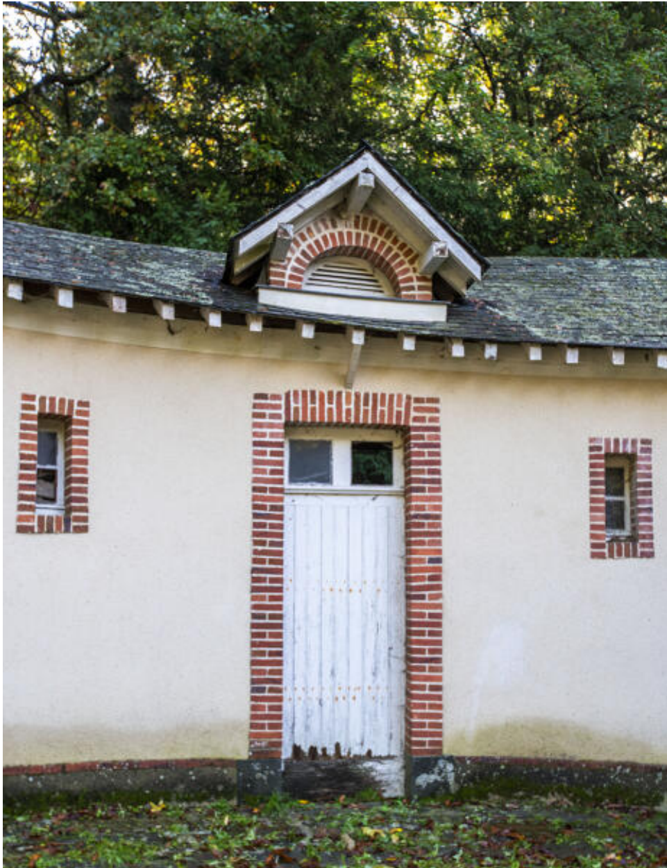
Le commun en hémicycle, entrée d'un box.