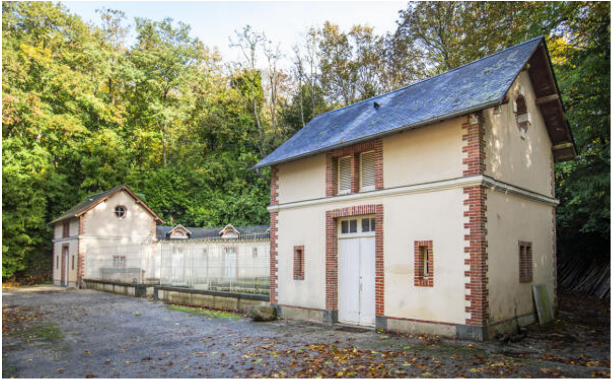
Le commun en hémicycle.