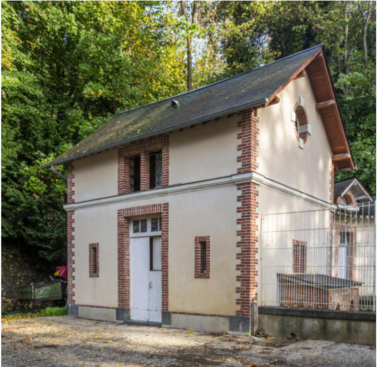
Le commun en hémicycle, détail d'un pavillon.