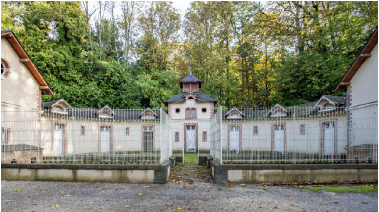
Le commun en hémicycle et les chenils.