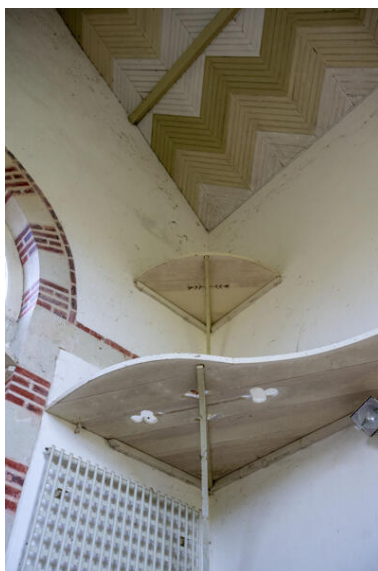
L'orangerie, détail des étagères. IVR52_20235301750NUCA