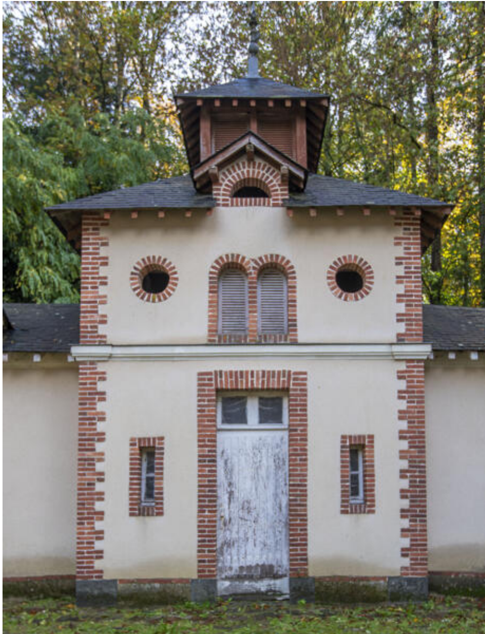
Le pavillon carré au centre du commun en hémicycle.