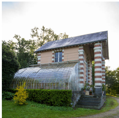
L'orangerie.