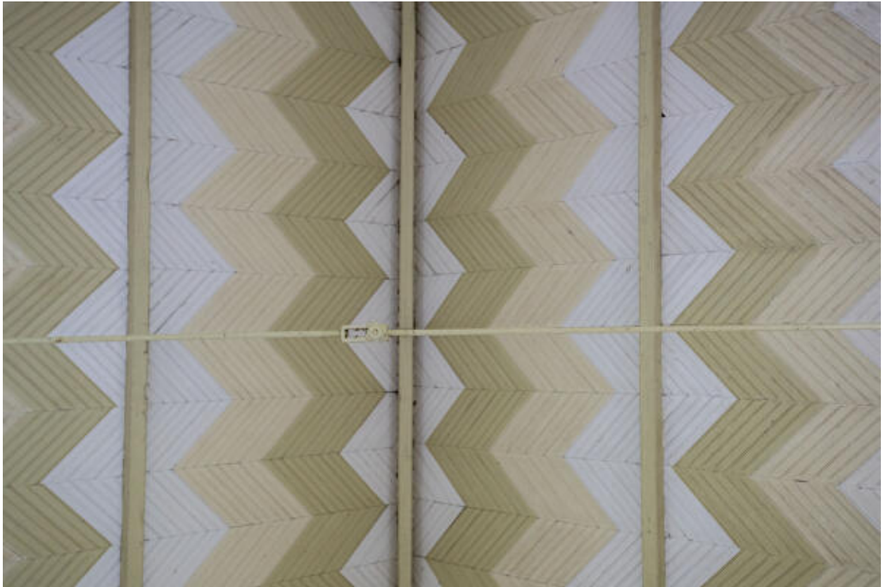
L'orangerie, détail du plafond.