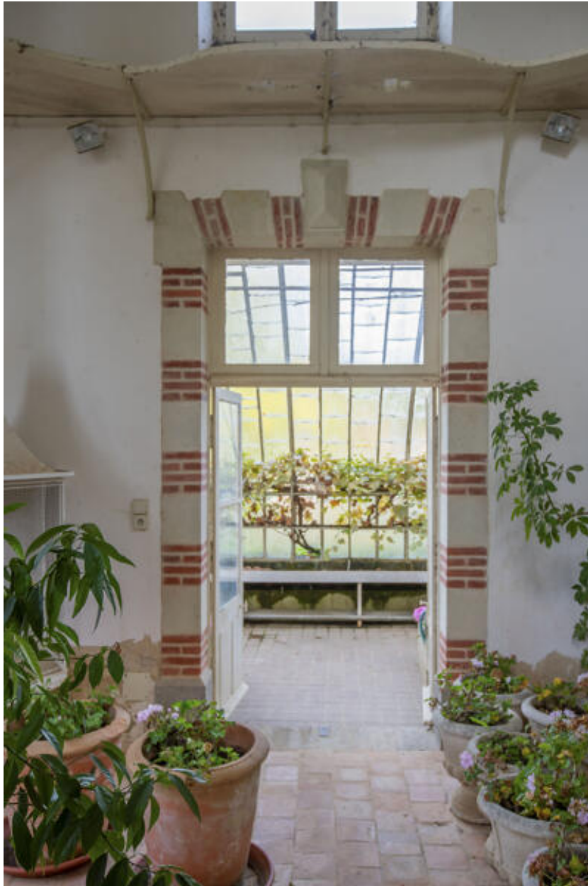
L'orangerie, porte d'accès à la serre nord.