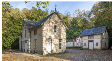
Les deux bâtiments des écuries-remises.