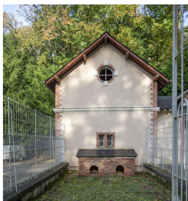
Un chenil. IVR52_20235301729NUCA