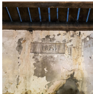
La date portée dans le pavillon carré.