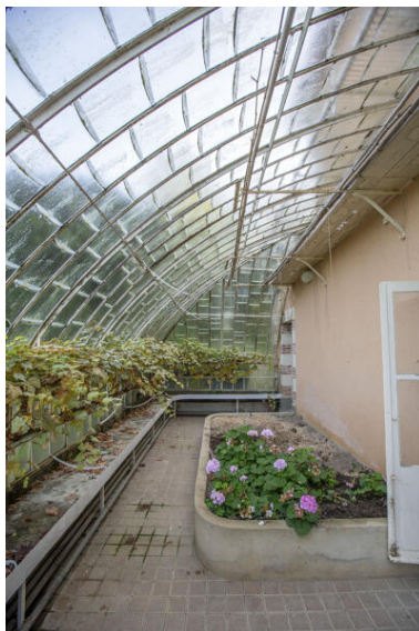
L'orangerie, la serre nord IVR52_20235301749NUCA