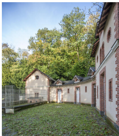
Le commun en hémicycle, la cour. IVR52_20235301728NUCA