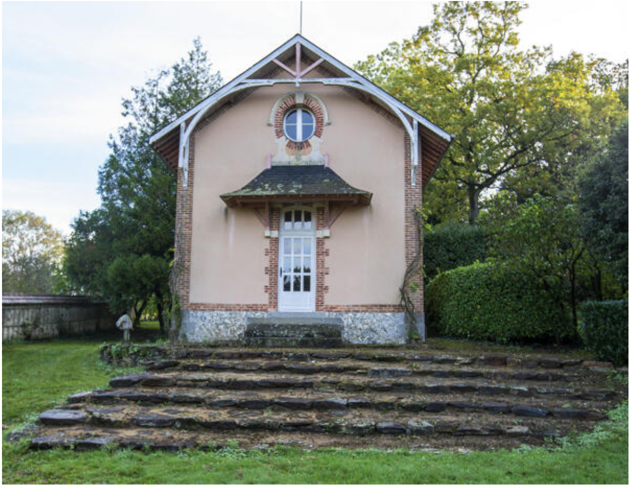
Le logement du jardinier.