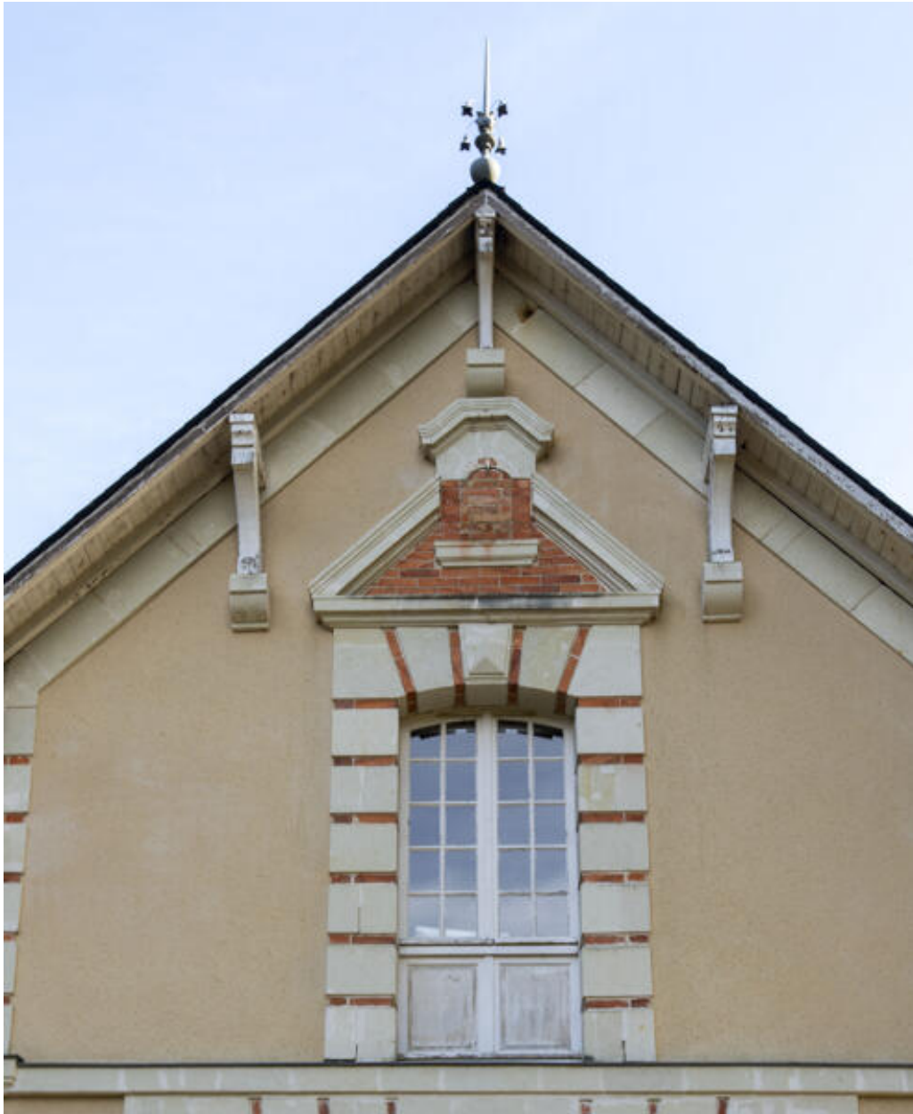
La seconde écurie-remise, détail d'un pignon.