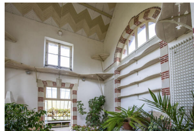
L'orangerie, l'intérieur. IVR52_20235301755NUCA