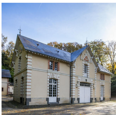
La seconde écurie-remise. IVR52_20235301723NUCA