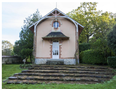
Le logement du jardinier.