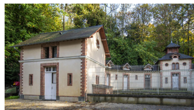
Le commun en hémicycle et les chenils. IVR52_20235301724NUCA