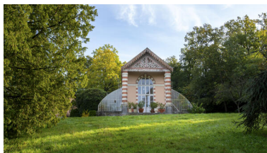
L'orangerie. IVR52_20235301757NUCA