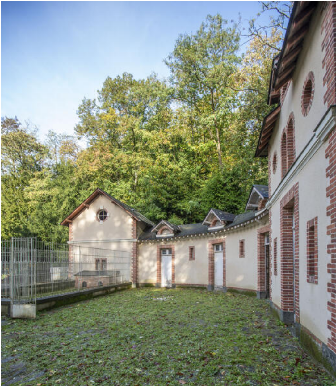
Le commun en hémicycle, la cour.