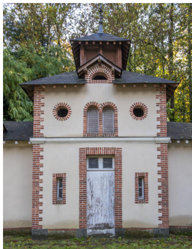
Le pavillon carré au centre du commun en hémicycle. IVR52_20235301733NUCA