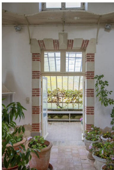
L'orangerie, porte d'accès à la serre nord.