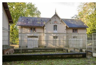
La seconde écurie-remise.