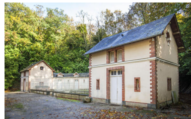
Le commun en hémicycle. IVR52_20235301735NUCA