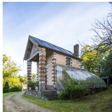
L'orangerie. IVR52_20235301747NUCA