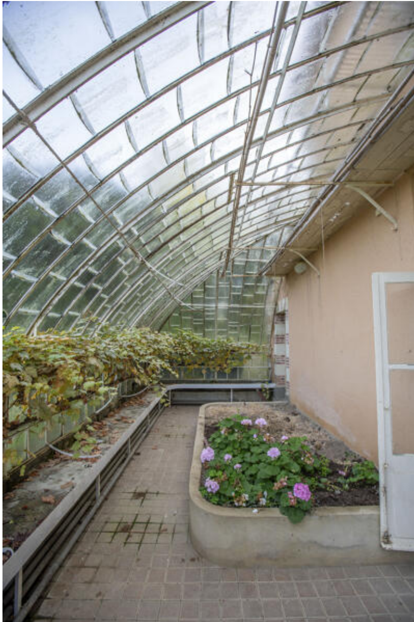
L'orangerie, la serre nord