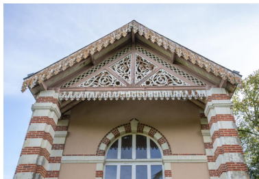
L'orangerie, détail des ornements en bois découpé.