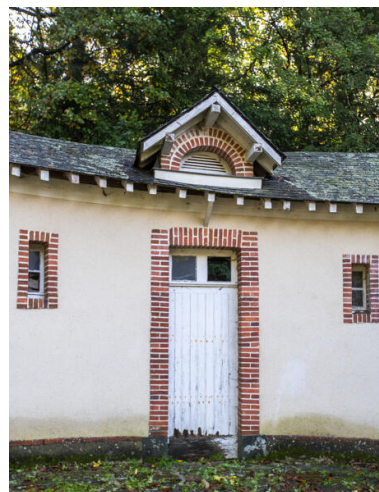
Le commun en hémicycle, entrée d'un box.