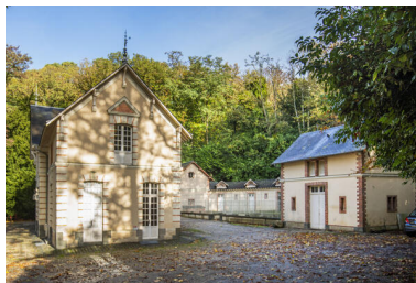
Les deux bâtiments des écuries-remises.