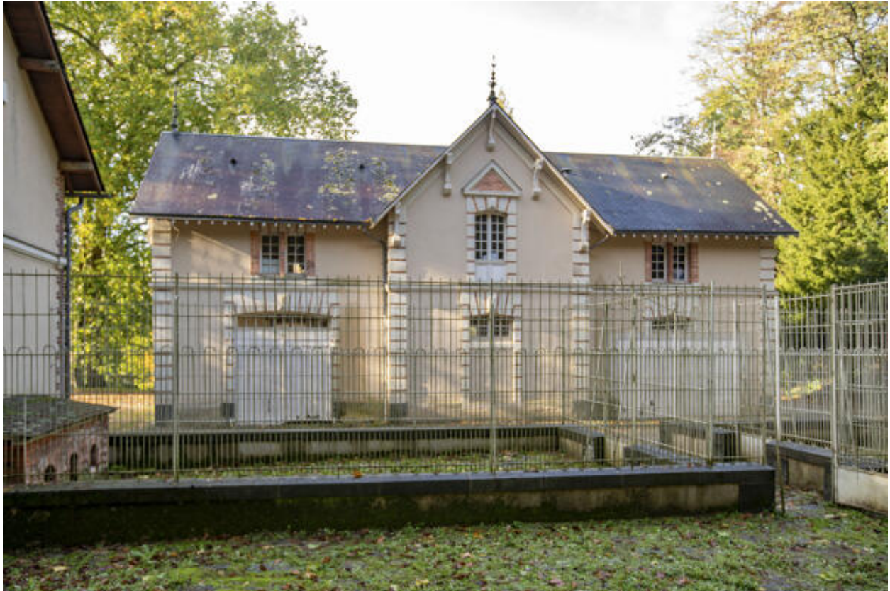
La seconde écurie-remise.