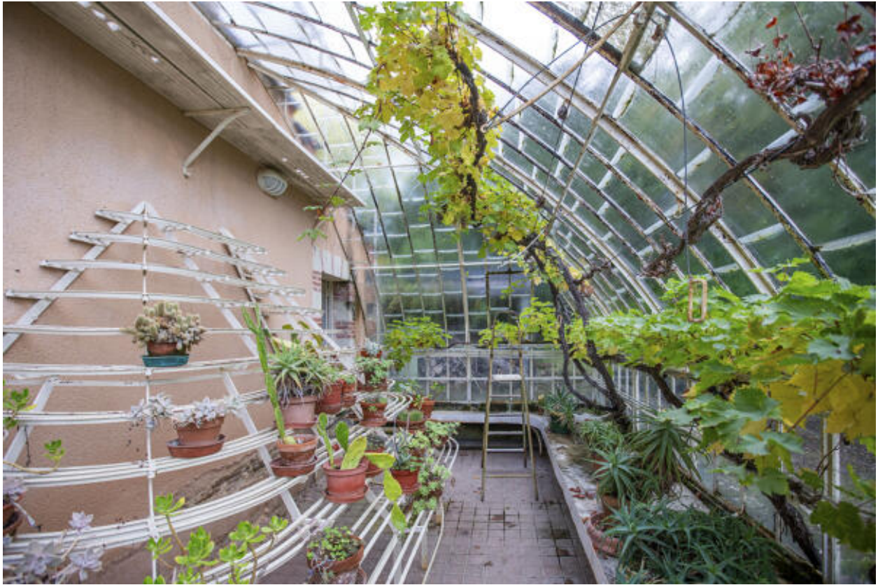
L'orangerie, la serre sud.