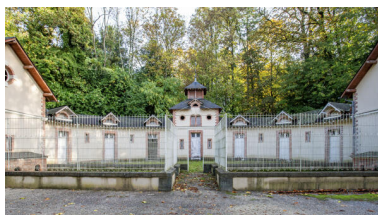
Le commun en hémicycle et les chenils. IVR52_20235301731NUCA