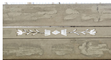
L'orangerie, détail d'une étagère.