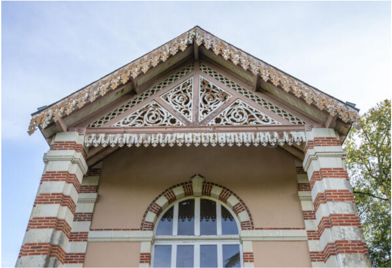
L'orangerie, détail des ornements en bois découpé.