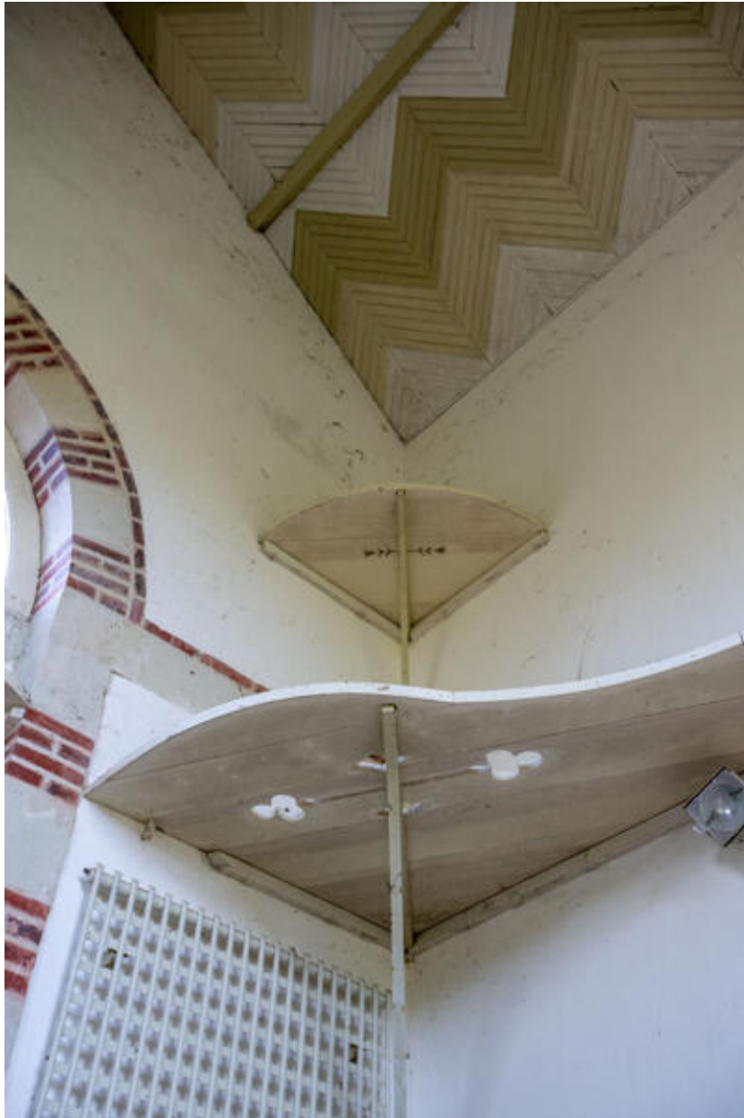
L'orangerie, détail des étagères.