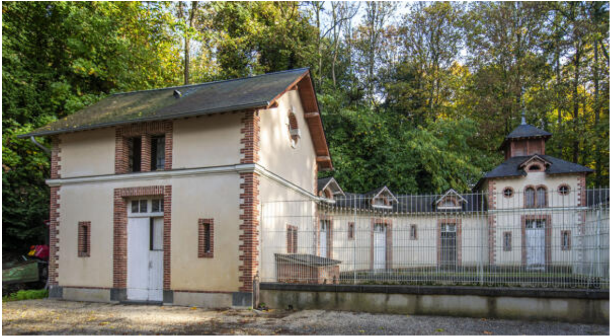
Le commun en hémicycle et les chenils.