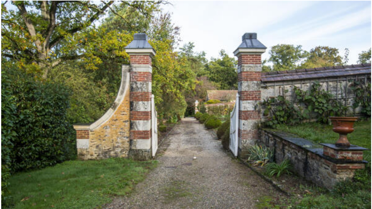
Un portail du potager.