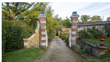
Un portail du potager.