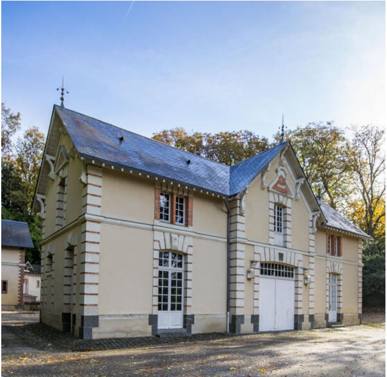
La seconde écurie-remise.