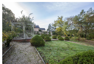
Le potager.