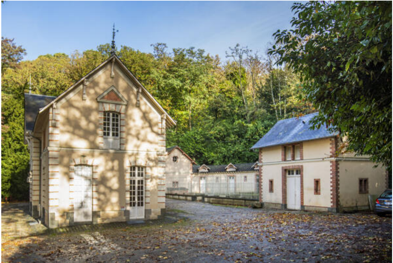
Les deux bâtiments des écuries-remises.