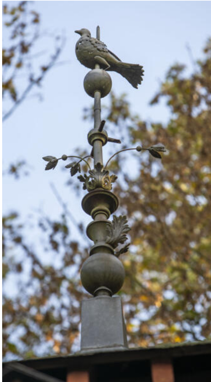
Le pavillon carré au centre du commun en hémicycle, détail de l'épi de faitage.