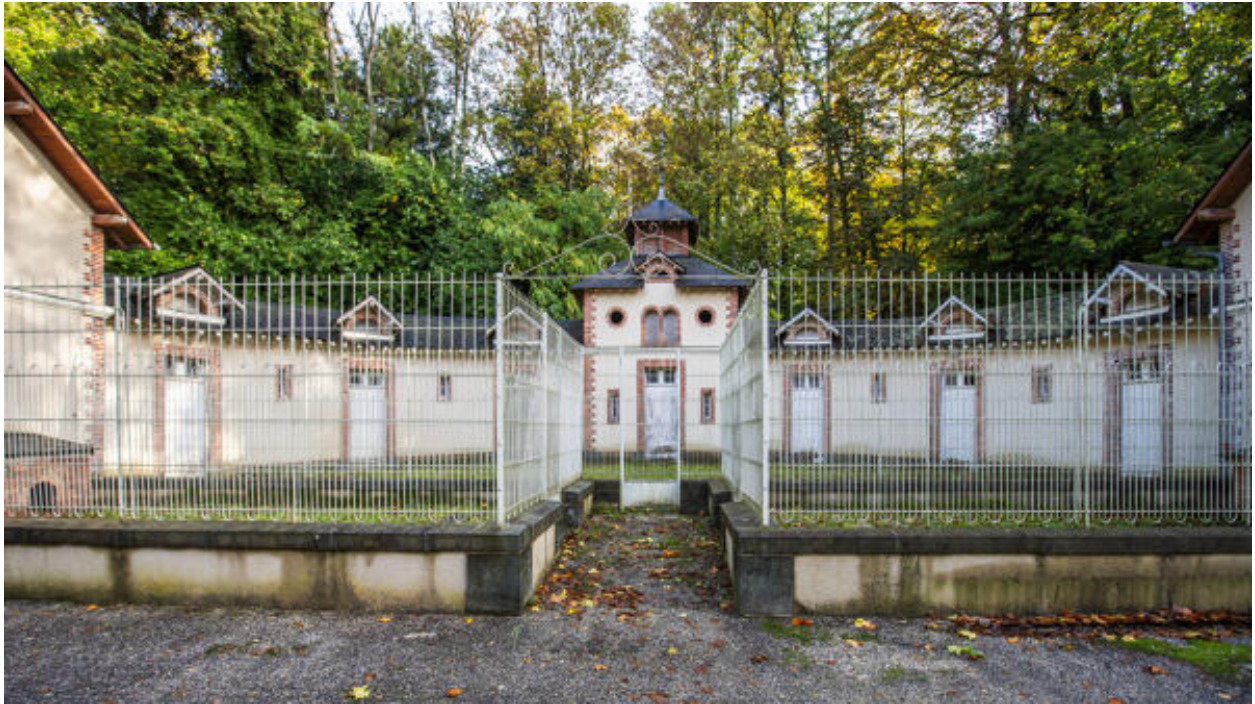
Le commun en hémicycle et les chenils.