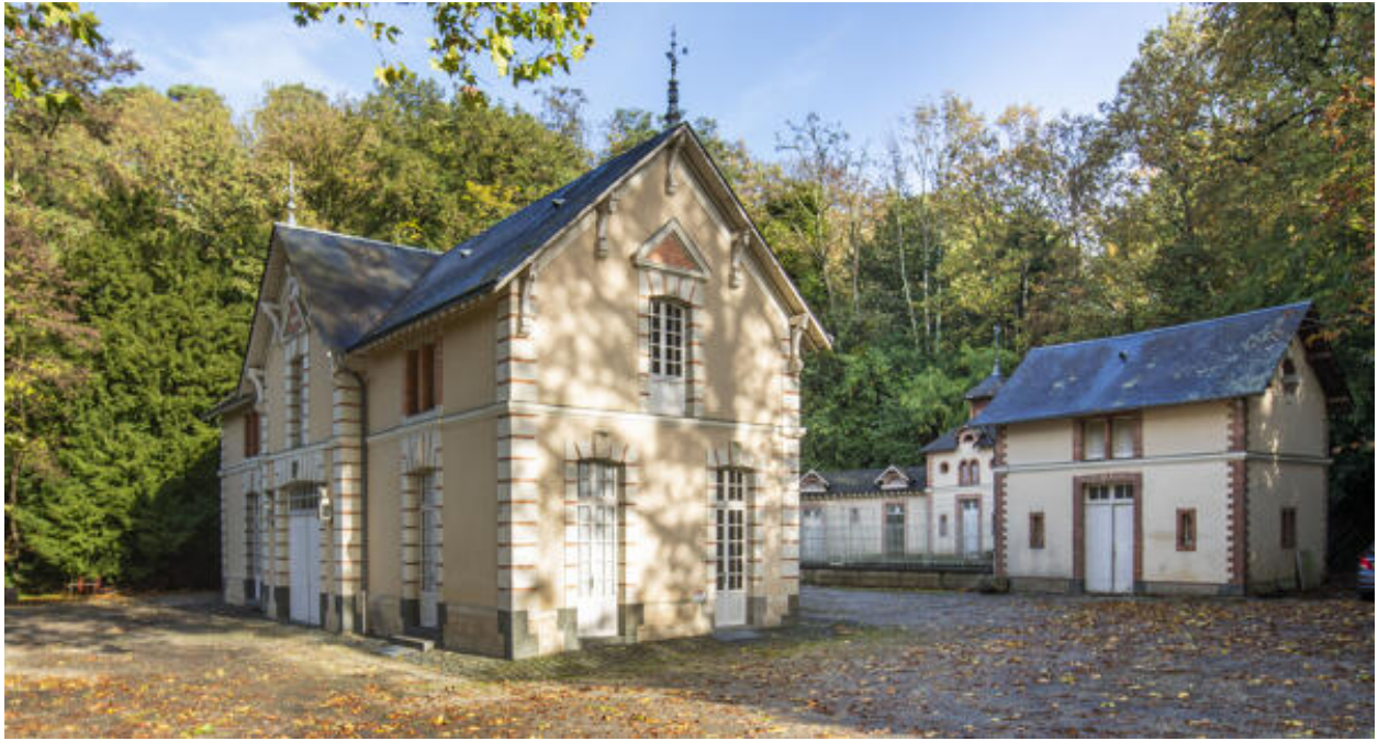
Les deux bâtiments des écuries-remises.