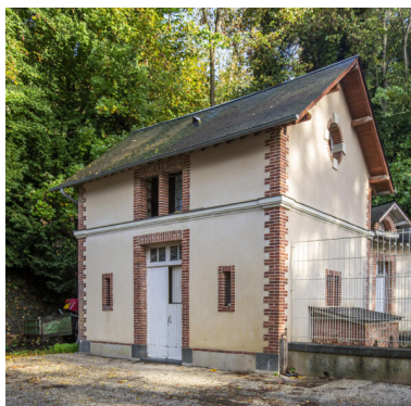
Le commun en hémicycle, détail d'un pavillon.