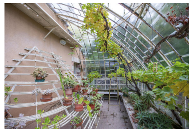
L'orangerie, la serre sud. IVR52_20235301753NUCA