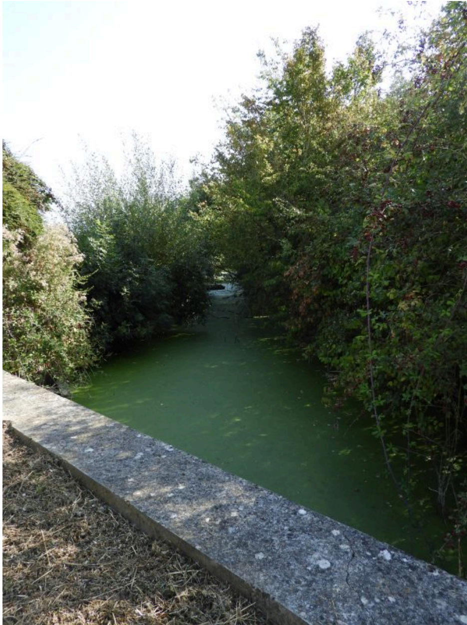
Le petit canal à son arrivée en amont du Quaireau, vu depuis l'ouest, avant le passage sous la digue qui le sépare du canal de Vix.