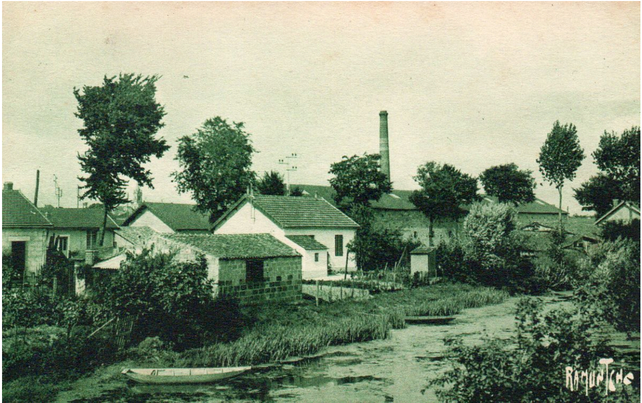
Maisons le long de l'embouchure du petit canal vers 1930.