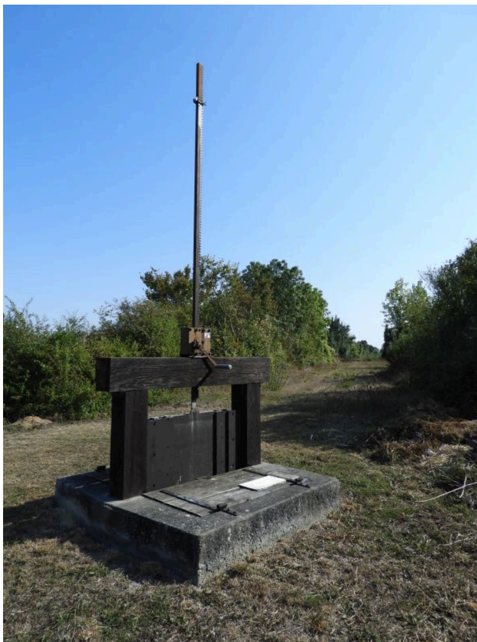
La vanne à l'embouchure du petit canal, vue depuis l'ouest.