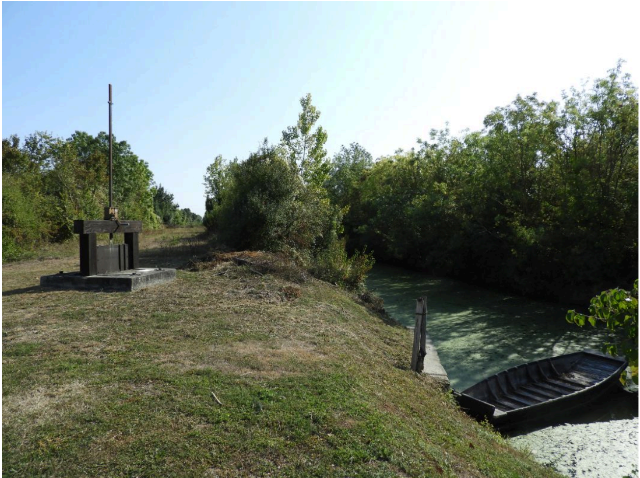
La digue entre le petit canal, à gauche, et le canal de Vix, à droite, avec la vanne à l'embouchure du premier, près du Quaireau de L'Île-d'Elle, vus depuis l'ouest.