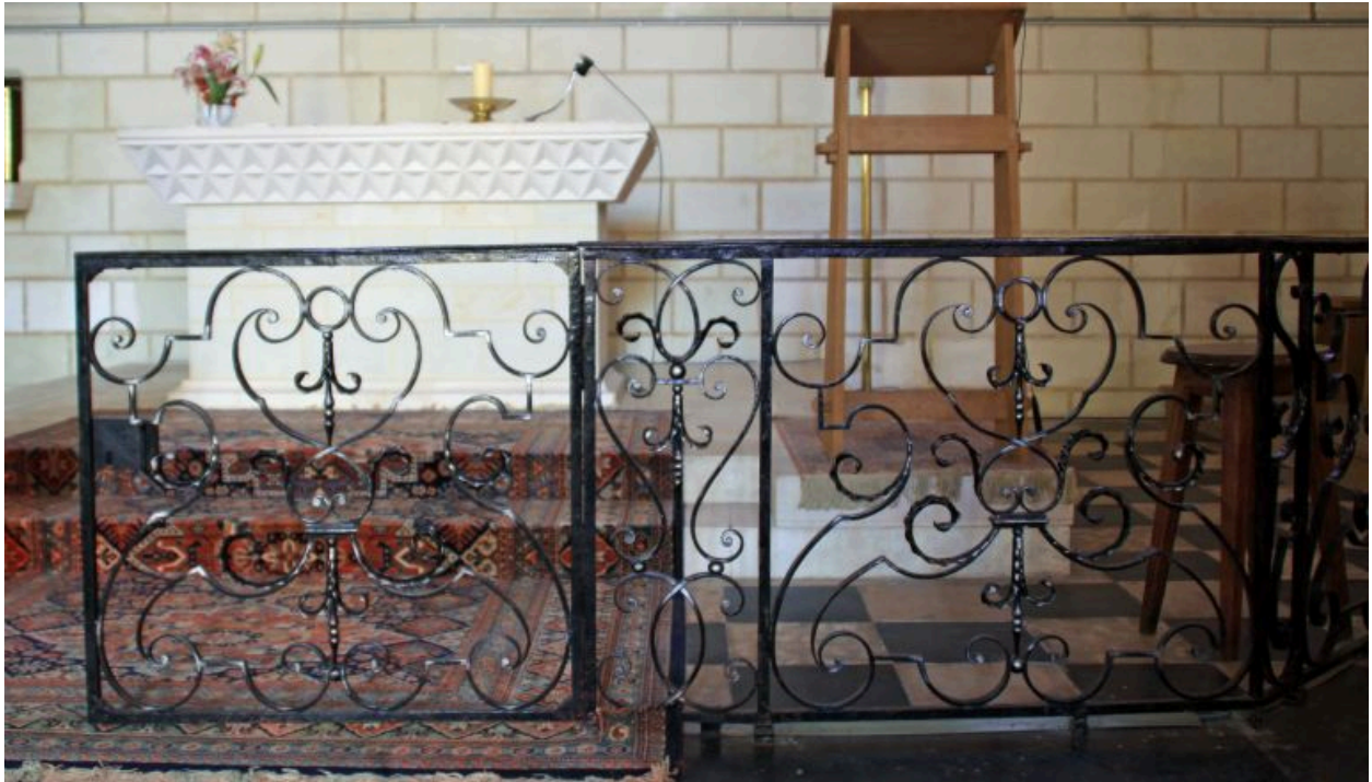
Vue d'ensemble de la clôture de chœur.