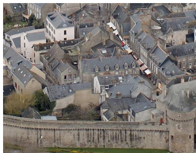
Vue aérienne. IVR52_20074405042NUCA