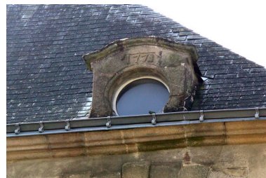
Détail de la lucarne datée.