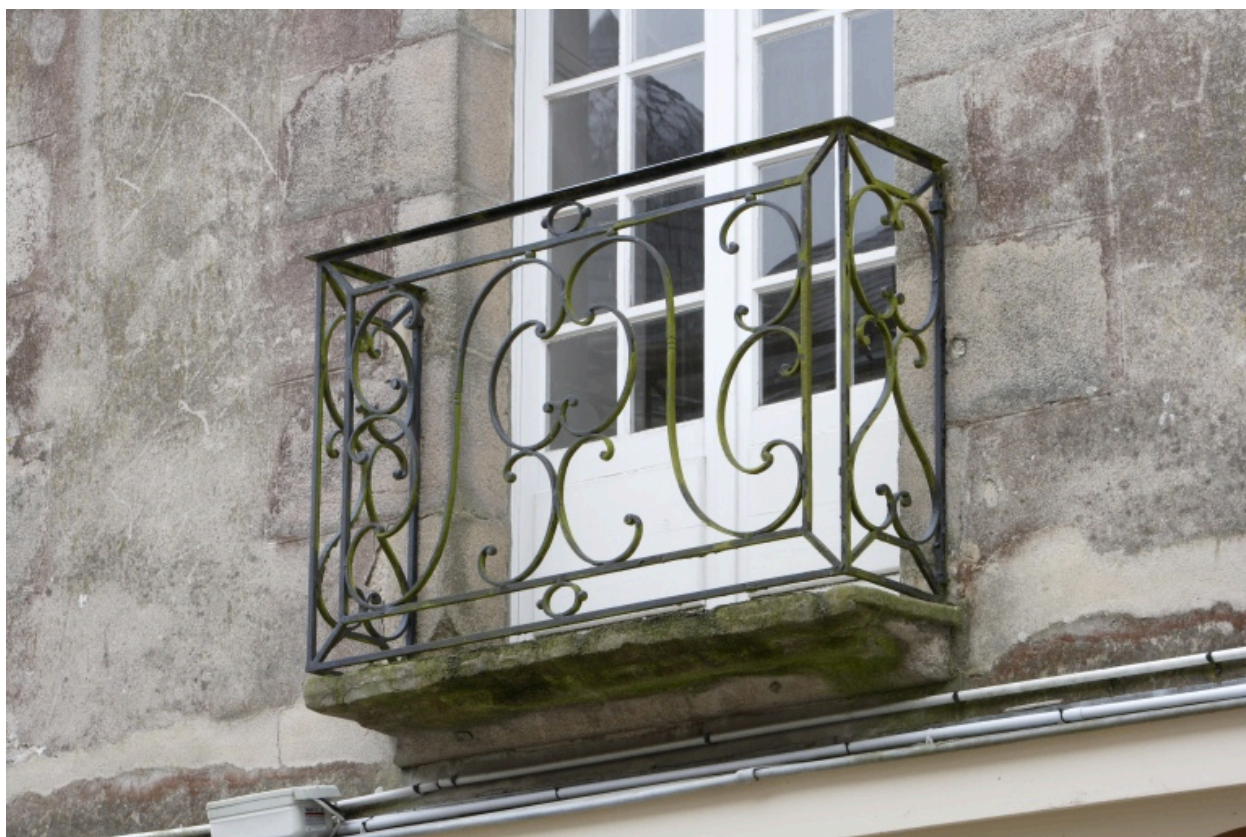
Balconnet avec garde corps en fer forgé.