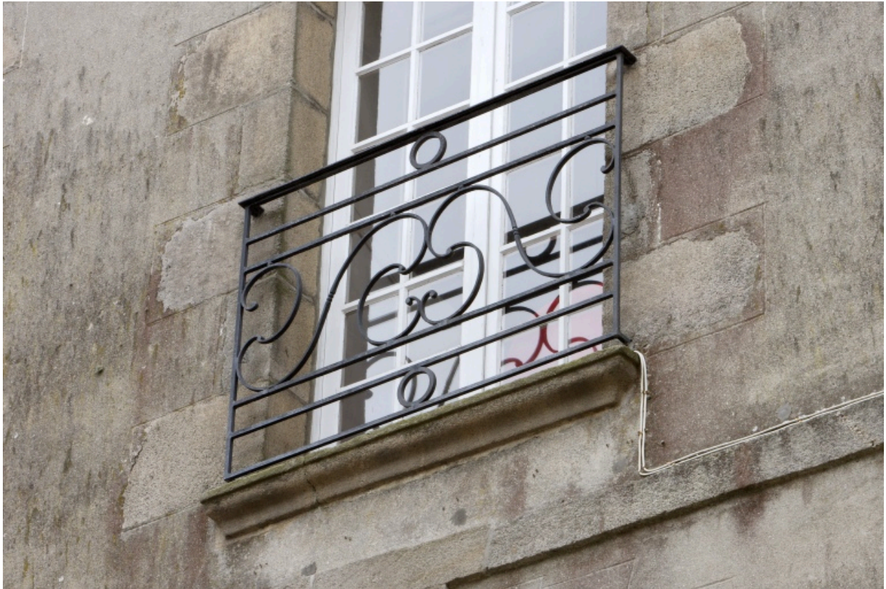
Porte fenêtre avec garde corps en fer forgé.