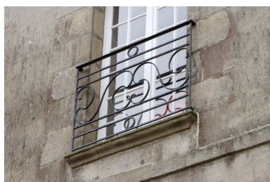
Porte fenêtre avec garde corps en fer forgé.