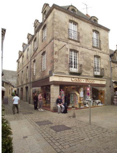
Vue générale vers le Sud-Ouest. IVR52_20074400887NUCA