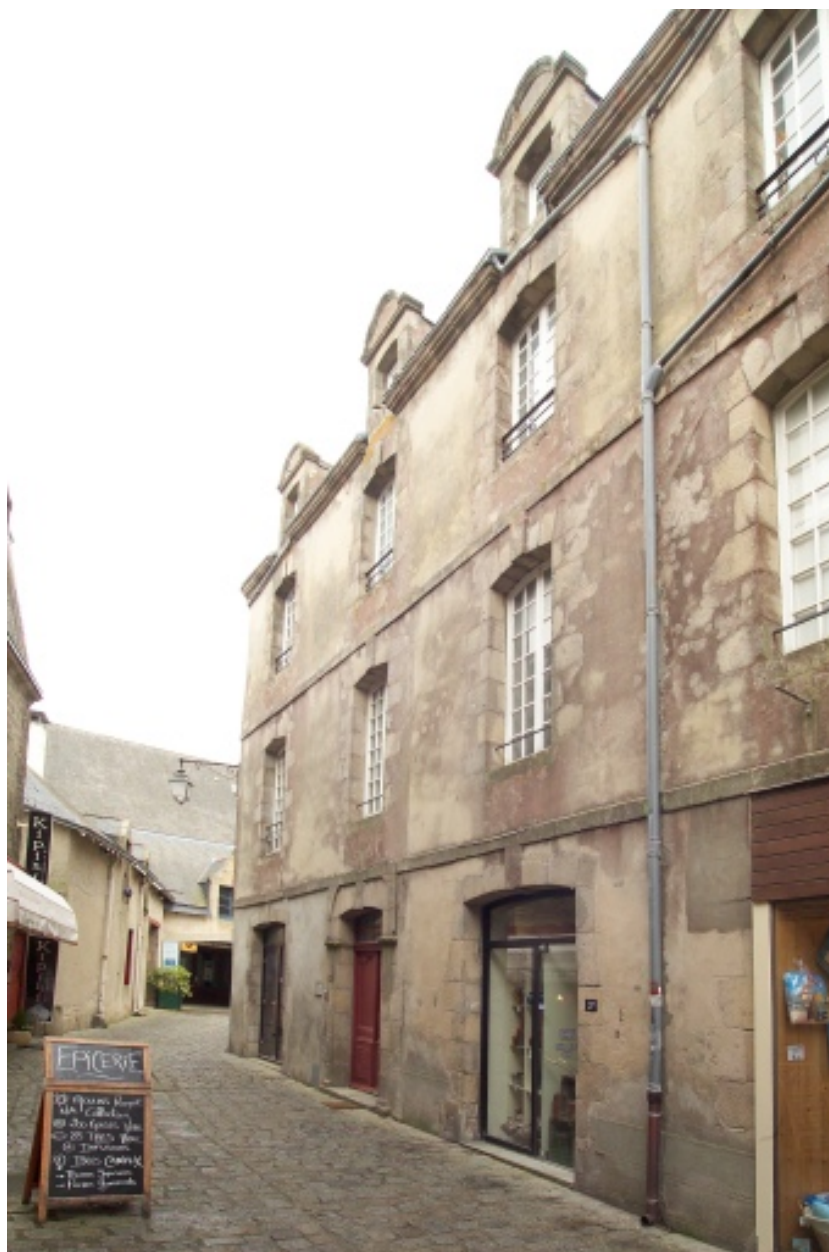
Vue du mur gouttereau bordant la rue de la Juiverie.