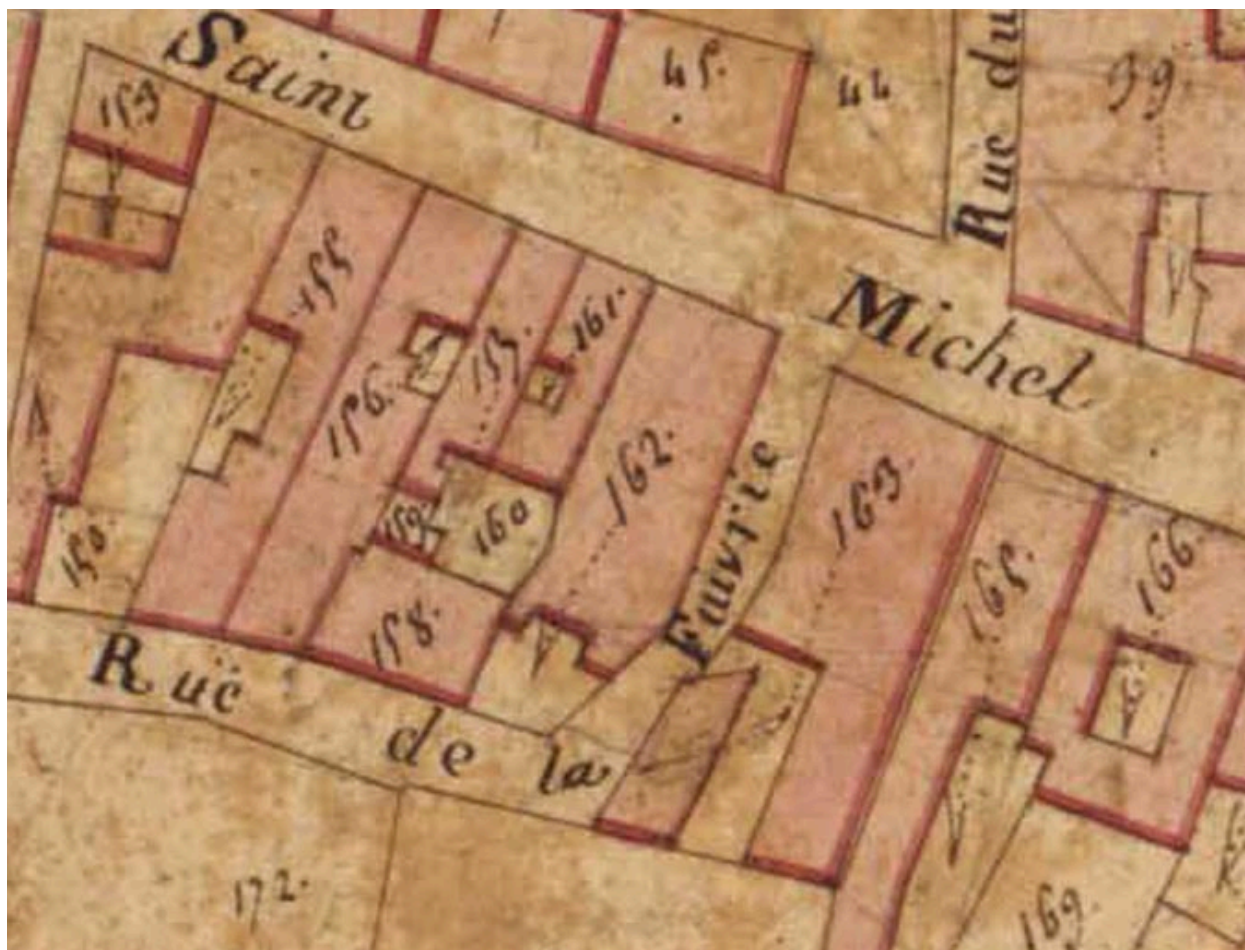
Extrait du plan cadastral de 1819, section Z 162.