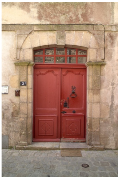
Détail de la porte d'entrée ouvrant dans la rue de la Juiverie. IVR52_20074400755NUCA