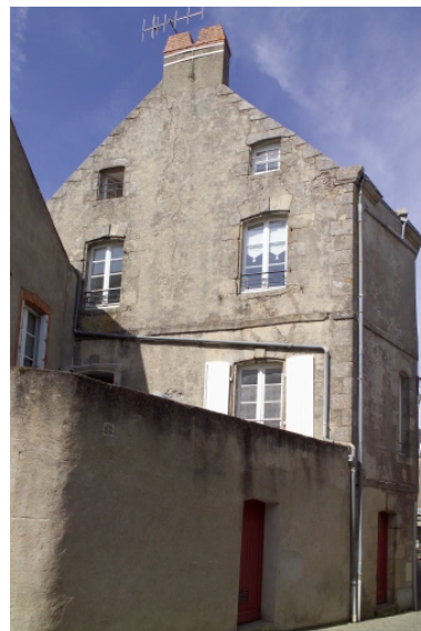
Vue du pignon sud.