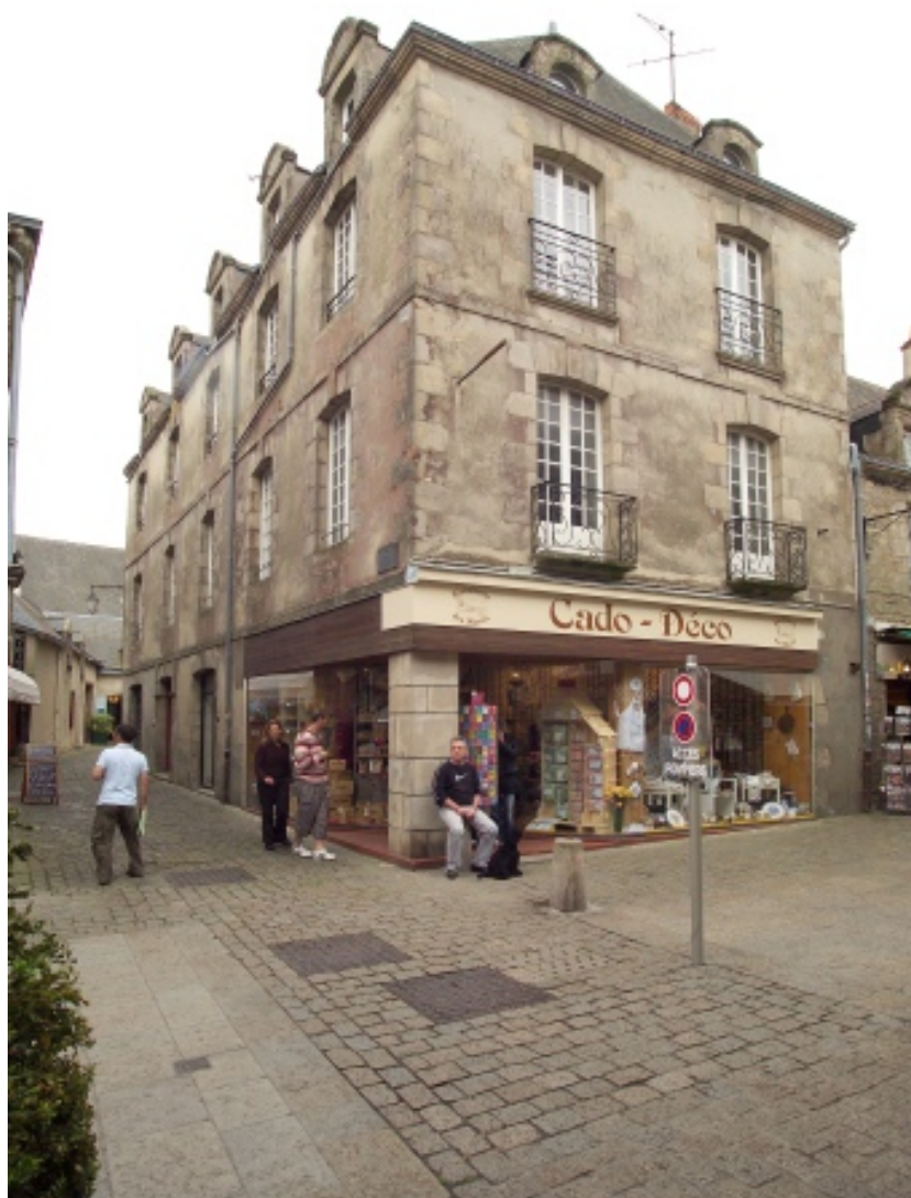
Vue générale vers le Sud-Ouest.