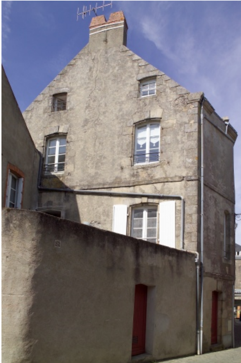
Vue du pignon sud.