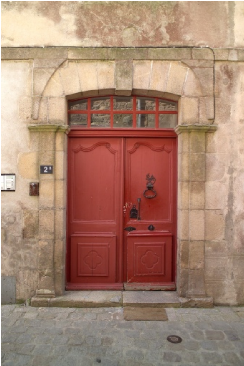
Détail de la porte d'entrée ouvrant dans la rue de la Juiverie.