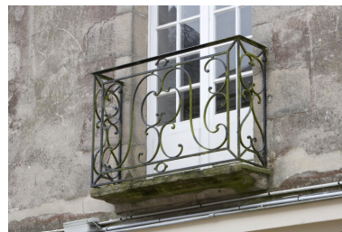
Balconnet avec garde corps en fer forgé.