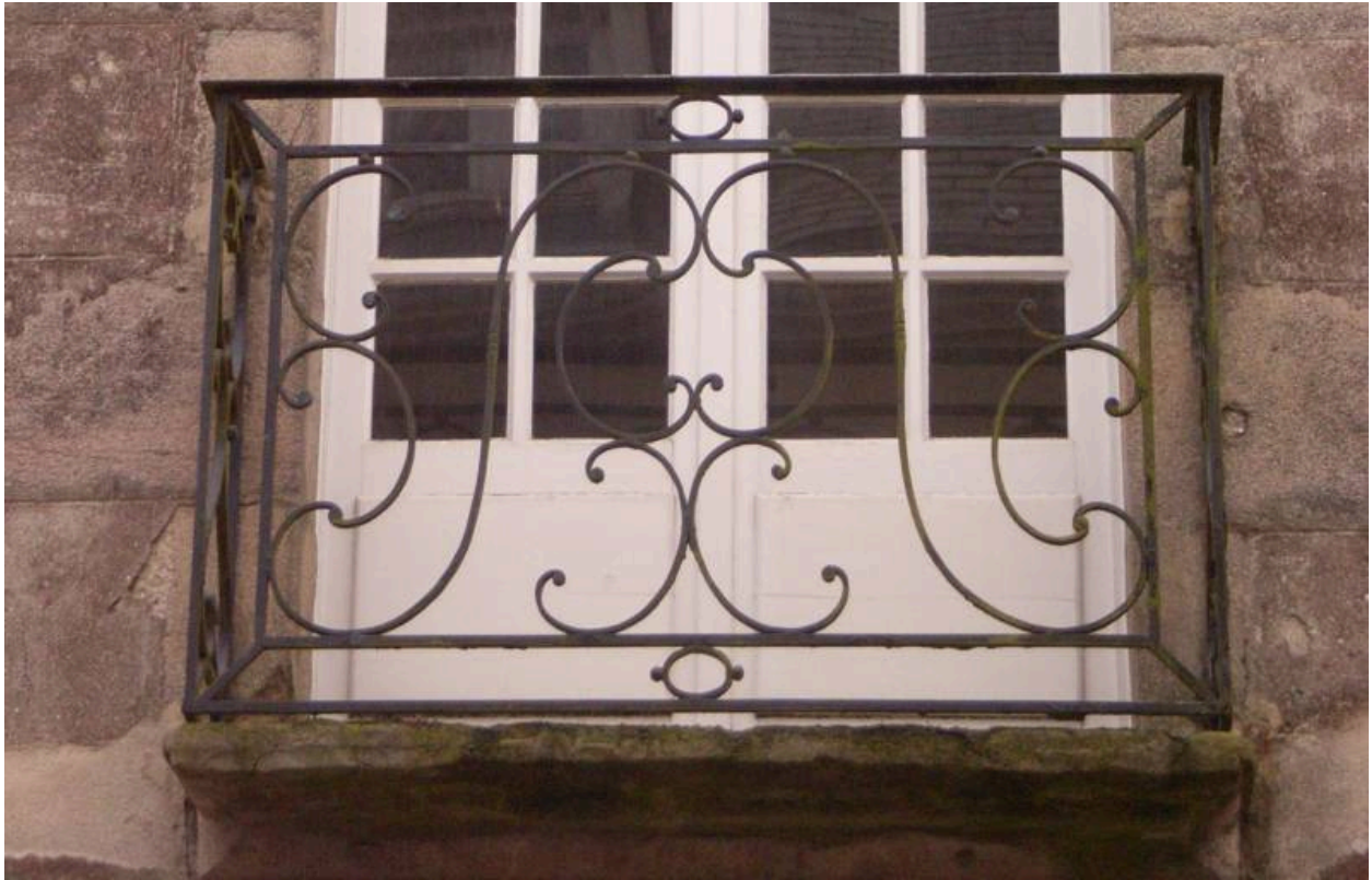
Détail d'un balconnet en fer forgé.