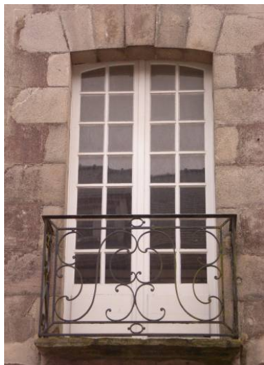
Détail d'une porte fenêtre. IVR52_20074405040NUCA