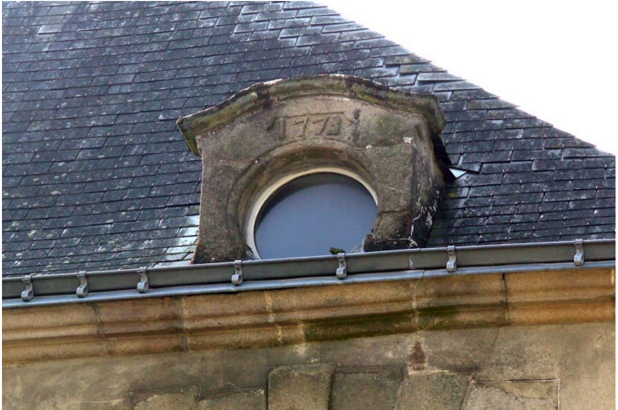
Détail de la lucarne datée.