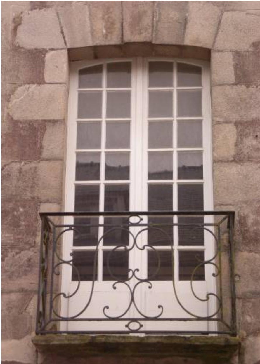
Détail d'une porte fenêtre.