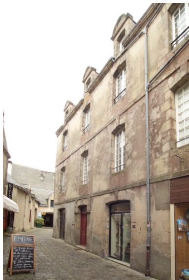
Vue du mur gouttereau bordant la rue de la Juiverie. IVR52_20074400886NUCA