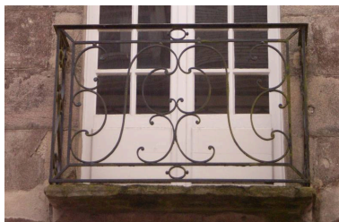
Détail d'un balconnet en fer forgé. IVR52_20074405041NUCA