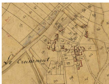
Le Croissement. Plan cadastral (détail), 1827, section E1, parcelle 286. IVR52_20244900903NUCA