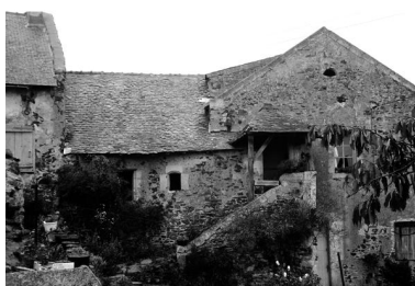
Elévation antérieure, 1972. IVR52_19724900385Z