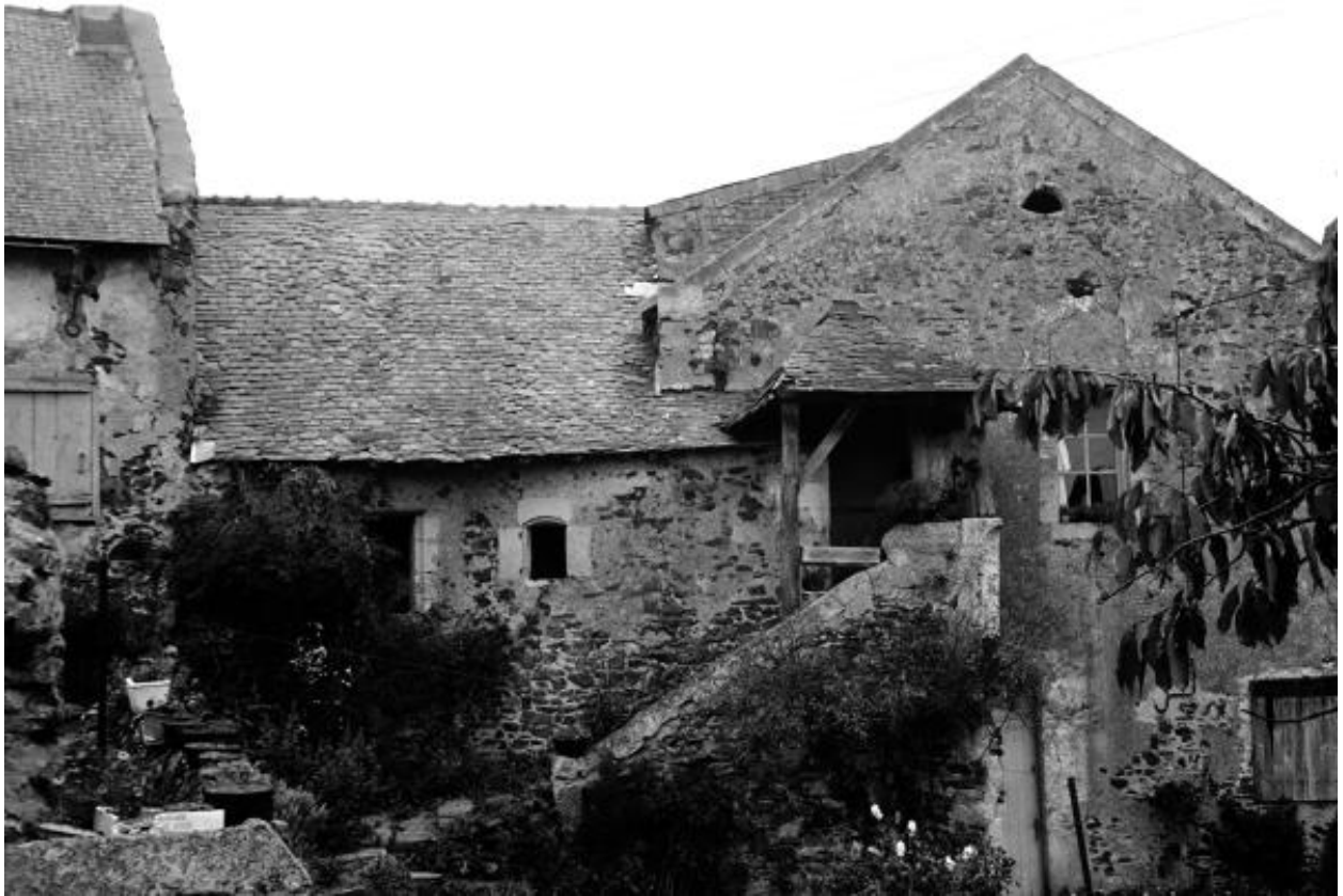
Elévation antérieure, 1972.