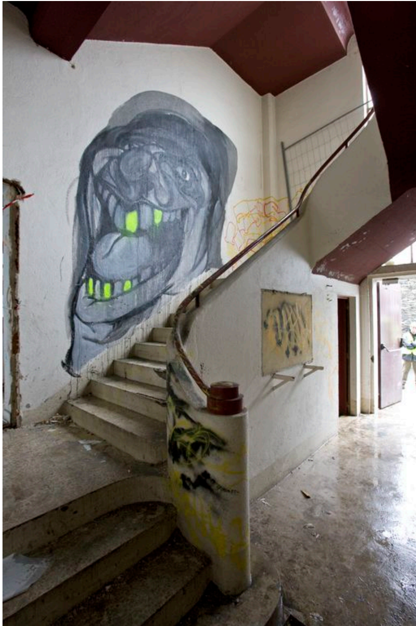
Vue générale depuis la rue d'Anjou.