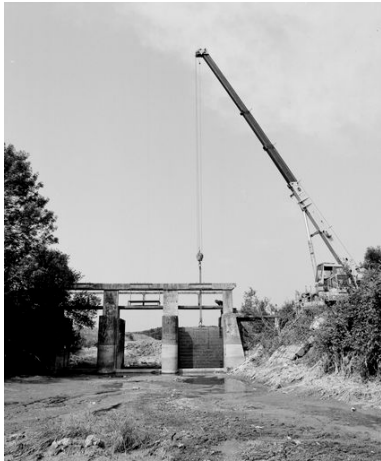
Remise en place d'une porte-vanne, en 1999.