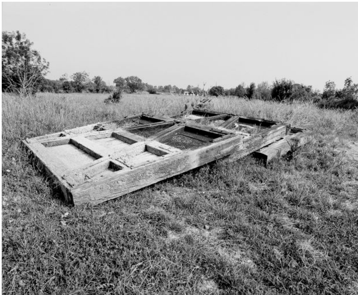
Vue des portes-vannes déposées, en 1999.