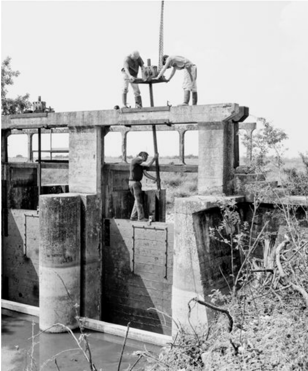
Remise en place de la crémaillère d'une porte-vanne, en 1999.