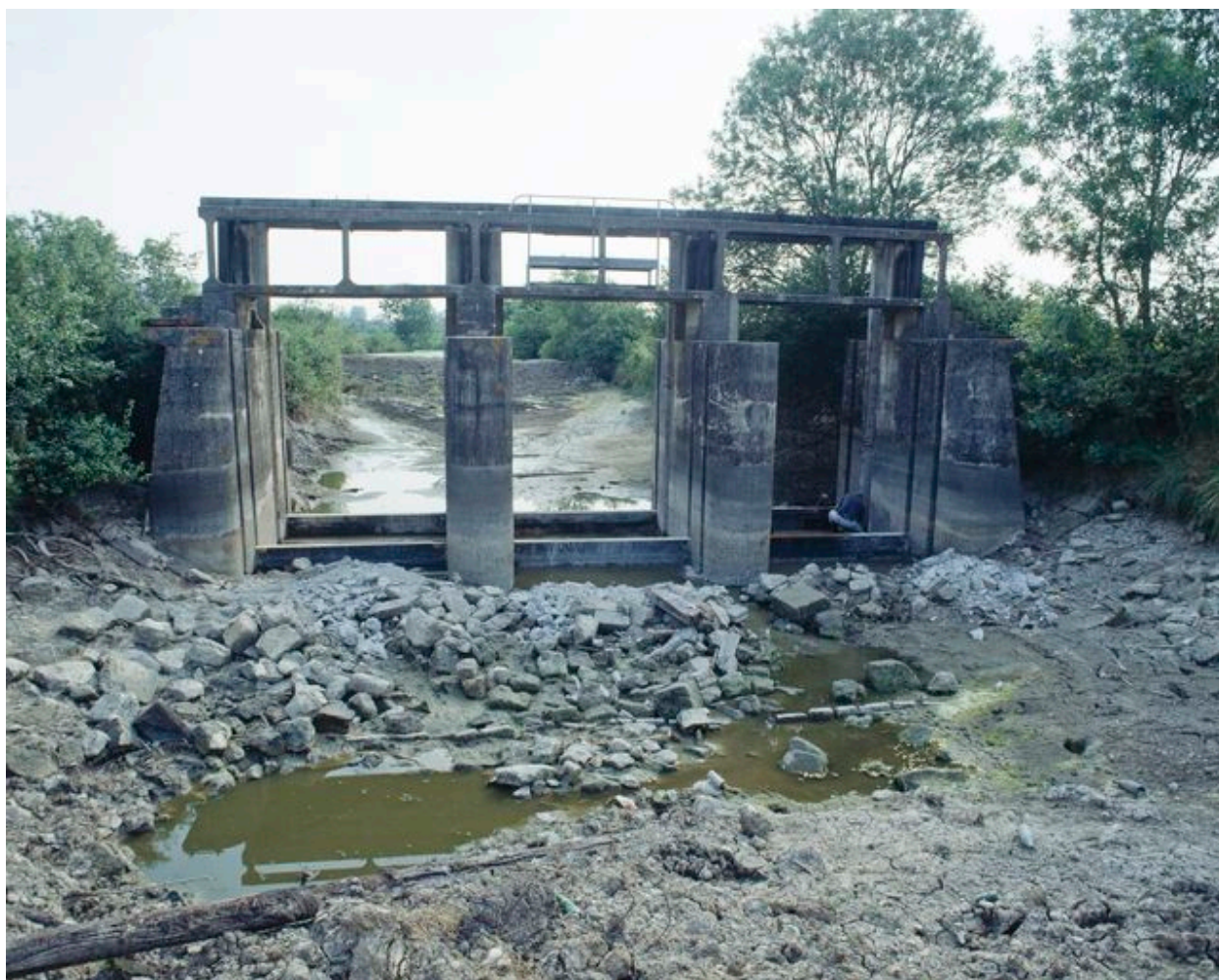
Vue, prise en 1999, de l'ouvrage moderne sans ses vannes et des fondations de l'ancien barrage à poutrelles.