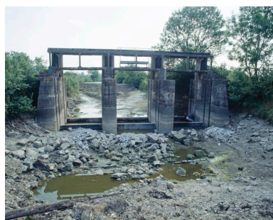
Vue, prise en 1999, de l'ouvrage moderne sans ses vannes et des fondations de l'ancien barrage à poutrelles. IVR52_19998500784XA