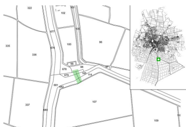
Le barrage sur le plan cadastral actuel. IVR52_20118501002NUDA