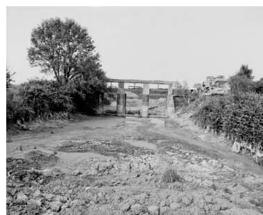
Remise en place d'une porte-vanne, en 1999. IVR52_19998500818X