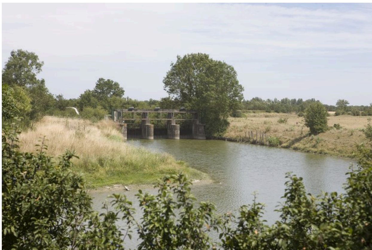
Vue du barrage prise en 2010.