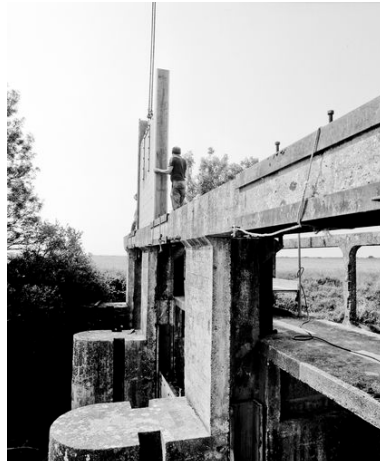
Remise en place d'une porte-vanne, en 1999. IVR52_19998500823X