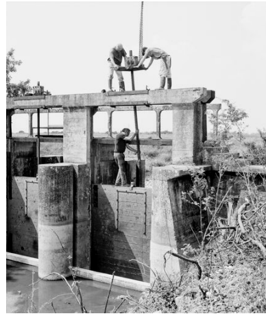
Remise en place de la crémaillère d'une porte-vanne, en 1999.