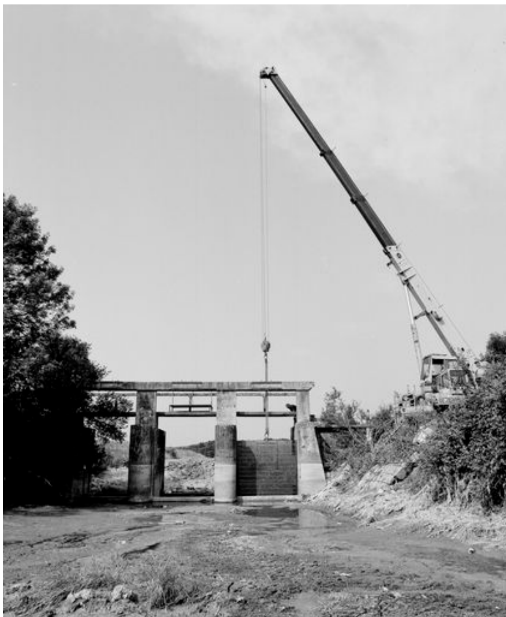
Remise en place d'une porte-vanne, en 1999.