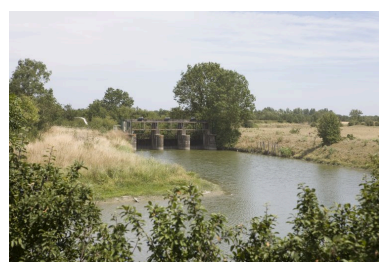
Vue du barrage prise en 2010. IVR52_20108500361NUCA