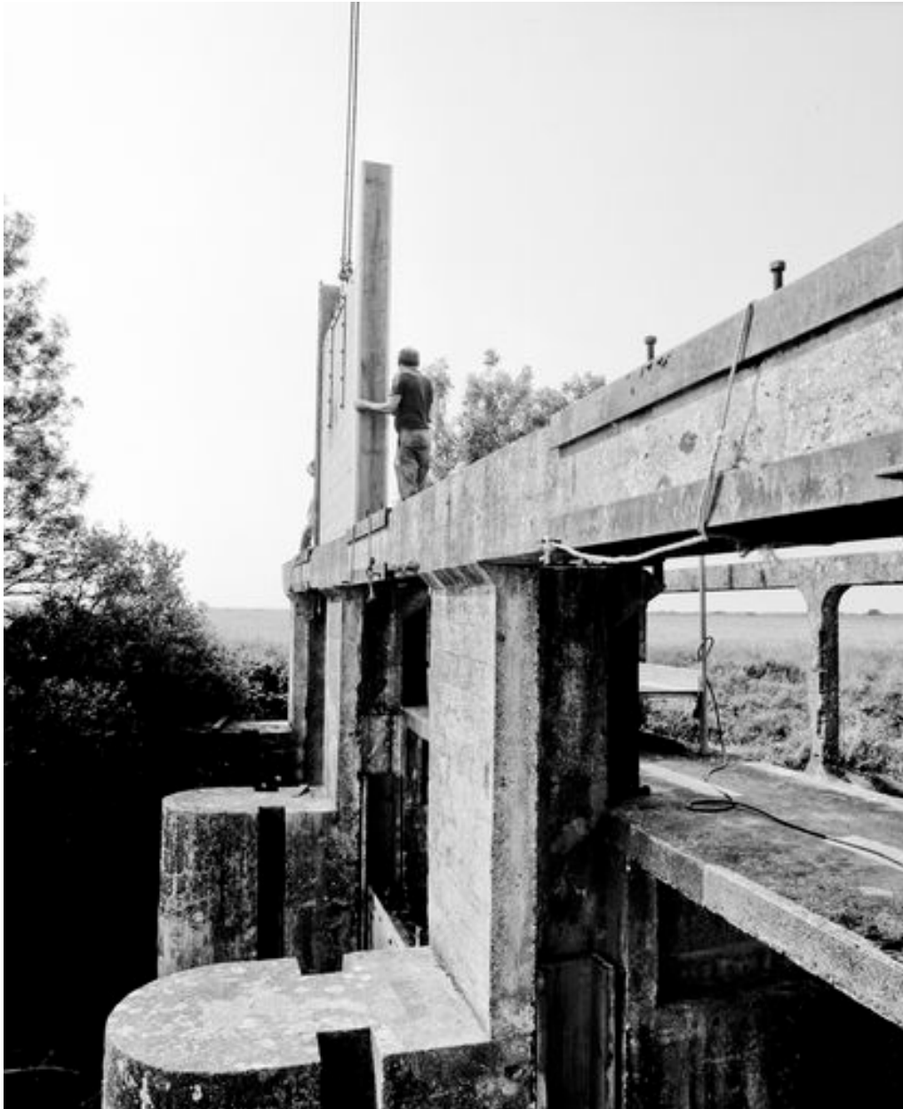
Remise en place d'une porte-vanne, en 1999.