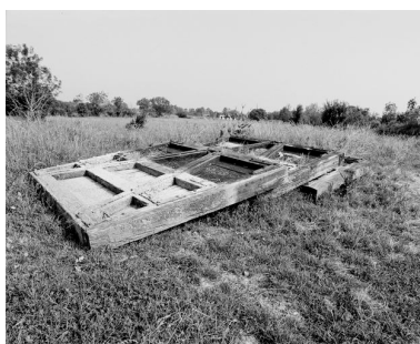
Vue des portes-vannes déposées, en 1999.