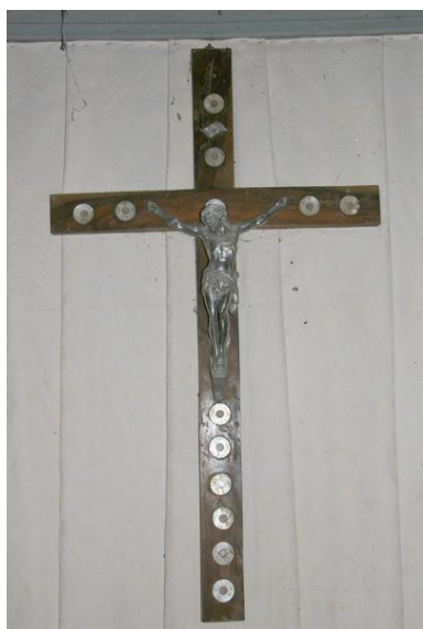
Croix de sacristie du XIXe siècle.