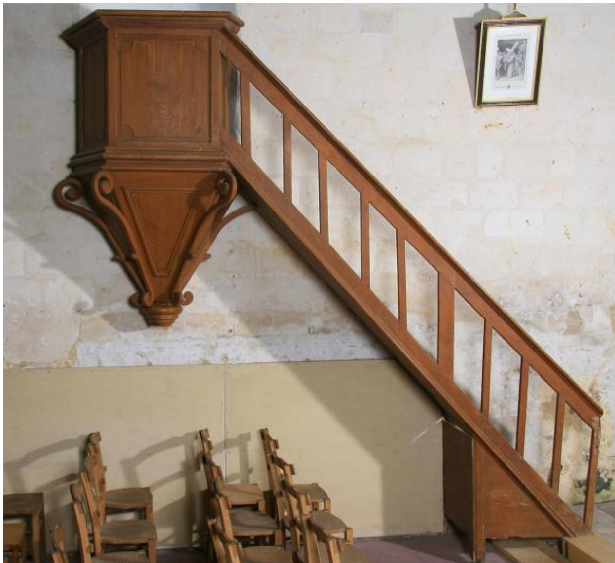
Chaire à prêcher du XIXe siècle.