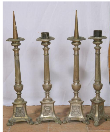
Quatre chandeliers d'autel du XIXe siècle. IVR52_20087200744NUCA