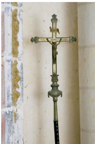
Croix de procession. IVR52_20087200742NUCA