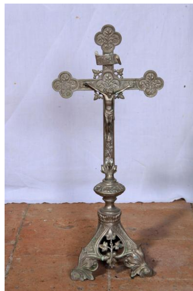
Croix d'autel du XIXe siècle.