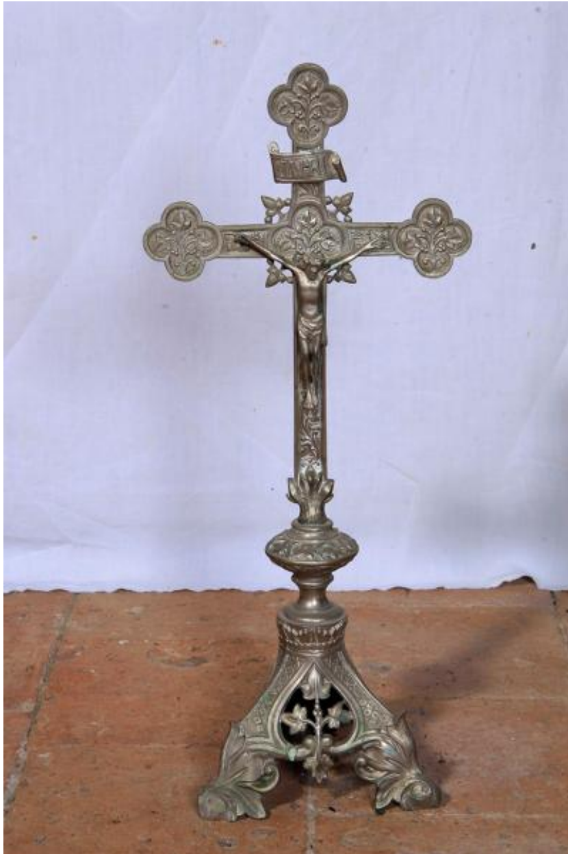
Croix d'autel du XIXe siècle.