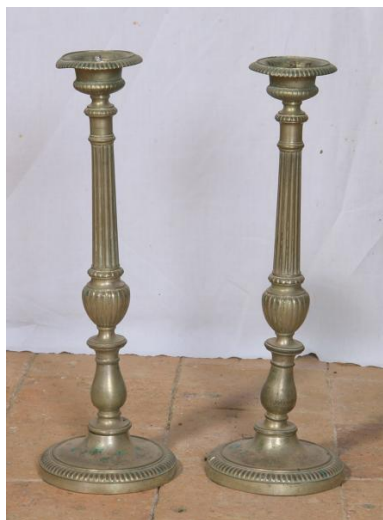
Deux chandeliers d'autel du XIXe siècle.