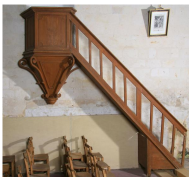
Chaire à prêcher du XIXe siècle. IVR52_20087200750NUCA