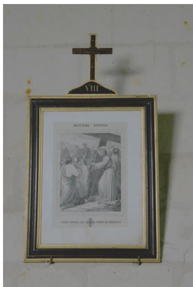
Chemin de croix de la seconde moitié du XIXe siècle. IVR52_20087200757NUCA