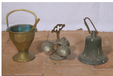
Seau à eau bénite et deux clochettes d'autel.