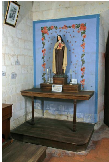
Autel de sainte Thérèse.