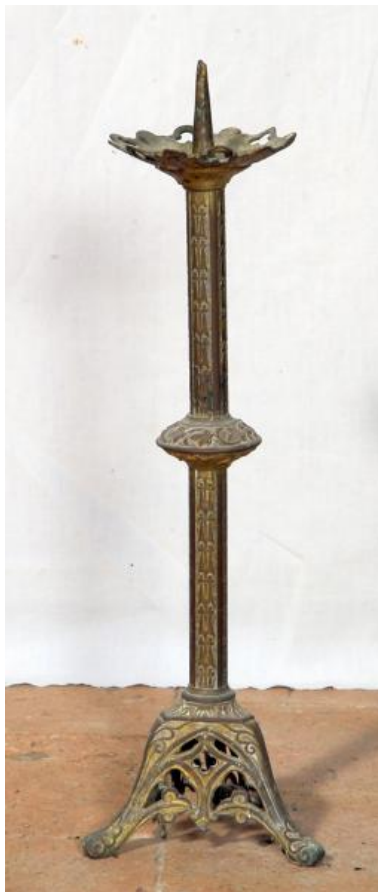
Chandelier d'autel de la fin du XIXe siècle.