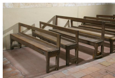
Bancs de fidèles du XVIIIe siècle (?). IVR52_20087200754NUCA