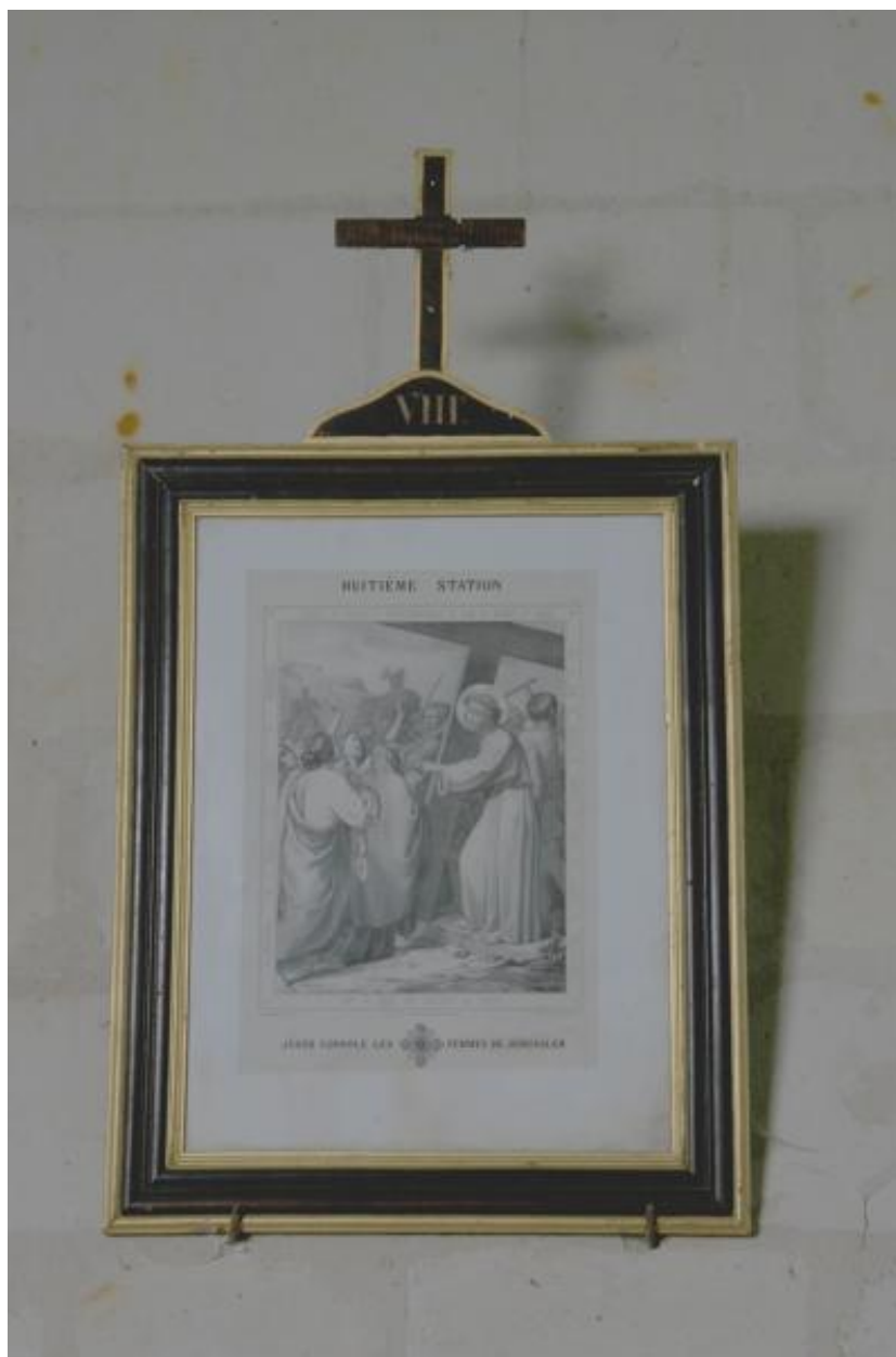
Chemin de croix de la seconde moitié du XIXe siècle.