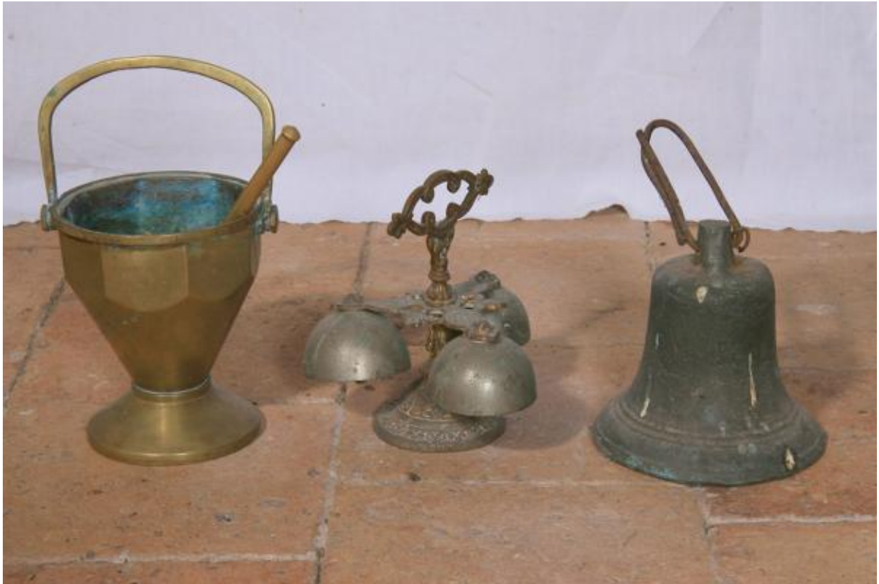
Seau à eau bénite et deux clochettes d'autel.