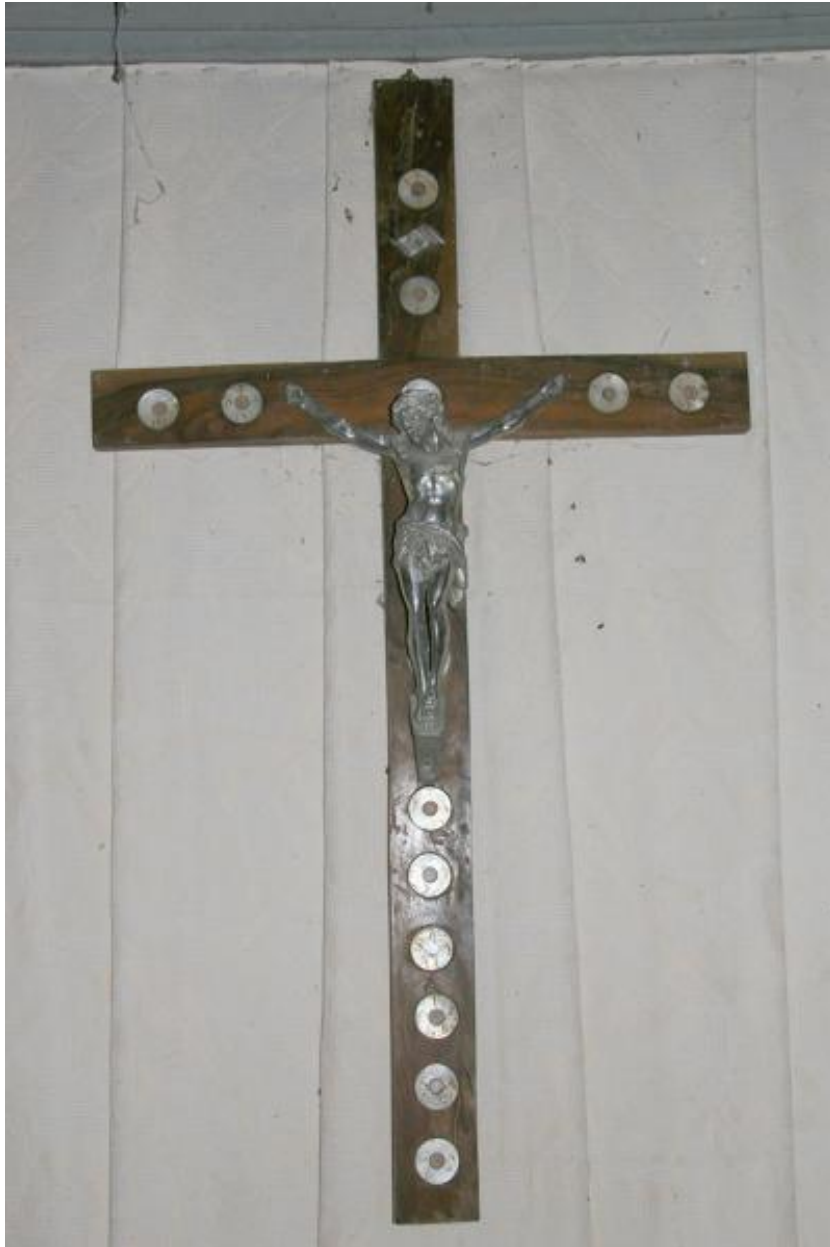
Croix de sacristie du XIXe siècle.