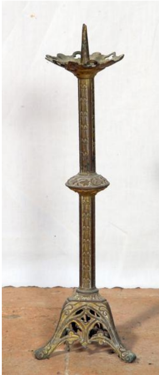
Chandelier d'autel de la fin du XIXe siècle.