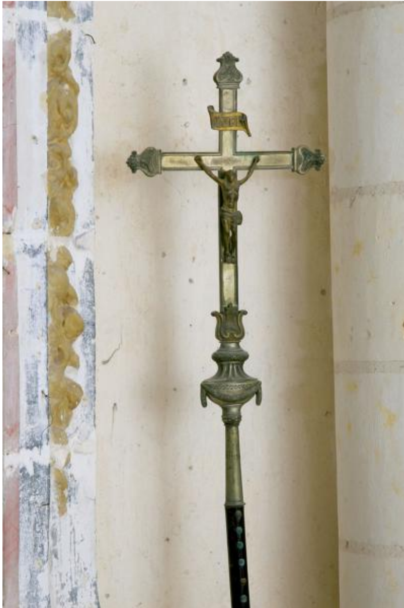
Croix de procession.