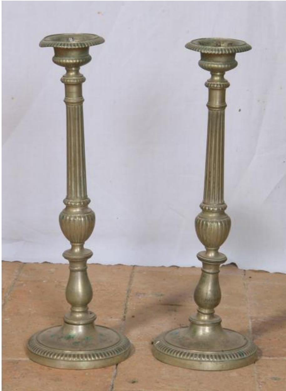
Deux chandeliers d'autel du XIXe siècle.