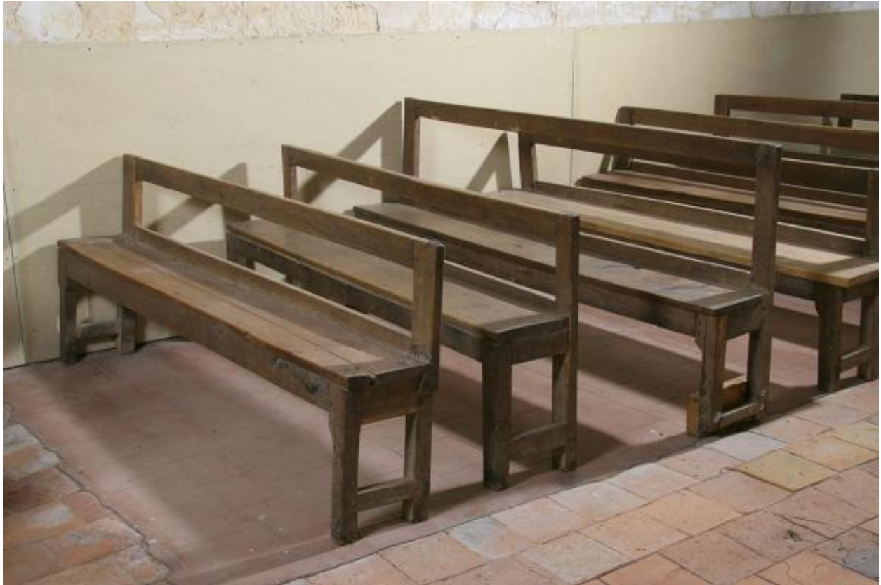
Bancs de fidèles du XVIIIe siècle (?).