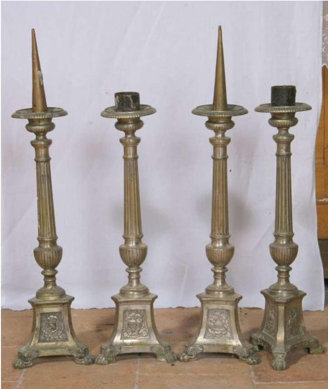
Quatre chandeliers d'autel du XIXe siècle.