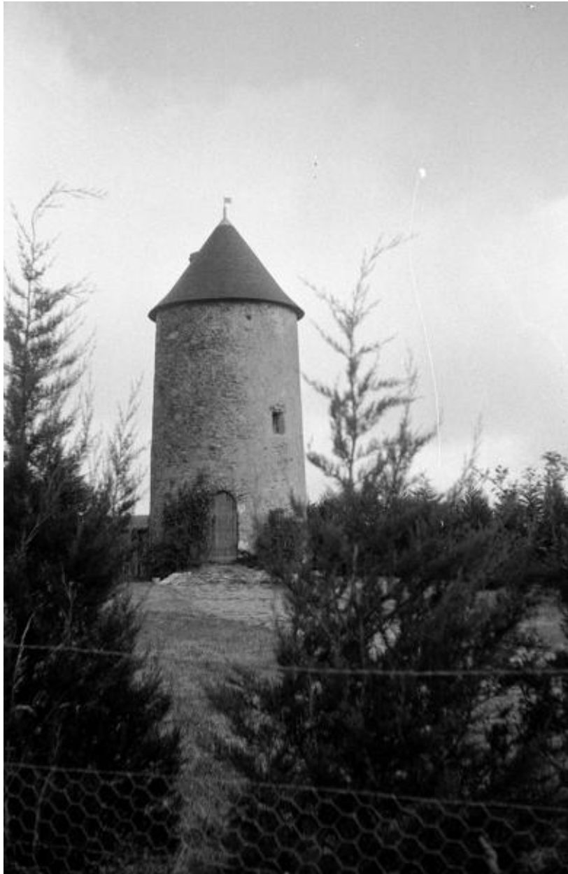
Moulin des Buttes. Vue d'ensemble.