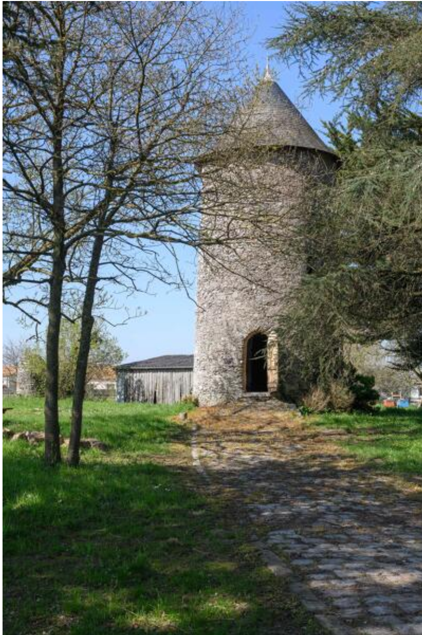
Moulin à farine dit moulin des Buttes (n° 1) ou moulin de l'Ouche-Neuve. Vue d'ensemble depuis le sud.