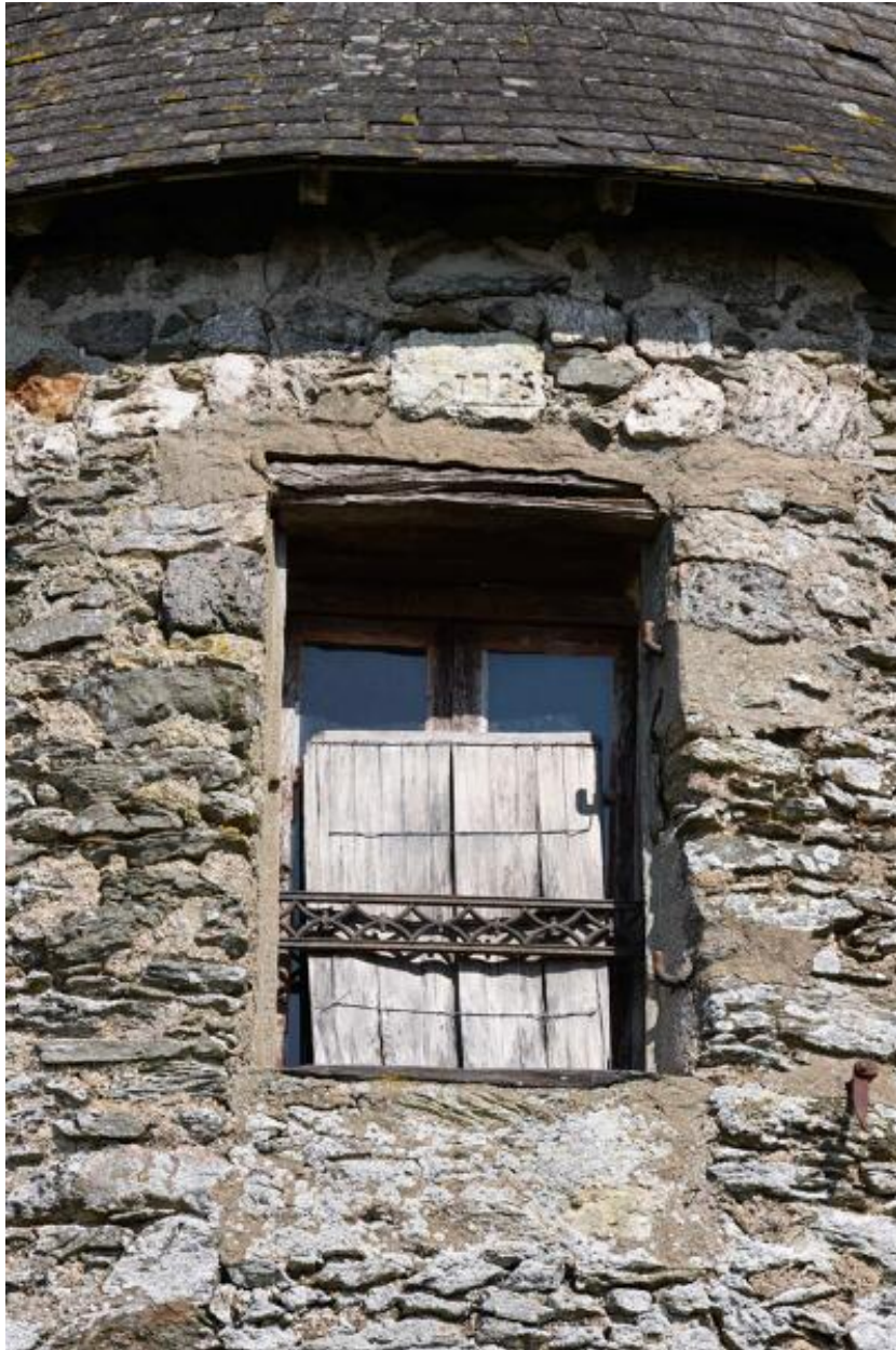
Moulin à farine dit moulin des Buttes (n° 1) ou moulin de l'Ouche-Neuve. Détail de la fenêtre ouest et de la date portée 1735.