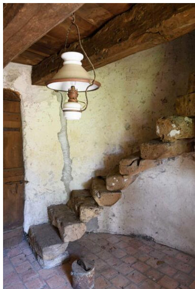
Moulin à farine dit moulin des Buttes (n° 1) ou moulin de l'Ouche-Neuve. Détail de l'escalier. IVR52_20254900392NUCA