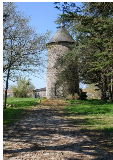
Moulin à farine dit moulin des Buttes (n° 1) ou moulin de l'Ouche-Neuve. Vue d'ensemble depuis le sud. IVR52_20254900384NUCA