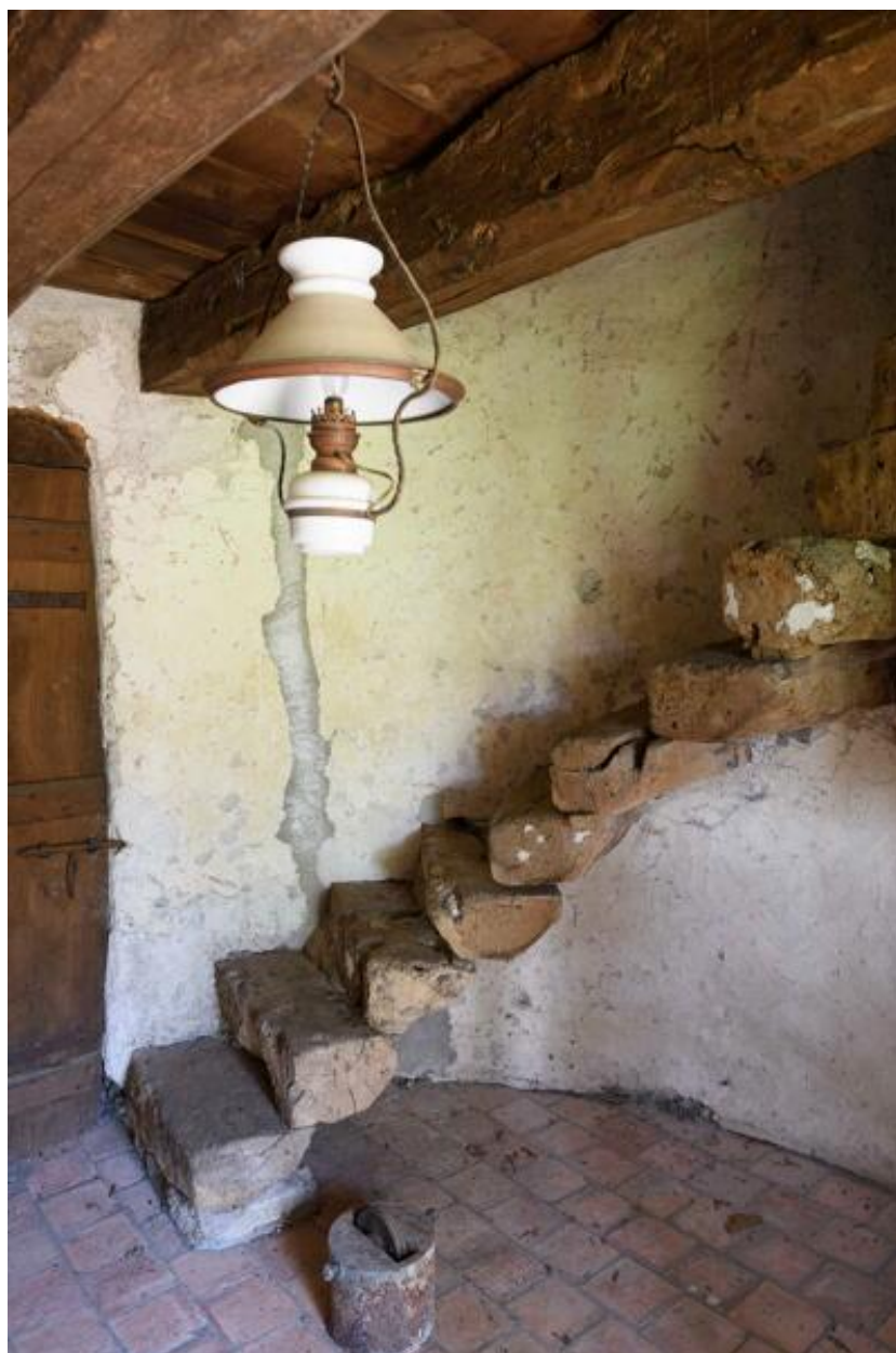
Moulin à farine dit moulin des Buttes (n° 1) ou moulin de l'Ouche-Neuve. Détail de l'escalier.