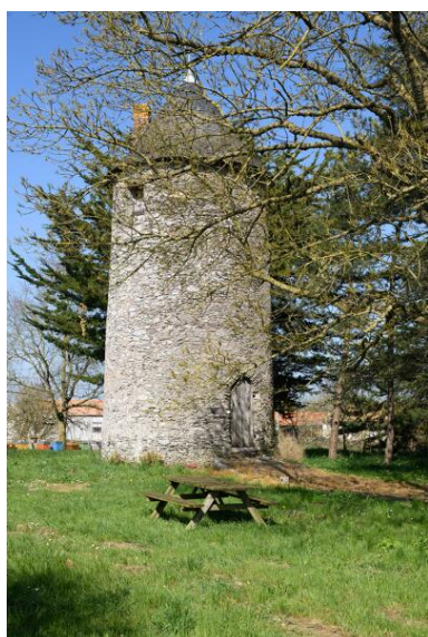
Moulin à farine dit moulin des Buttes (n° 1) ou moulin de l'Ouche-Neuve. Vue d'ensemble depuis le sud-ouest.