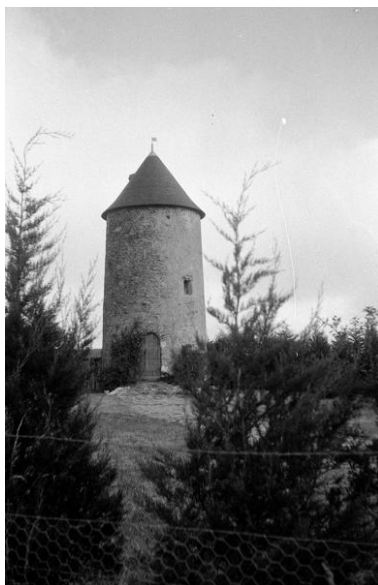
Moulin des Buttes. Vue d'ensemble. IVR52_19724900580Z