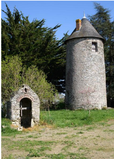
Moulin à farine dit moulin des Buttes (n° 1) ou moulin de l'Ouche-Neuve.