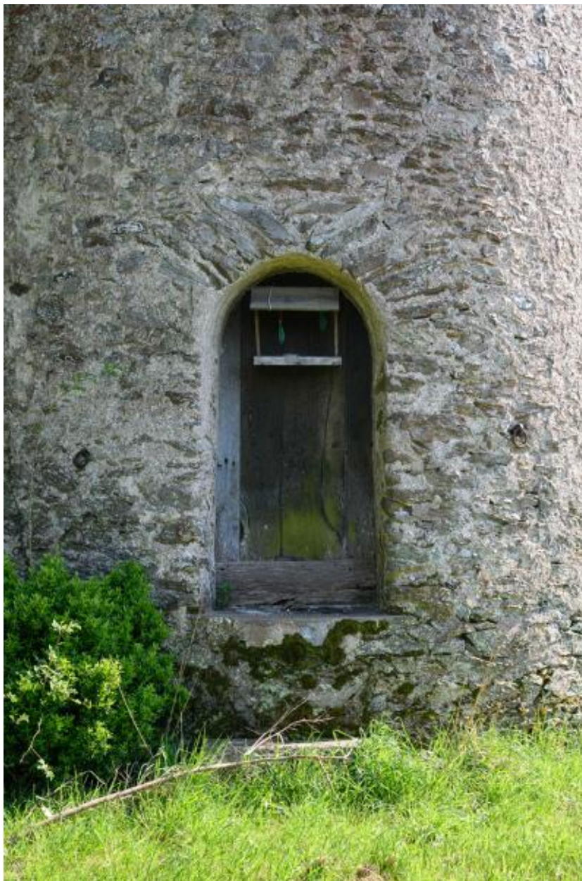
Moulin à farine dit moulin des Buttes (n° 1) ou moulin de l'Ouche-Neuve. Détail de la porte nord.