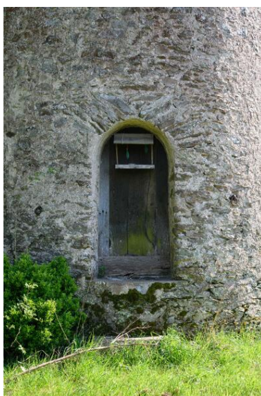
Moulin à farine dit moulin des Buttes (n° 1) ou moulin de l'Ouche-Neuve. Détail de la porte nord. IVR52_20254900391NUCA