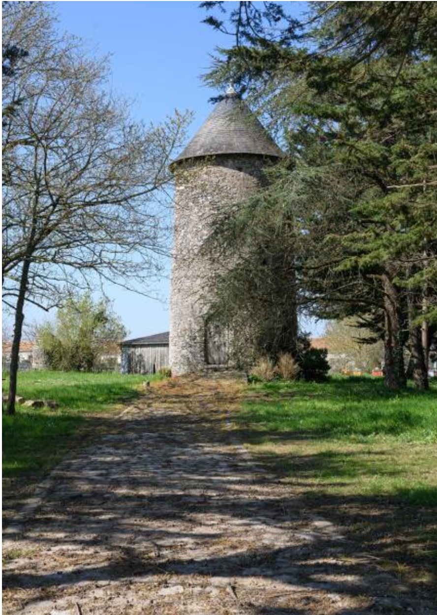
Moulin à farine dit moulin des Buttes (n° 1) ou moulin de l'Ouche-Neuve. Vue d'ensemble depuis le sud.