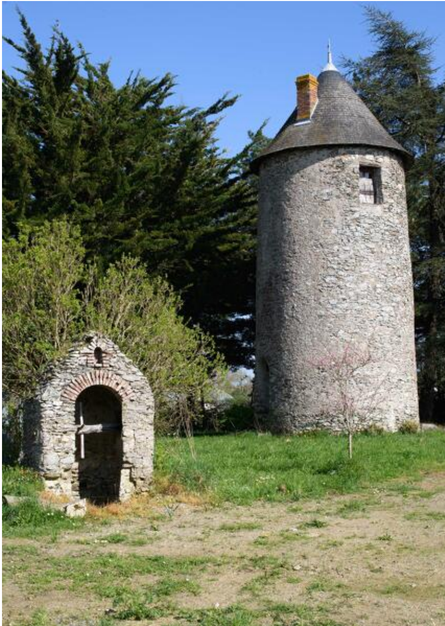
Moulin à farine dit moulin des Buttes (n° 1) ou moulin de l'Ouche-Neuve. Vue d'ensemble depuis l'ouest.