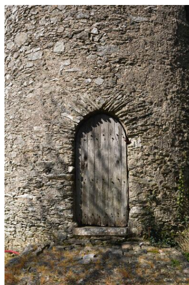
Moulin à farine dit moulin des Buttes (n° 1) ou moulin de l'Ouche-Neuve. Détail de la porte sud.