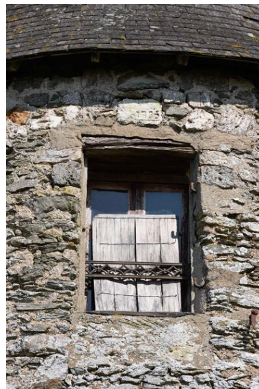
Moulin à farine dit moulin des Buttes (n° 1) ou moulin de l'Ouche-Neuve. Détail de la fenêtre ouest et de la date portée 1735. IVR52_20254900390NUCA