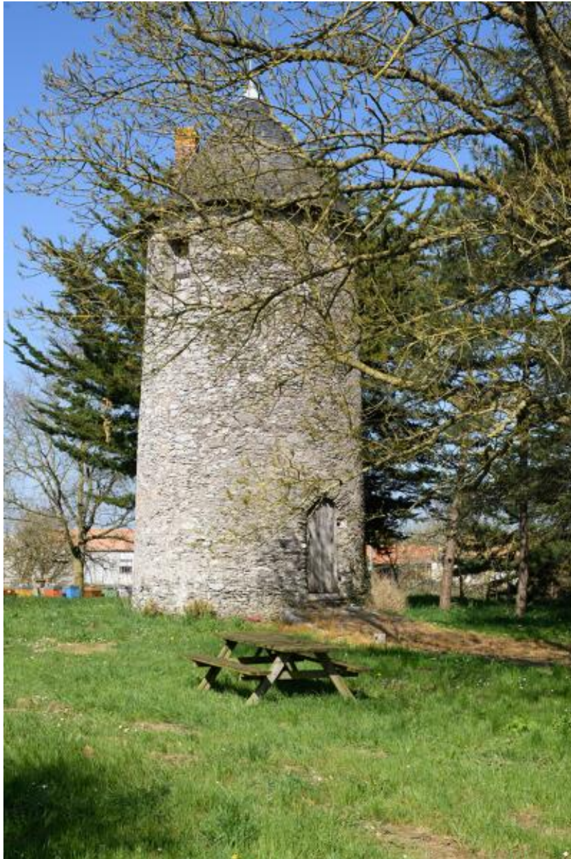
Moulin à farine dit moulin des Buttes (n° 1) ou moulin de l'Ouche-Neuve. Vue d'ensemble depuis le sud-ouest.