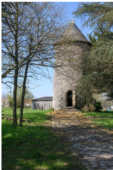
Moulin à farine dit moulin des Buttes (n° 1) ou moulin de l'Ouche-Neuve. Vue d'ensemble depuis le sud. IVR52_20254900385NUCA