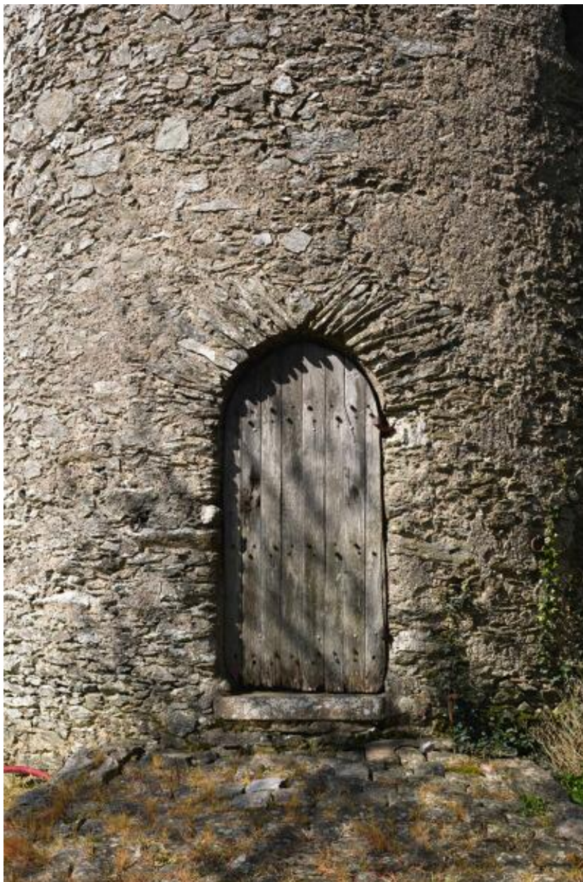
Moulin à farine dit moulin des Buttes (n° 1) ou moulin de l'Ouche-Neuve. Détail de la porte sud.