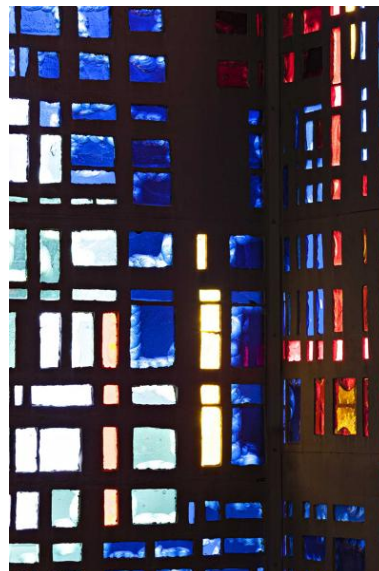
Vue de l'angle du mur vitré. IVR52_20217201446NUCA