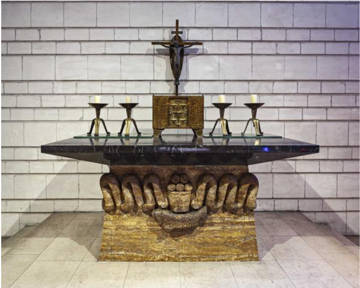
Vue de l'autel de face.