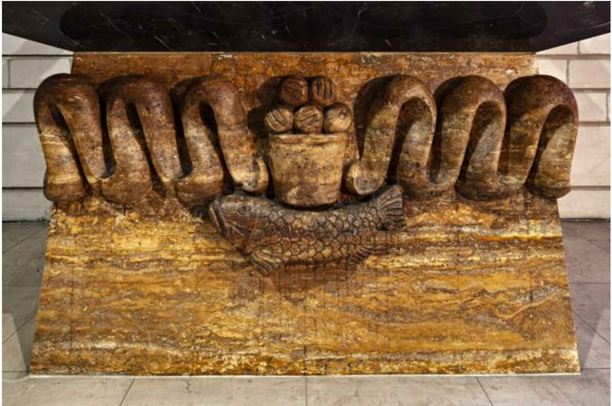
Vue du décor sculpté du pied de l'autel.