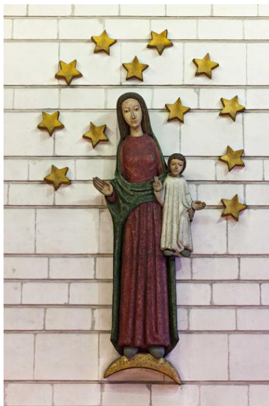
Vue de la vierge au-dessus de l'autel. IVR52_20217201445NUCA