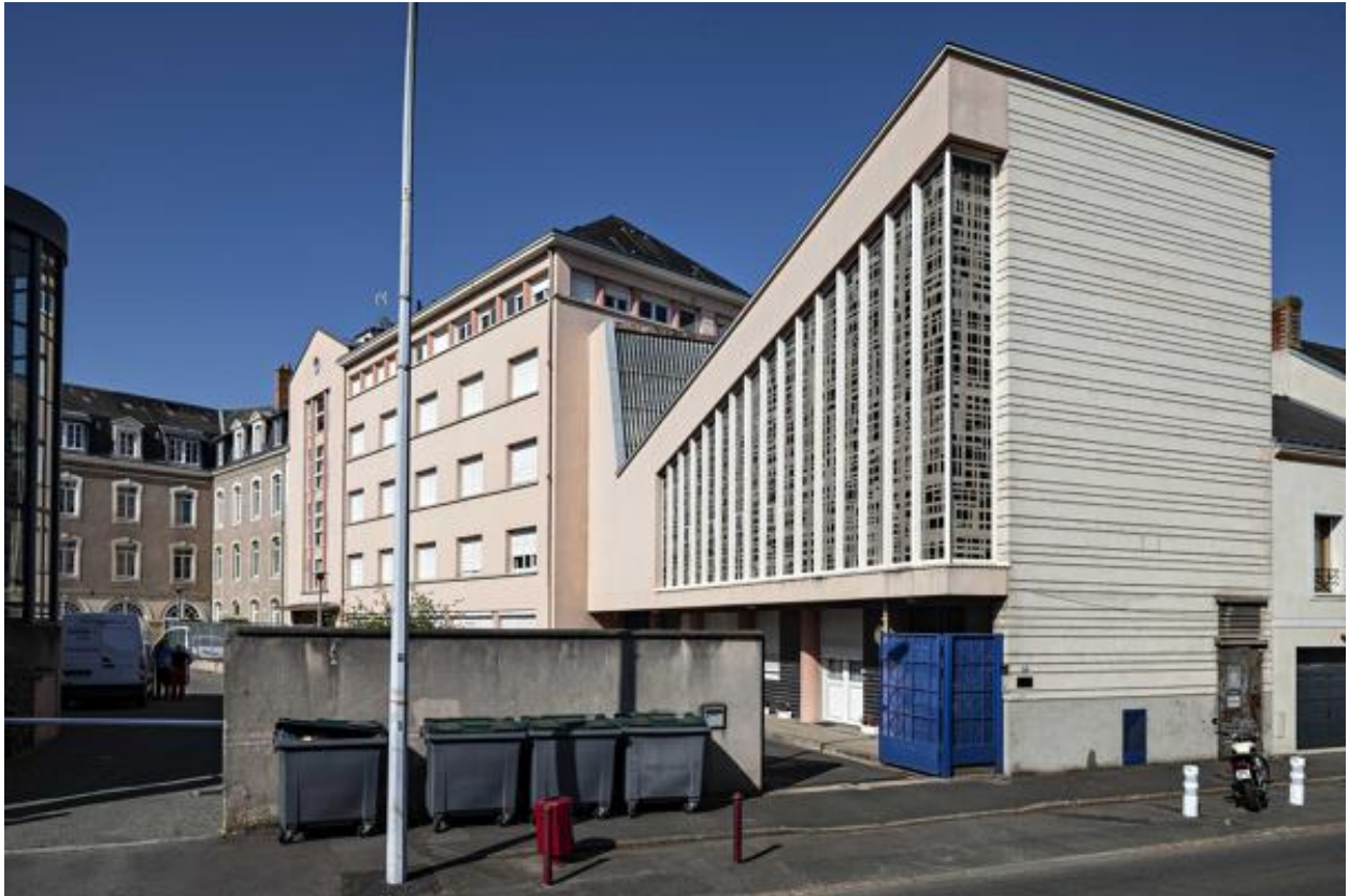
Vue de la chapelle depuis la rue.