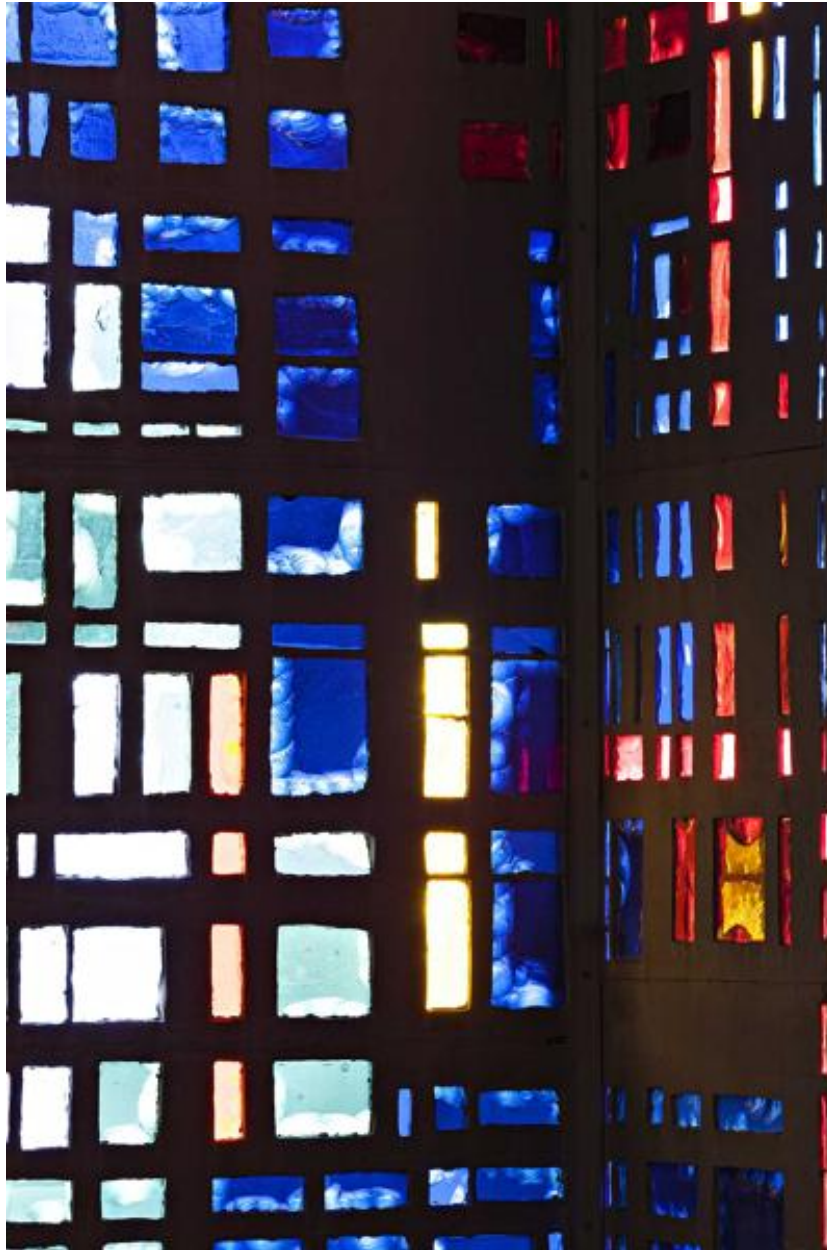
Vue de l'angle du mur vitré.