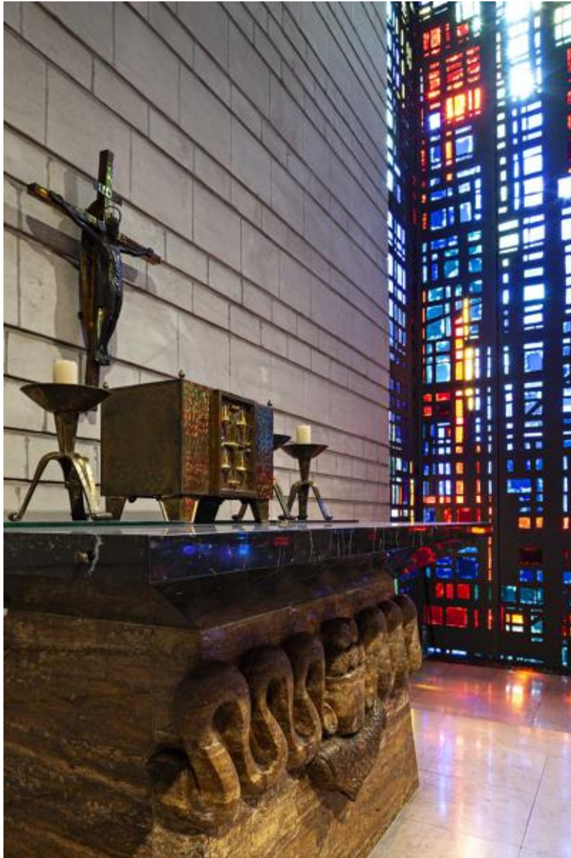
Vue de l'autel et du mur vitré en arrière plan.