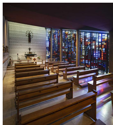
Vue de l'intérieur de la chapelle depuis l'entrée.