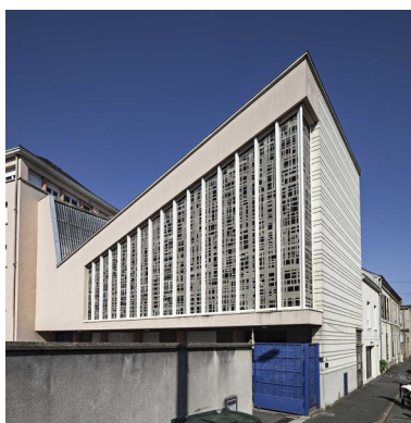
Vue du mur rideau depuis l'extérieur.