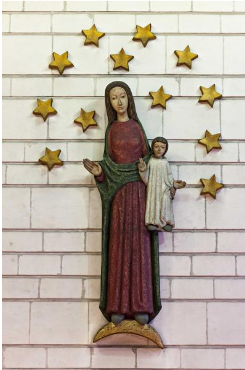
Vue de la vierge au-dessus de l'autel.