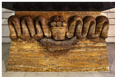
Vue du décor sculpté du pied de l'autel.