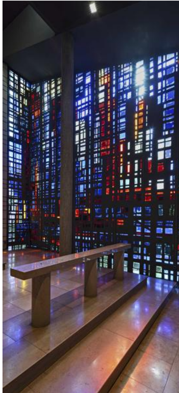
Vue du mur vitré à droite de l'autel.