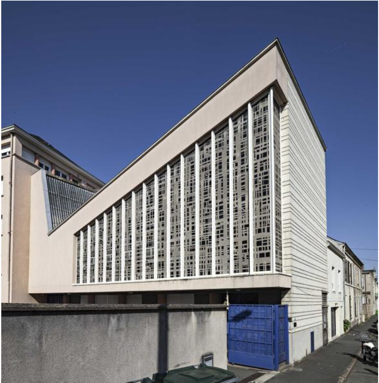
Vue du mur rideau depuis l'extérieur.