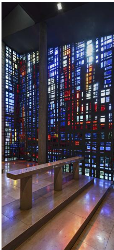
Vue du mur vitré à droite de l'autel. IVR52_20217201439NUCA