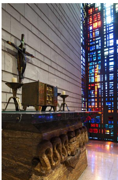
Vue de l'autel et du mur vitré en arrière plan.