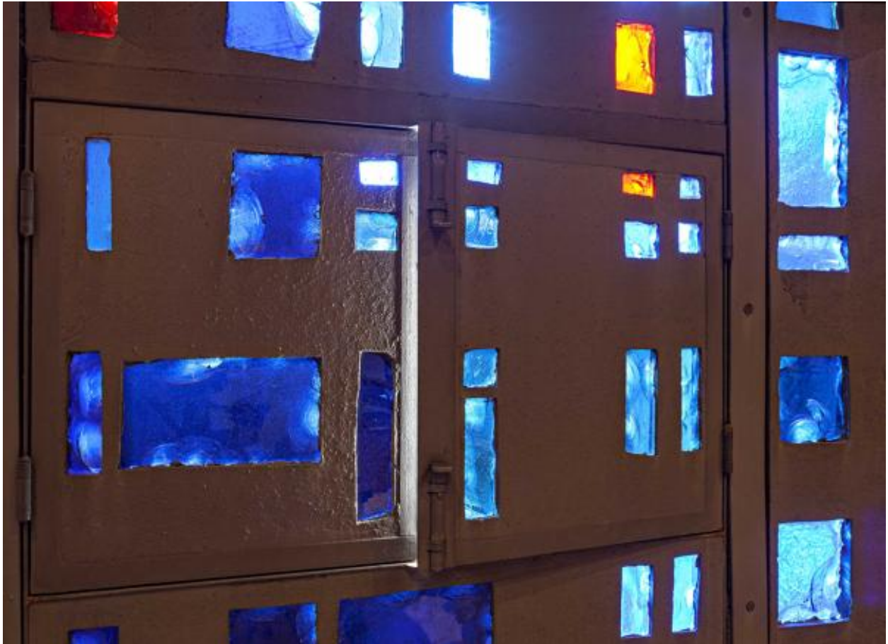
Détail d'une ouverture dans le mur vitré.