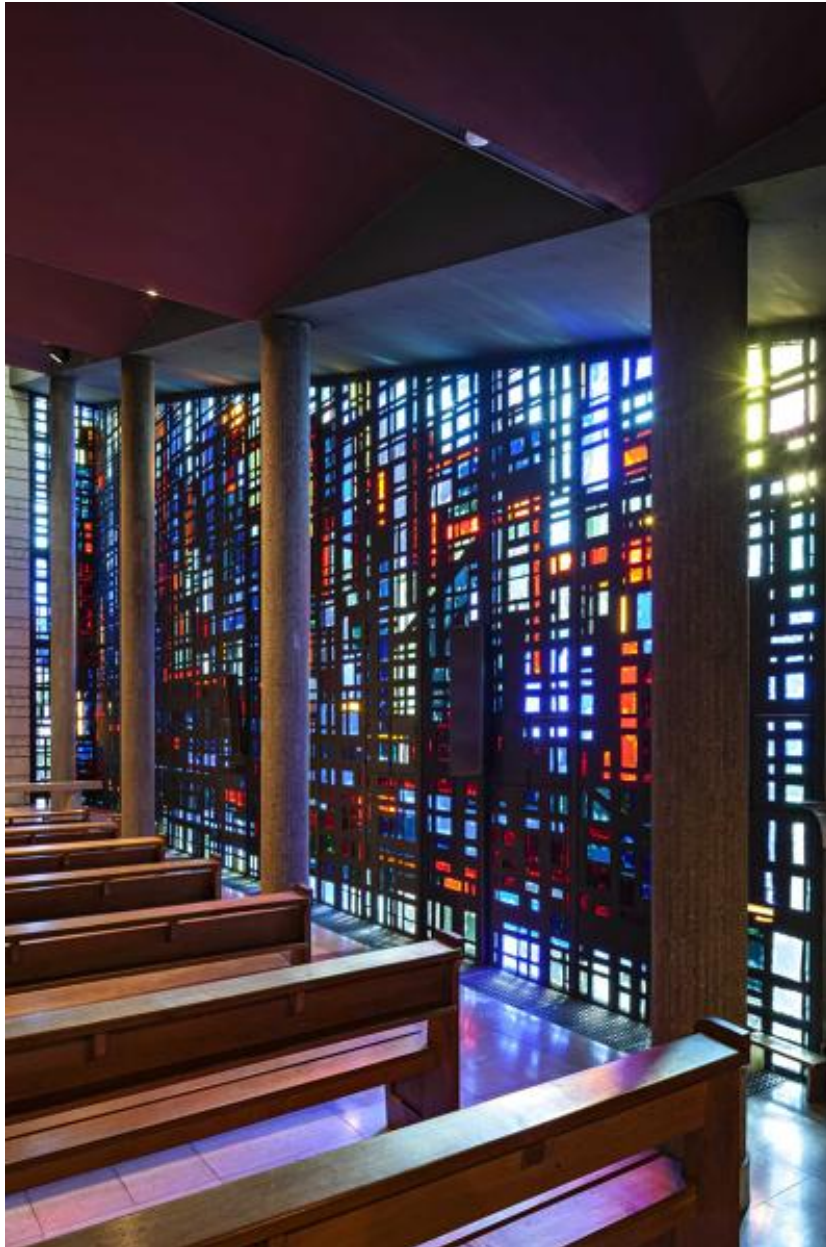
Vue du mur vitré depuis l'intérieur.