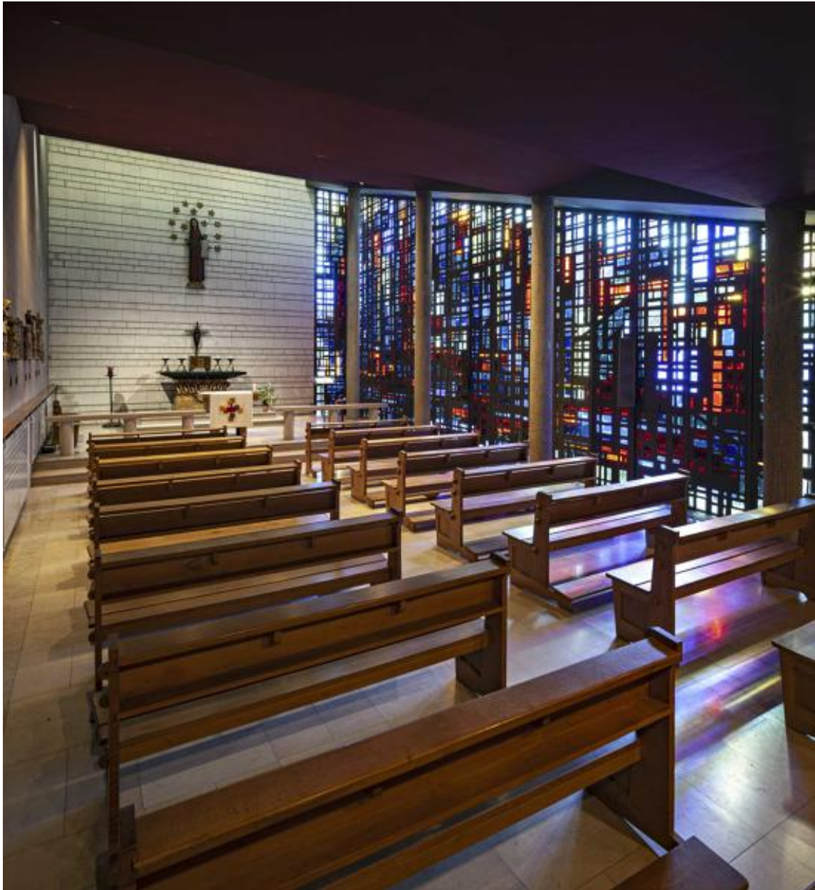
Vue de l'intérieur de la chapelle depuis l'entrée.