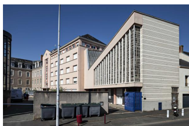
Vue de la chapelle depuis la rue.