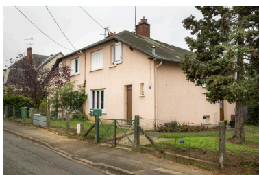
Vue de la façade d'un pavillon double dit Reconstruction rue du Docteur-Roux. IVR52_20197202572NUCA