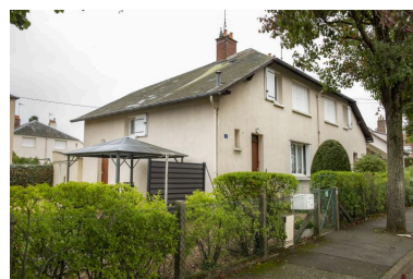
Vue de la façade sur rue d'un pavillon double rue du Cotentin. IVR52_20197202568NUCA