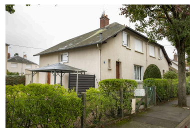
Vue de la façade sur rue d'un pavillon double rue du Cotentin. IVR52_20197202568NUCA