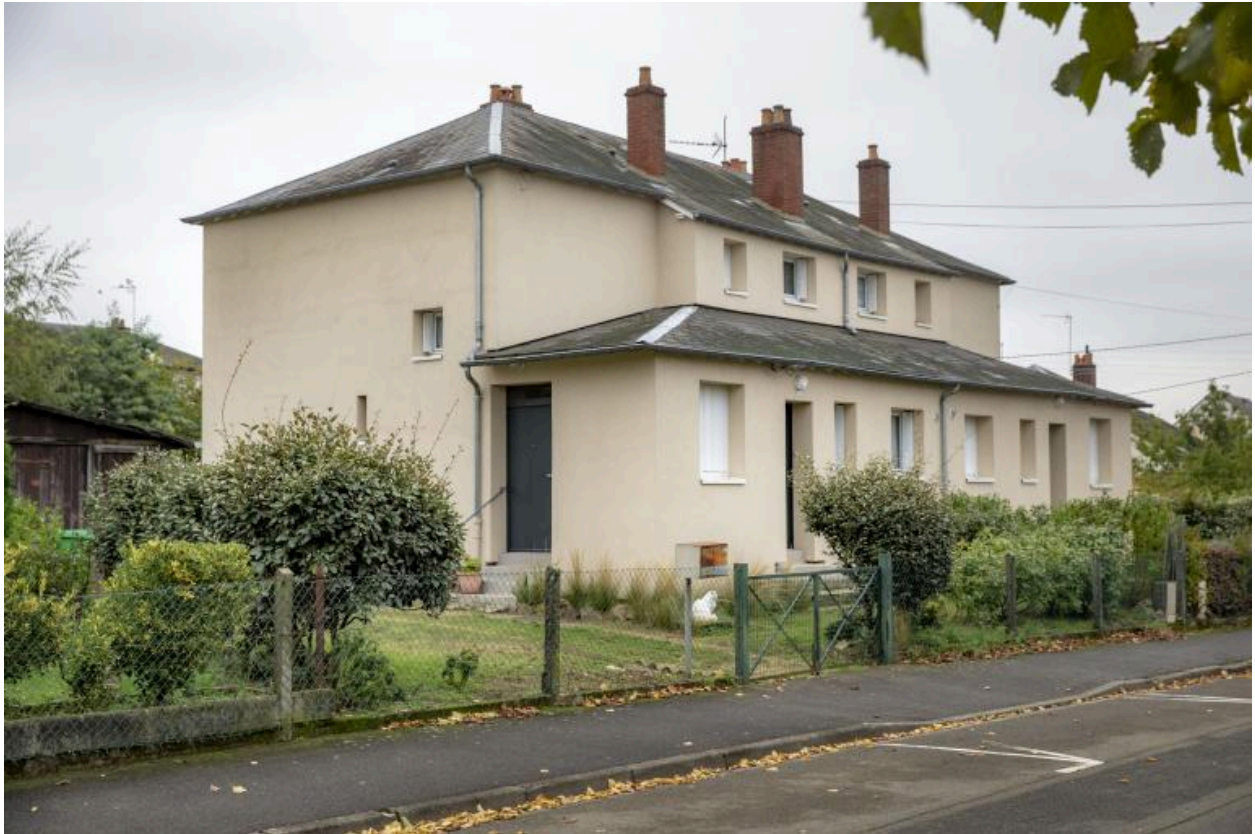
Vue de la façade sur rue d'un pavillon double dit Reconstruction rue du Val-de-Loire.