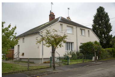
Vue d'un pavillon dit Reconstruction depuis la rue.