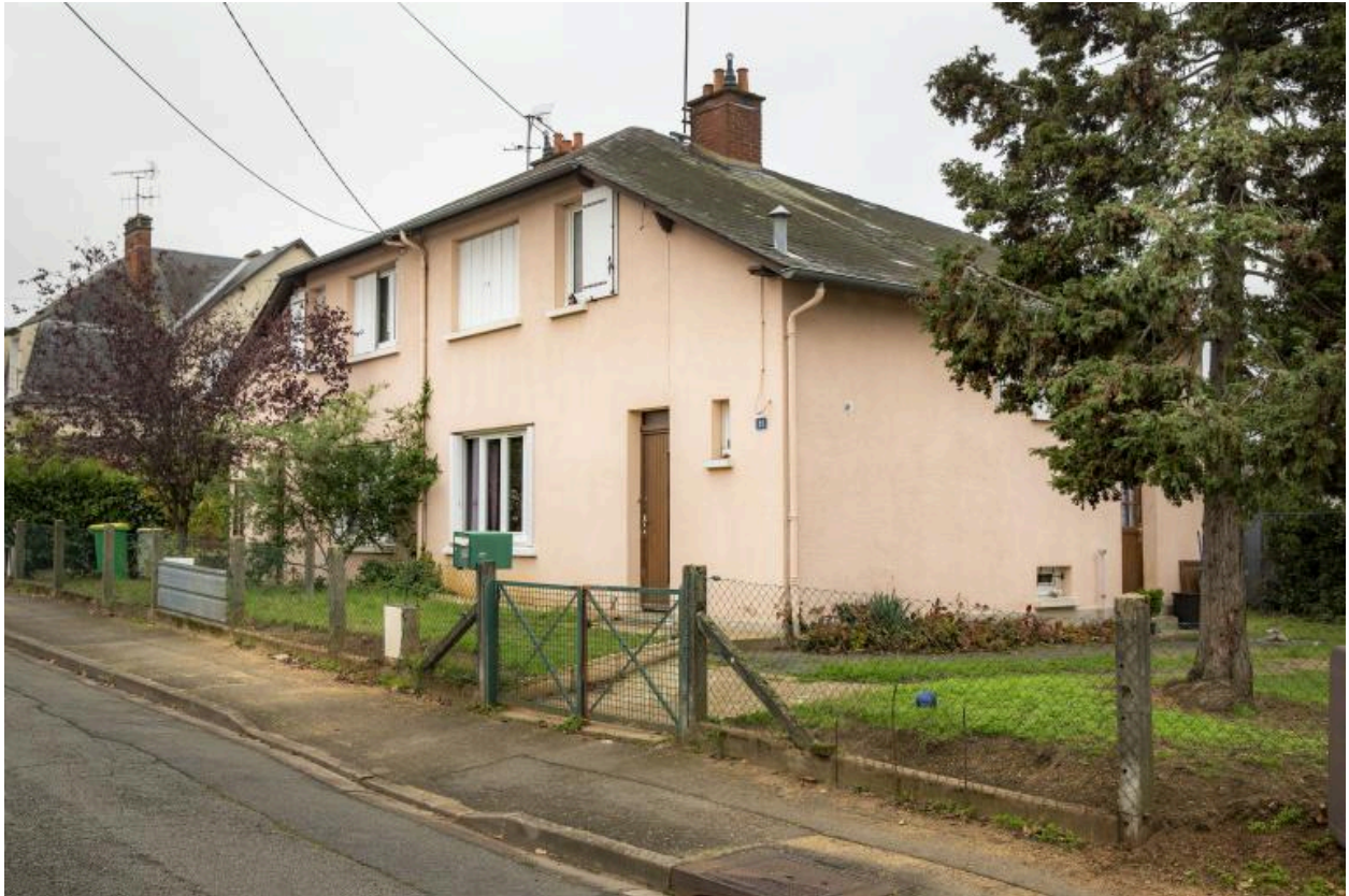
Vue de la façade d'un pavillon double dit Reconstruction rue du Docteur-Roux.