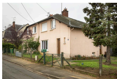
Vue de la façade d'un pavillon double dit Reconstruction rue du Docteur-Roux. IVR52_20197202572NUCA