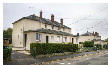
Vue de l'alignement des pavillons doubles dits Reconstruction rue du Val de Loir. IVR52_20197202571NUCA