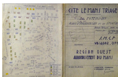
Plan de répartition des types de pavillons dits Reconstruction.