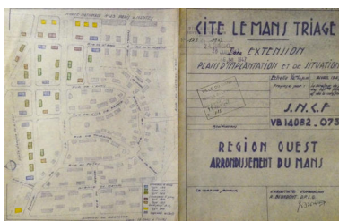
Plan de répartition des types de pavillons dits Reconstruction. IVR52_20207200092NUCA