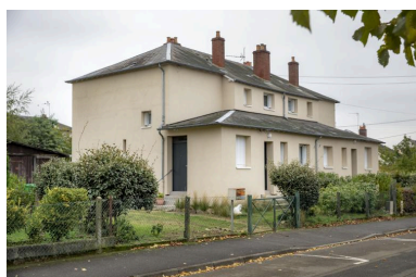
Vue de la façade sur rue d'un pavillon double dit Reconstruction rue du Val-de-Loire.