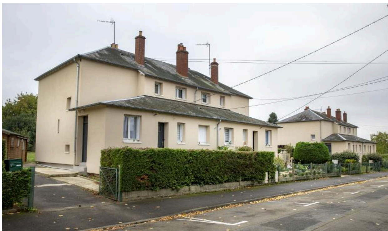
Vue de l'alignement des pavillons doubles dits Reconstruction rue du Val de Loir.