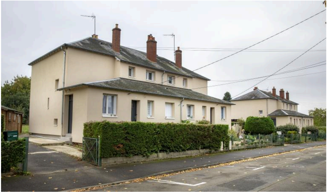
Vue de l'alignement des pavillons doubles dits Reconstruction rue du Val de Loir.