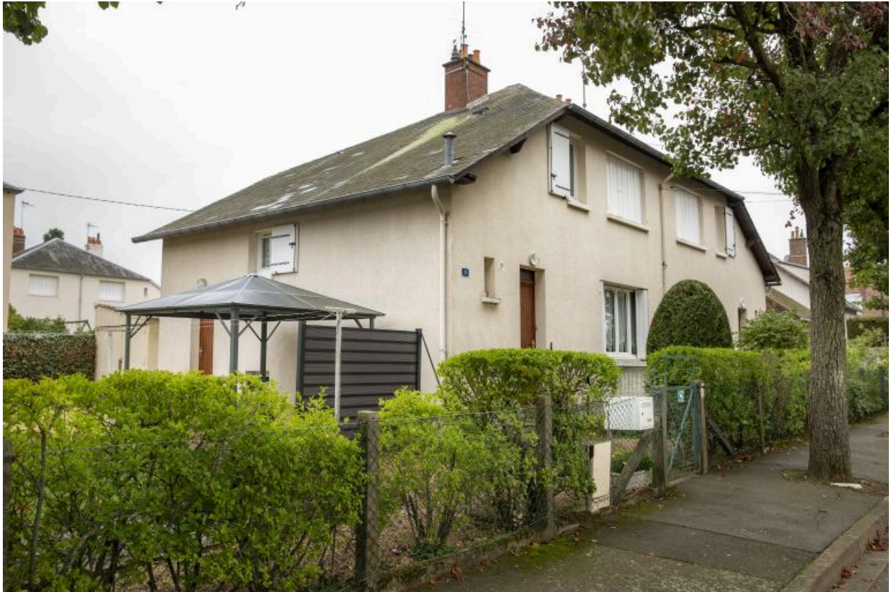
Vue de la façade sur rue d'un pavillon double rue du Cotentin.