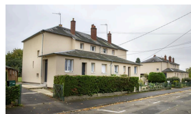
Vue de l'alignement des pavillons doubles dits Reconstruction rue du Val de Loir. IVR52_20197202571NUCA