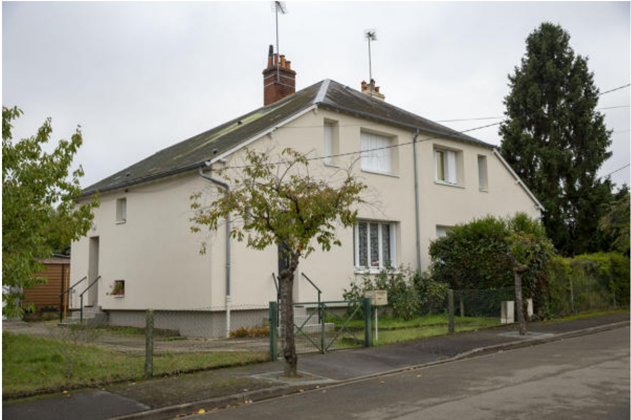
Vue d'un pavillon dit Reconstruction depuis la rue.