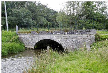
Vue d'amont depuis la rive droite.

Autr. Alliaume, Repro. François Lasa IVR52_20025301176X