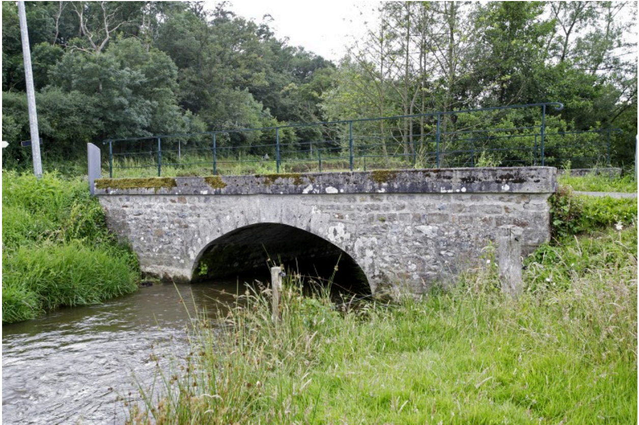
Vue d'amont depuis la rive droite.