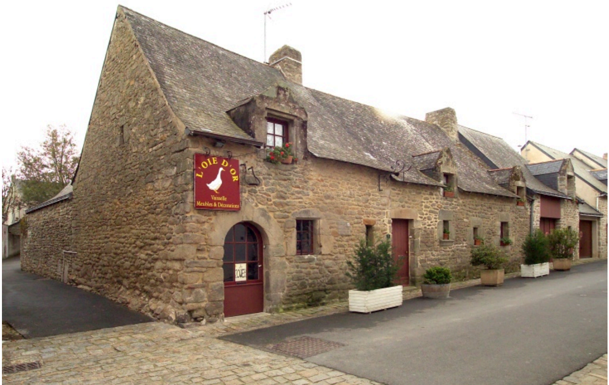
Vue générale vers le Sud.