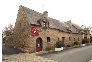
Vue générale vers le Sud.