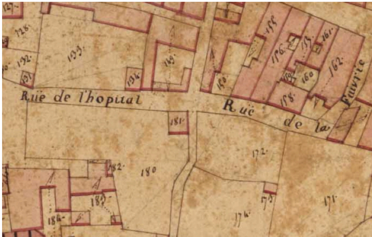
Extrait du plan cadastral de 1819, section Z, parcelle 181.