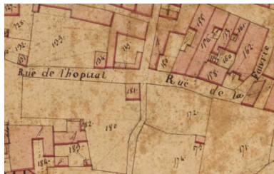
Extrait du plan cadastral de 1819, section Z, parcelle 181. IVR52_20074405176NUCA