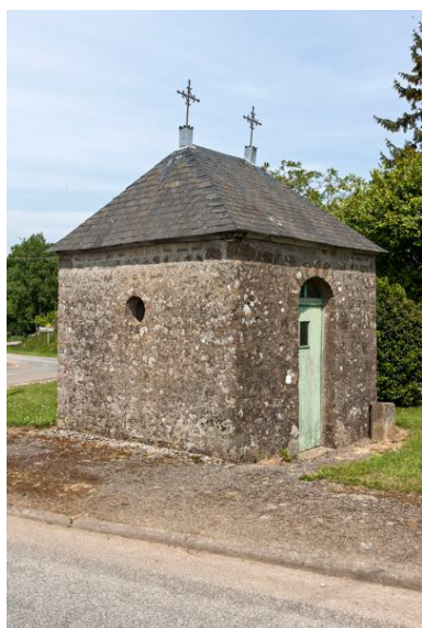
Oratoire de la Croix-Renaud.