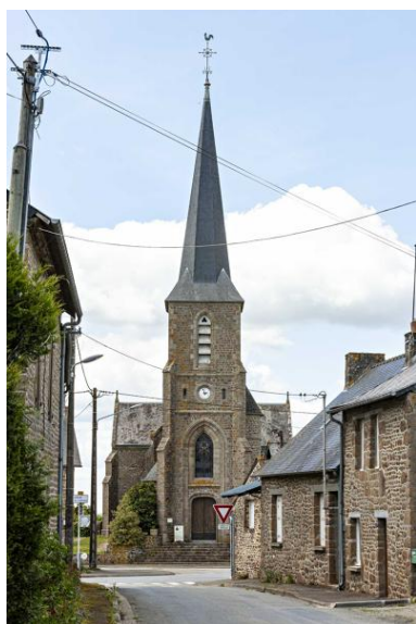
L'église Saint-Pierre, vue depuis la rue des bois. IVR52_20215300628NUCA