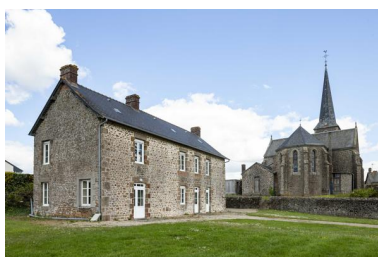
Presbytère et chevet de l'église. IVR52_20215300631NUCA