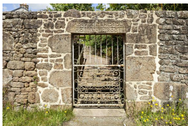
Vestiges d'une maison, linteau portant inscription (1806), boulevard Marguerite IVR52_20215300634NUCA