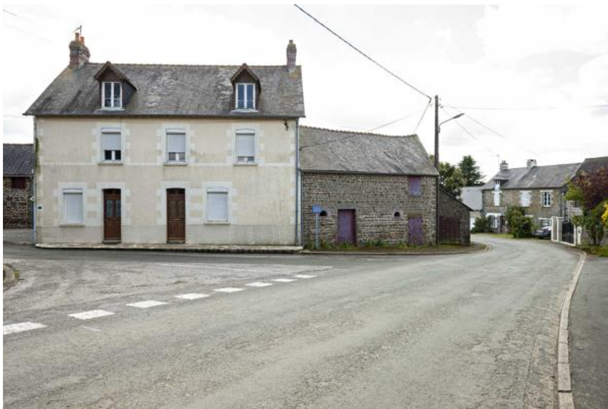
Maison, 2 boulevard Marguerite