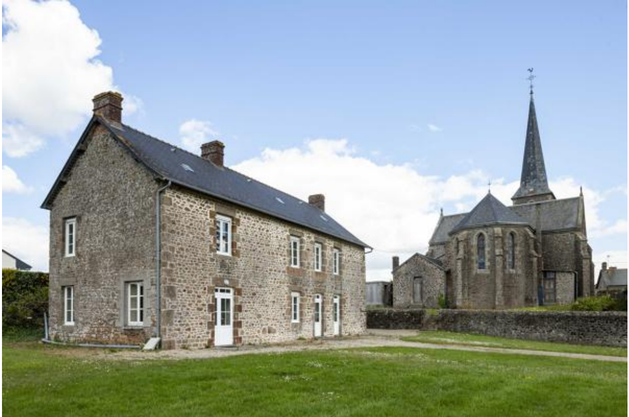
Presbytère et chevet de l'église.