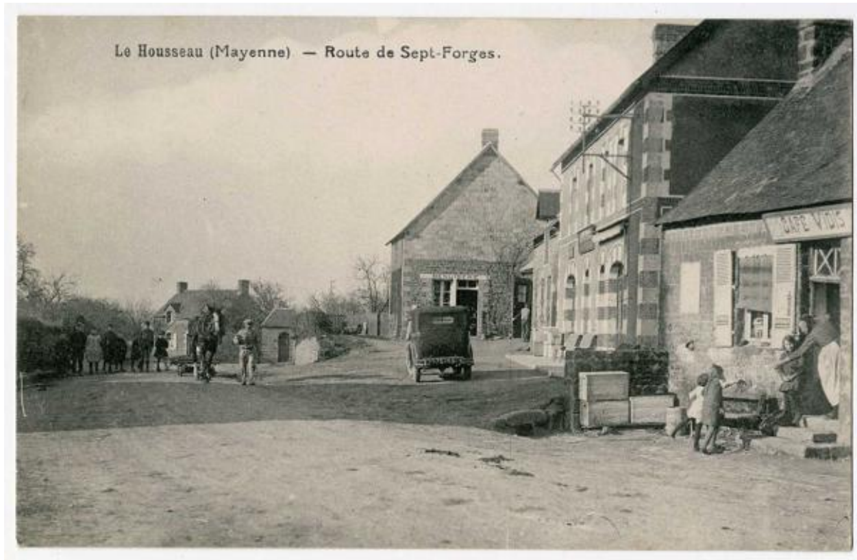
La route de Sept-Forges, carte postale.