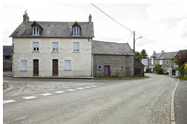
Maison, 2 boulevard Marguerite IVR52_20215300630NUCA