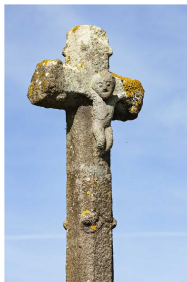
Croix du cimetière IVR52_20215300651NUCA