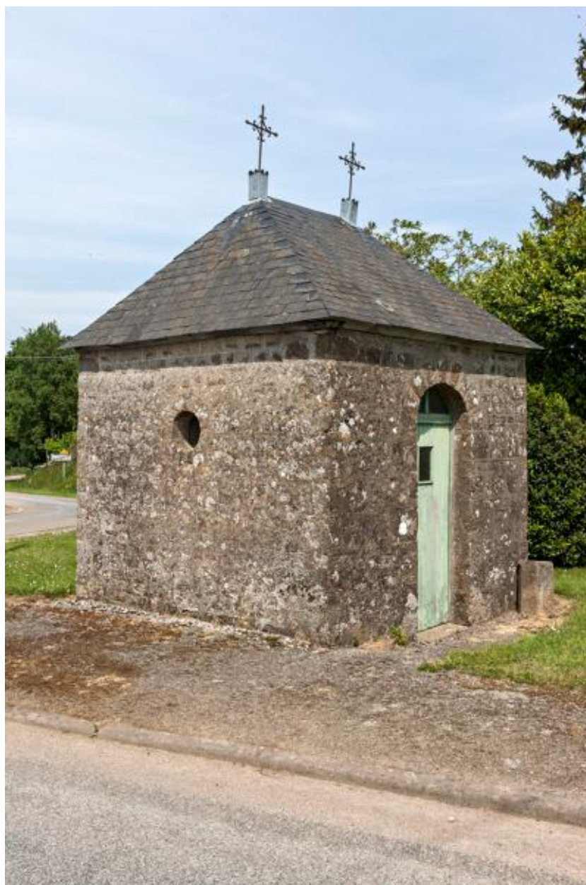
Oratoire de la Croix-Renaud.