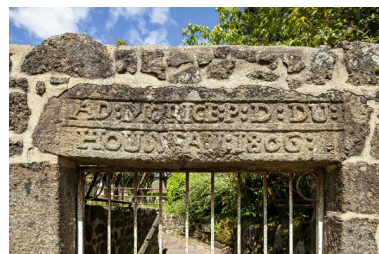
Vestiges d'une maison, linteau portant inscription (1806), boulevard Marguerite IVR52_20215300635NUCA