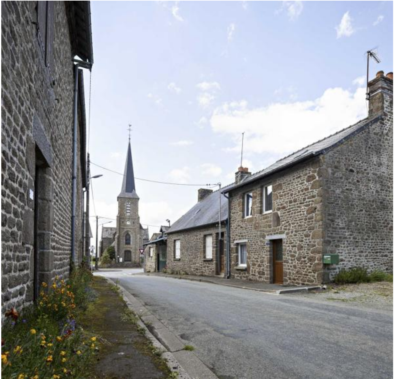
L'église Saint-Pierre, vue depuis la rue des bois.