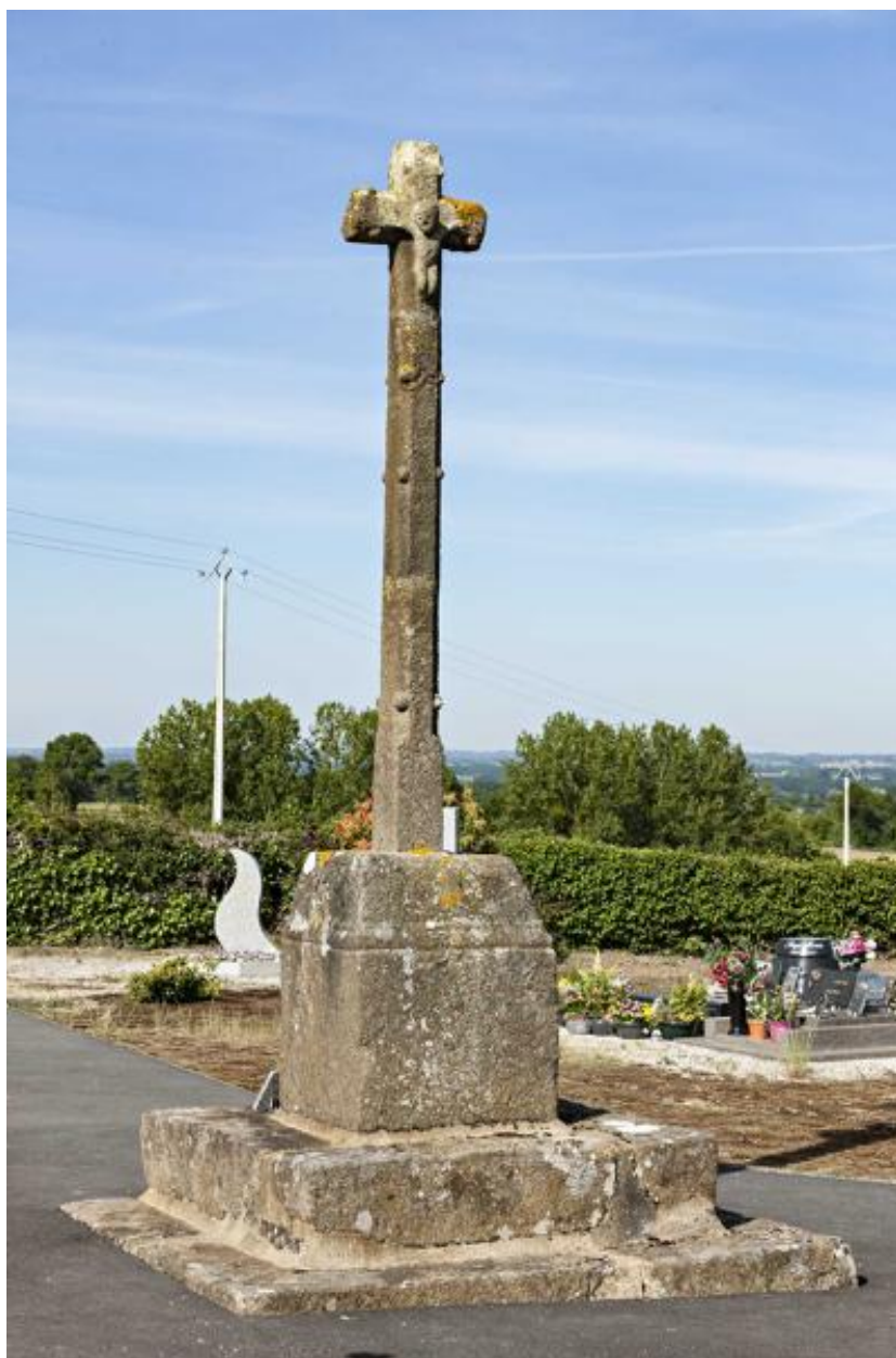
Croix du cimetière