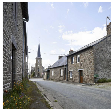
L'église Saint-Pierre, vue depuis la rue des bois. IVR52_20215300629NUCA