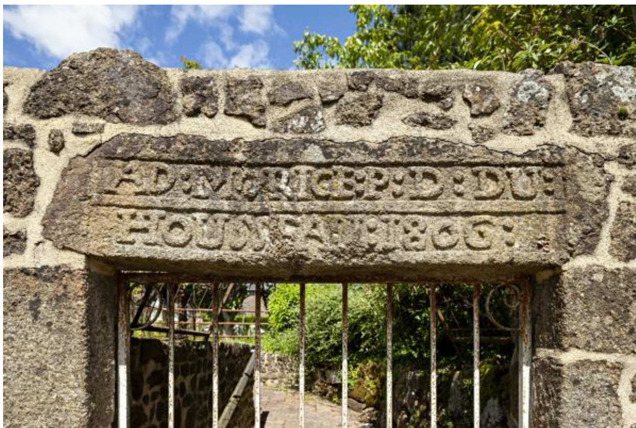
Vestiges d'une maison, linteau portant inscription (1806), boulevard Marguerite