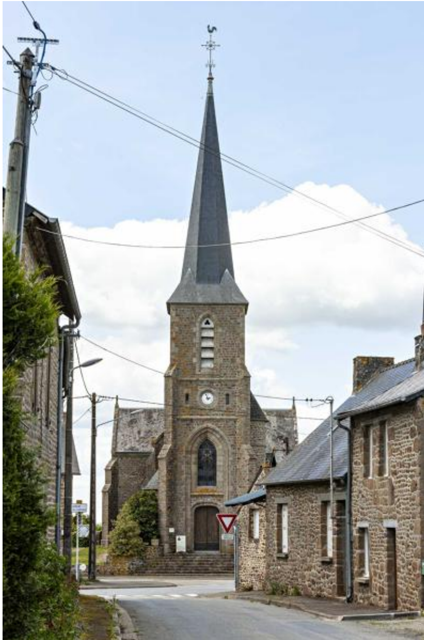
L'église Saint-Pierre, vue depuis la rue des bois.