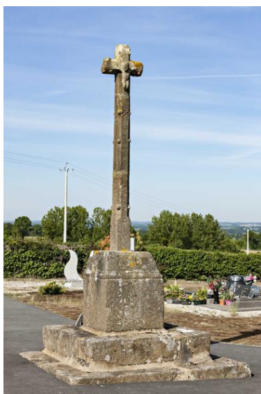
Croix du cimetière IVR52_20215300650NUCA