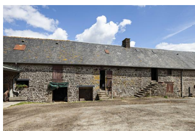
Ferme sud du bourg, 27 rue des Mont-de-la-Croix, façade sur cour IVR52_20215300633NUCA