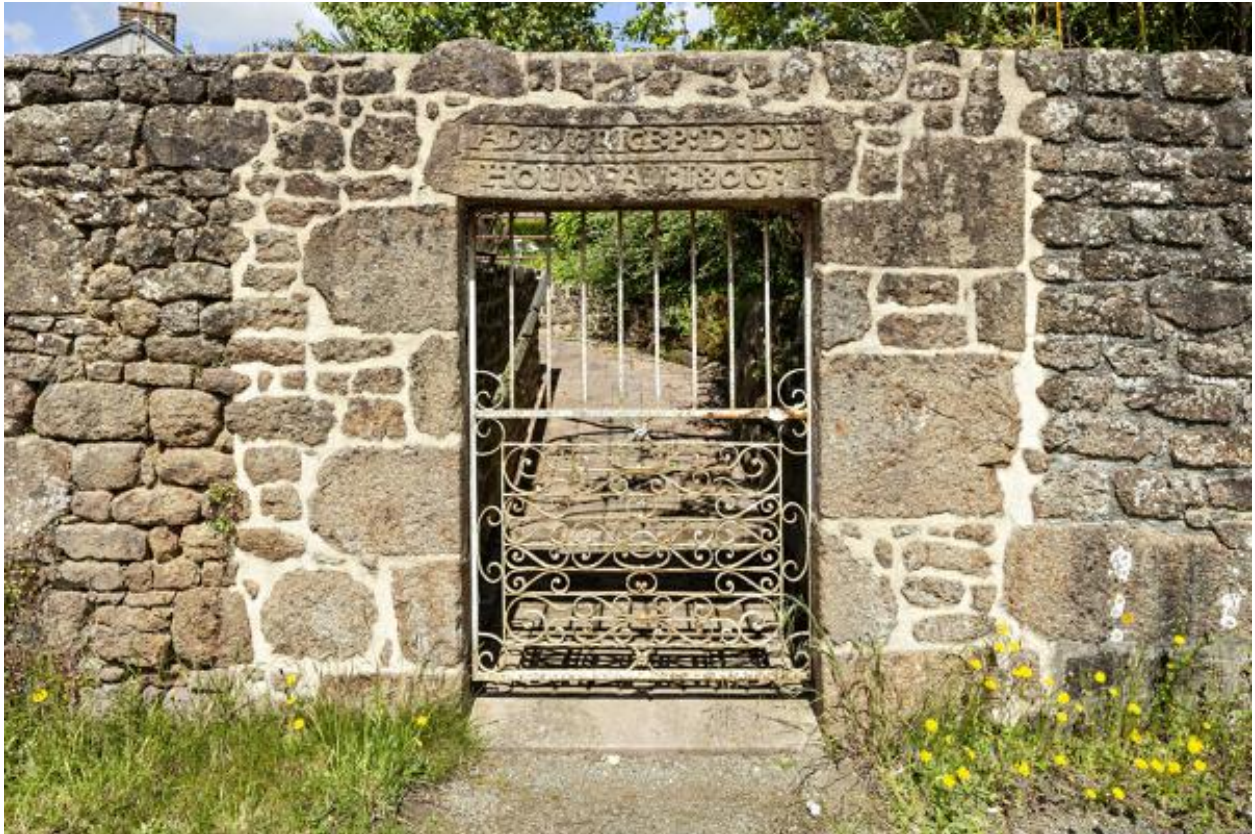
Vestiges d'une maison, linteau portant inscription (1806), boulevard Marguerite