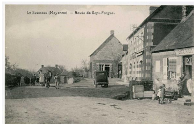
La route de Sept-Forges, carte postale.