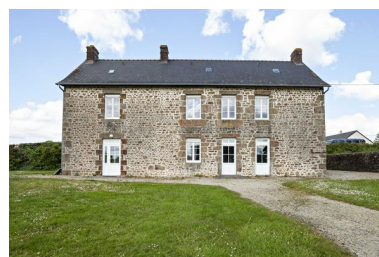
Ancien presbytère.