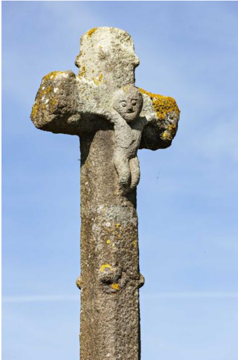
Croix du cimetière