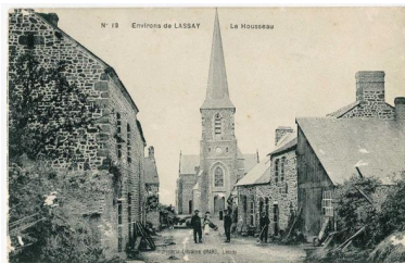
L'église Saint-Pierre vue depuis la rue des Bois, carte postale.