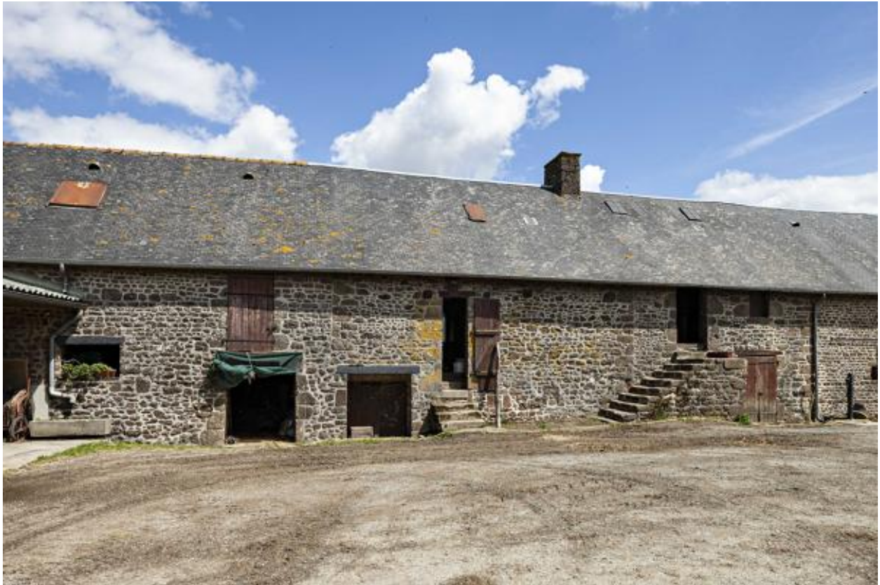
Ferme sud du bourg, 27 rue des Mont-de-la-Croix, façade sur cour