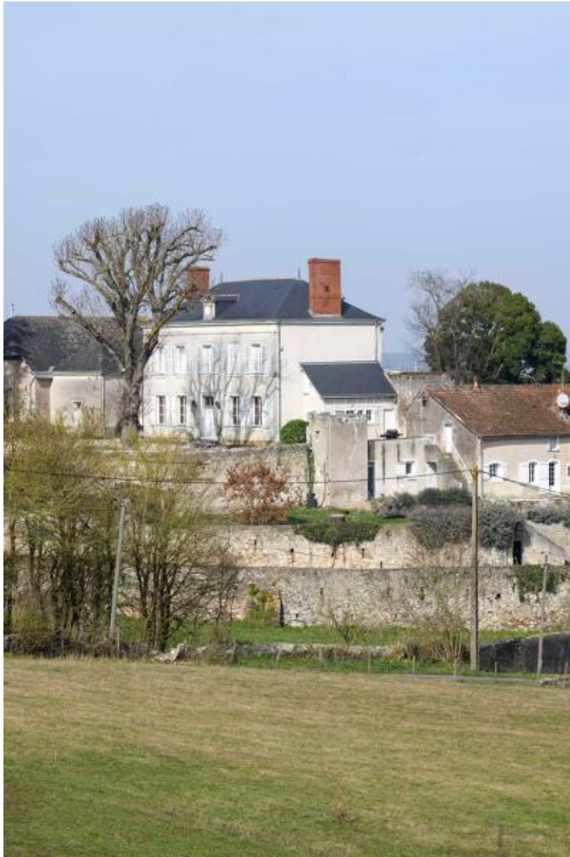
Vue depuis le sud-est.