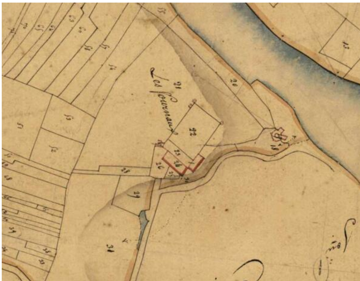
Maison Blanche, les Fourneaux. Plan cadastral (détail), 1827, section E1, parcelle 24. (AD Maine-et-Loire, 3 P 4/220/14).