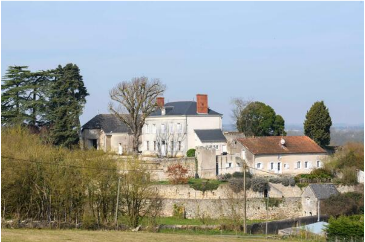
Vue de la propriété depuis le sud-est.