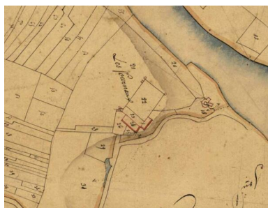
Maison Blanche, les Fourneaux. Plan cadastral (détail), 1827, section E1, parcelle 24. (AD Maine-et-Loire, 3 P 4/220/14). IVR52_20244900901NUCA