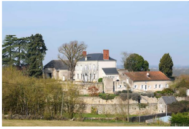
Vue de la propriété depuis le sud-est.