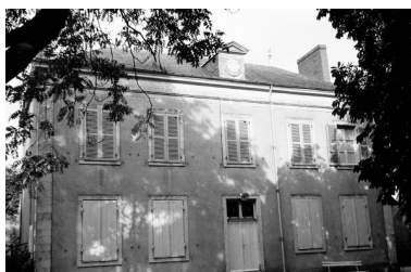
Elévation principale. IVR52_19724900384Z