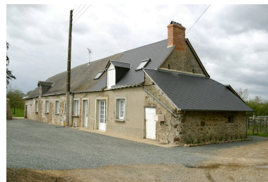
L'ancien logis-étable.