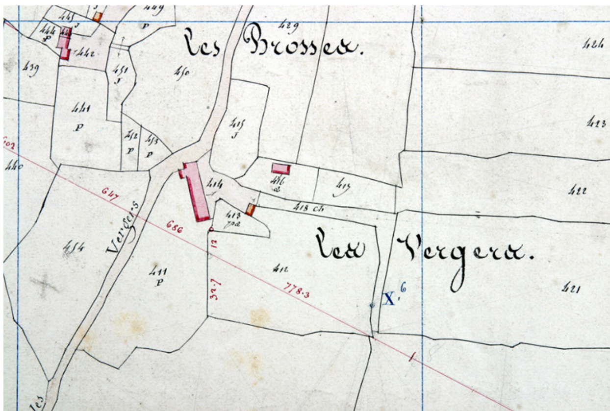
Extrait du plan cadastral de 1842, section F3.