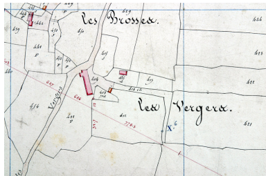
Extrait du plan cadastral de 1842, section F3. IVR52_20025301846NUCA