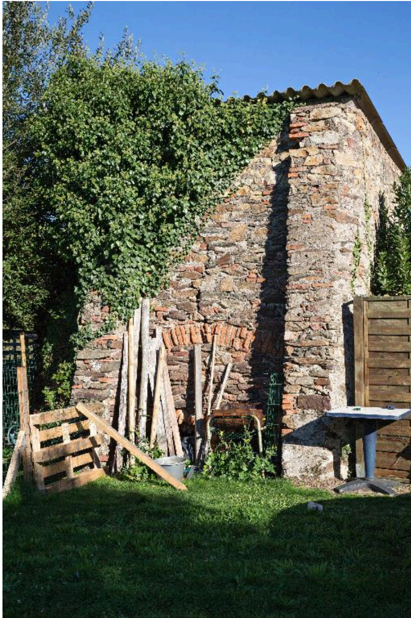
Four debout Dupont, village des Roseaux.