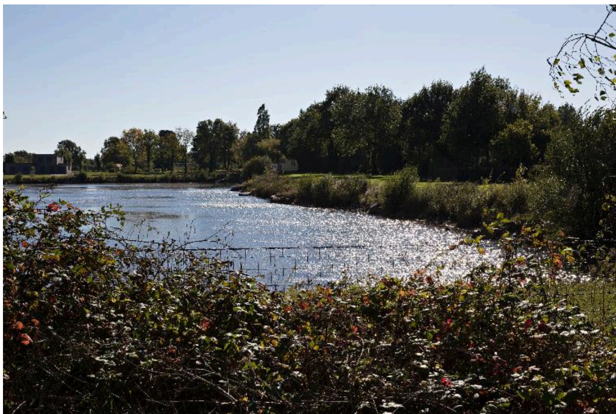
Ancienne carrière d'argile.