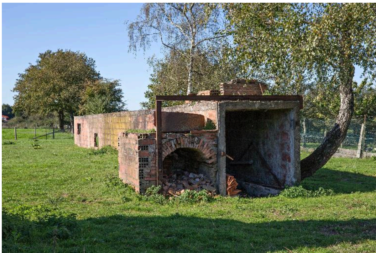
Four tunnel Gouleau, village des Tuileries.