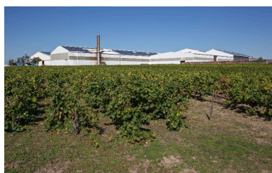
Usine Imérlys à la Boissière-du-Doré.