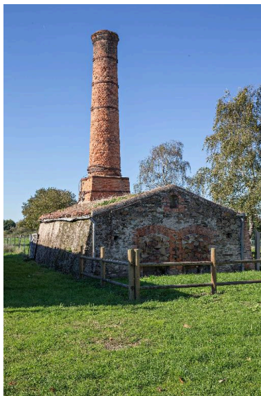
Four couché Gouleau, village des Tuileries. IVR52_20154400399NUCA