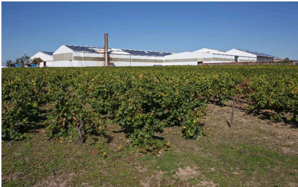
Usine Iméry's à la Boissière-du-Doré.