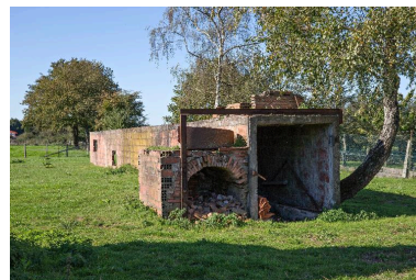
Four tunnel Gouleau, village des Tuileries.