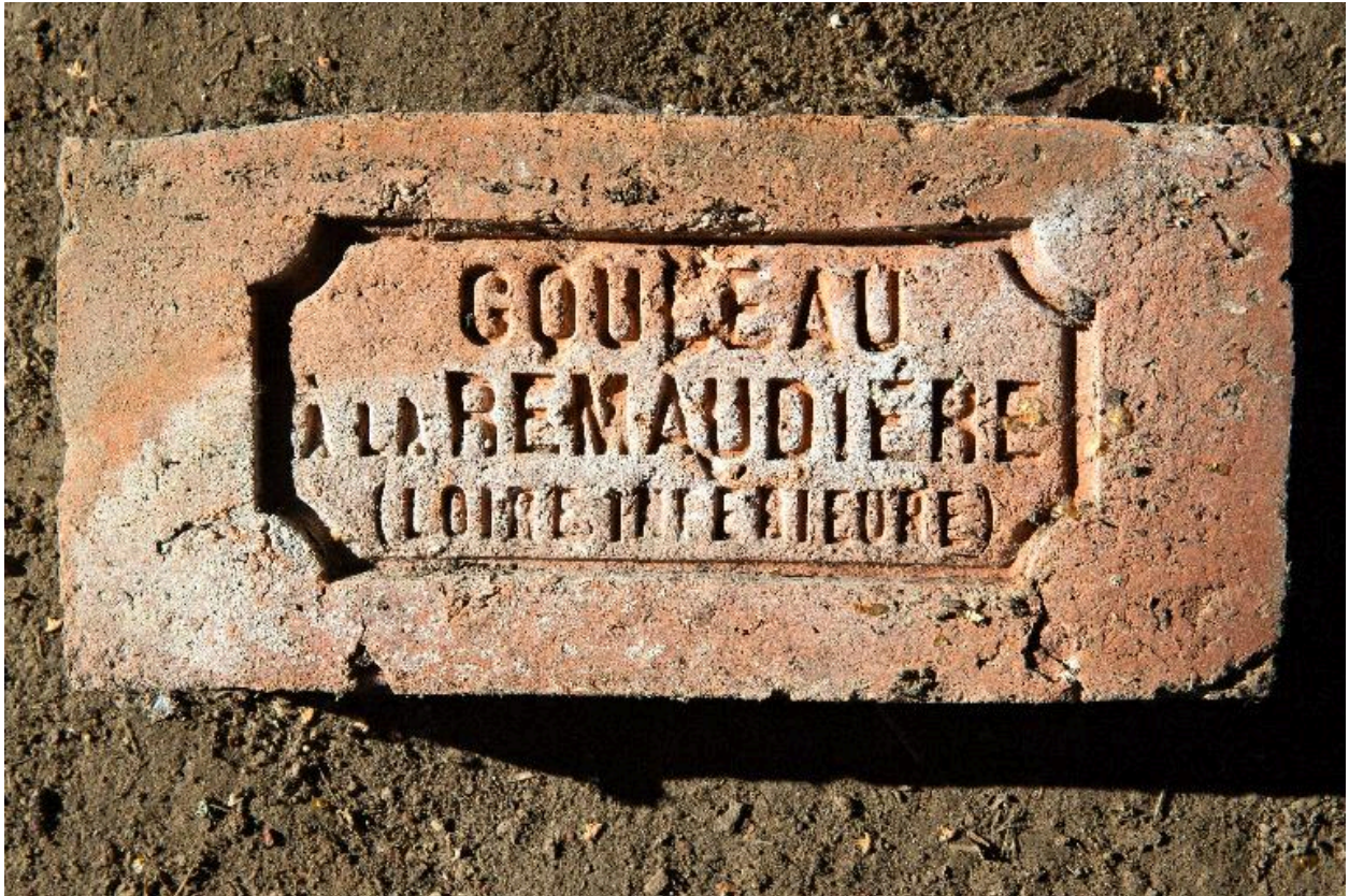
Brique de la briqueterie Gouveau, village des Tuileries.