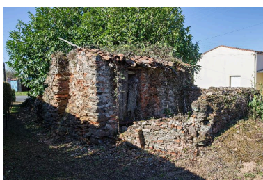
Four debout Huteau, village des Tuileries. IVR52_20154400404NUCA