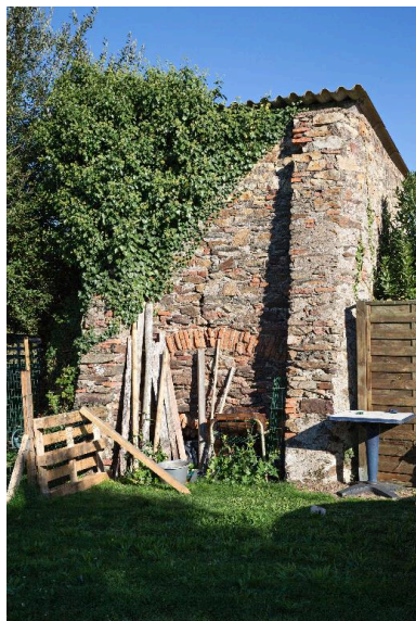
Four debout Dupont, village des Roseaux.