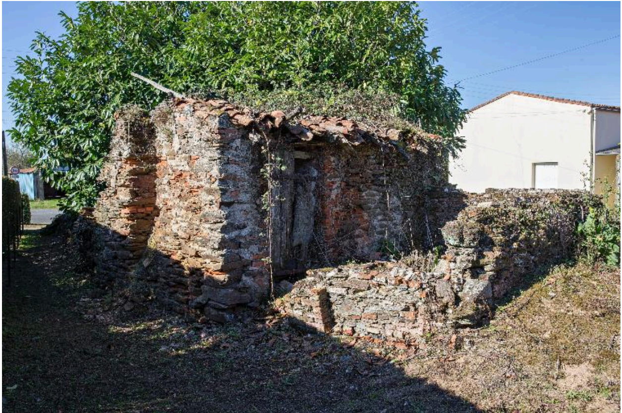
Four debout Huteau, village des Tuileries.