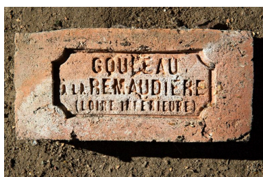
Brique de la briqueterie Gouleau, village des Tuileries.