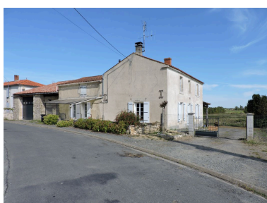
La ferme vue depuis le sud-est. IVR52_20198503284NUCA