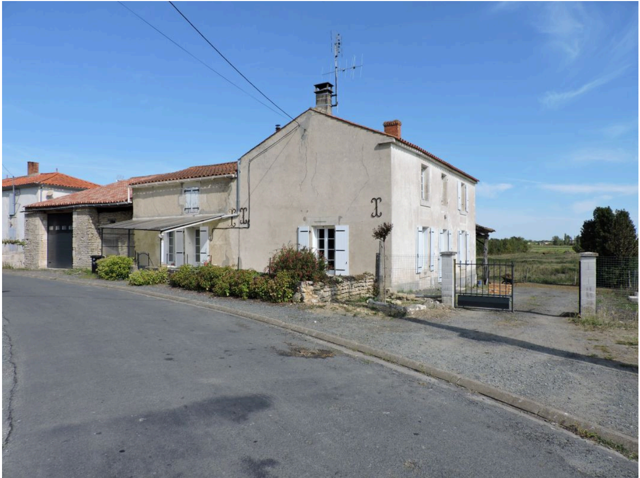
La ferme vue depuis le sud-est.