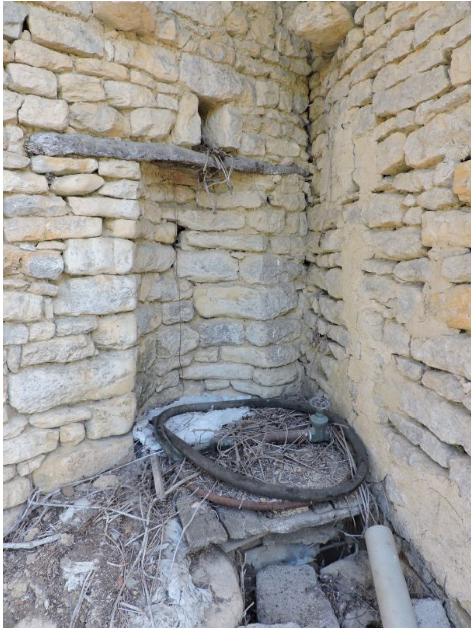
Puits compris dans le mur d'élévation de la dépendance.