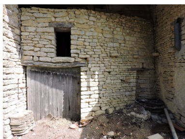
Ancienne étable en retrait ?