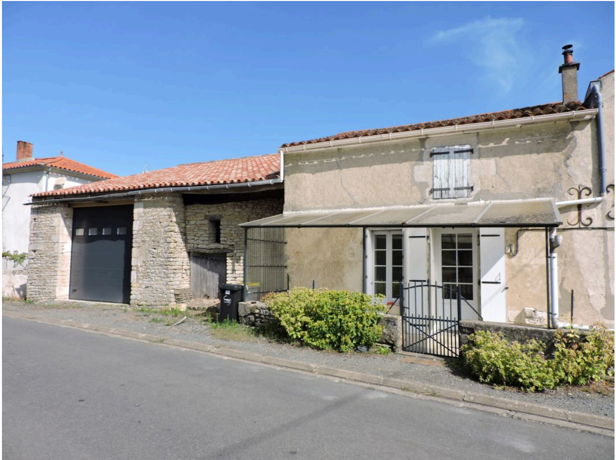
L'ancien logement, à droite, et les dépendances qui le prolongent.