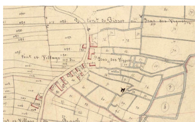
La parcelle 59, au centre, sur le plan cadastral de 1836.