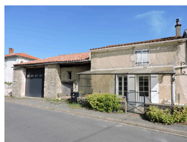
L'ancien logement, à droite, et les dépendances qui le prolongent. IVR52_20198503285NUCA