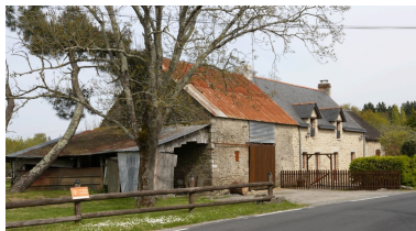
Vue d'ensemble de la rangée.