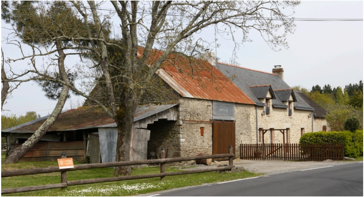
Vue d'ensemble de la rangée.