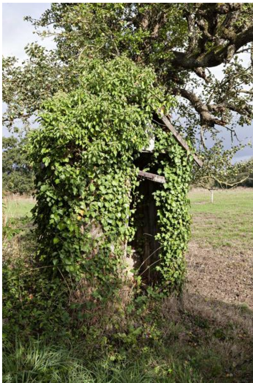
Toilette en fond de jardin, ferme de la Cour.