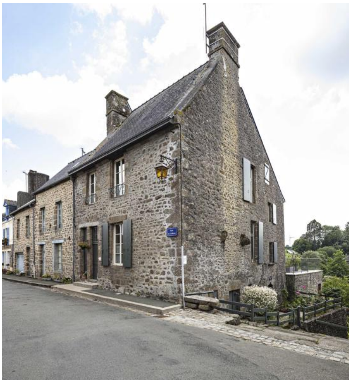
Ville de Lassay, maison, 20 rue du château.