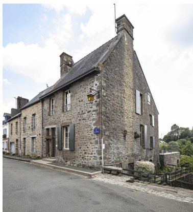
Ville de Lassay, maison, 20 rue du château.