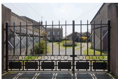
Vue générale. IVR52_20134401416NUCA