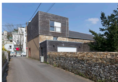
Arrière des dépendances transformées en maison.