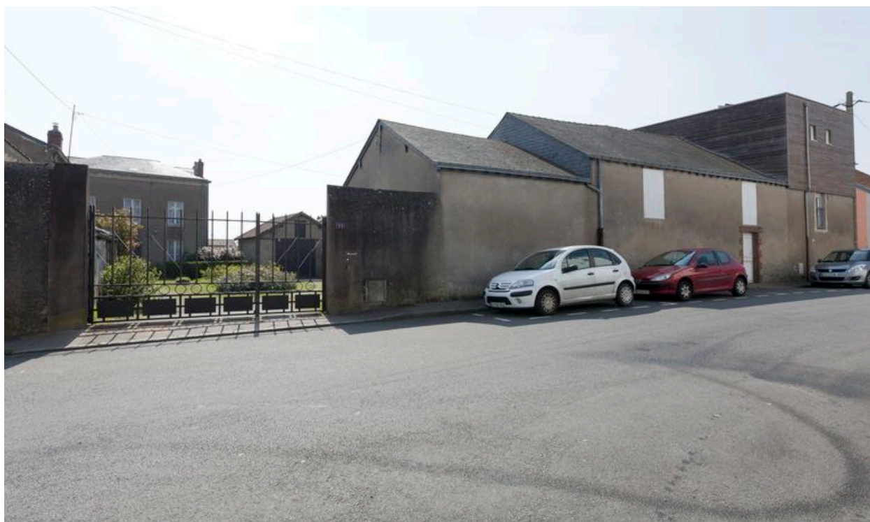
Maison avec dépendances sur rue.