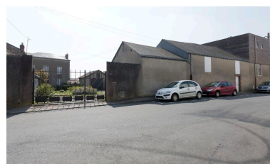
Maison avec dépendances sur rue. IVR52_20134401417NUCA