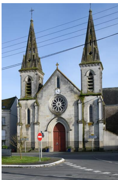
Façade occidentale.