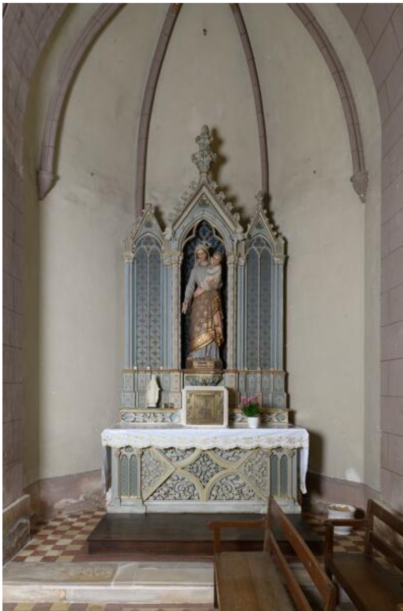
Bras sud du transept : autel et retable de la Vierge.