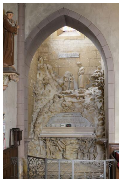
Tour nord : autel de l'apparition de la Vierge aux bergers de la Salette.

IVR52_20244900447NUCA