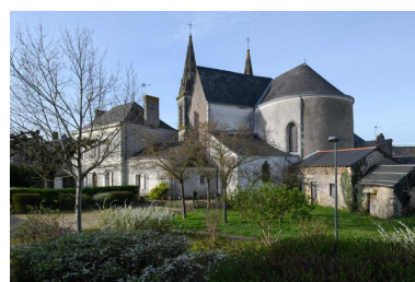
Chevet et bras sud du transept.