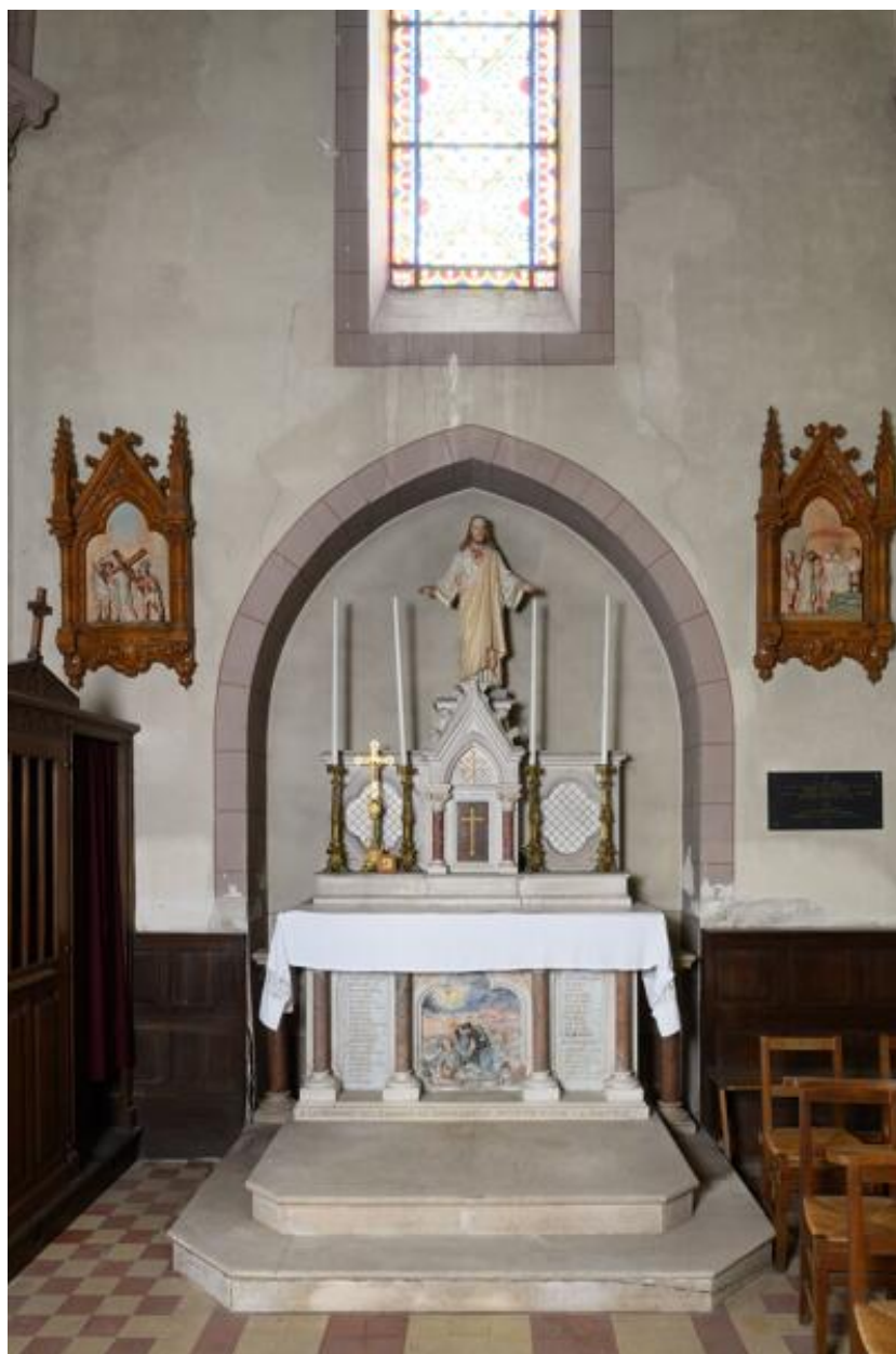
Bras sud du transept : autel privilégié et monument aux morts.