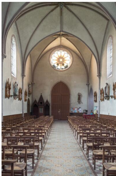
Nef depuis le chœur.

IVR52_20244900443NUCA