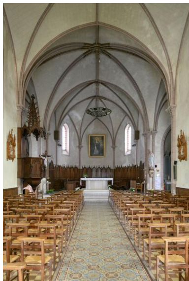
Net et chœur.

Phot. Armelle Maugin IVR52_20244900443NUCA