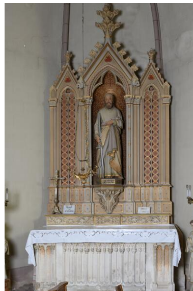
Bras nord du transept : autel et retable de saint Joseph.

IVR52_20244900445NUCA