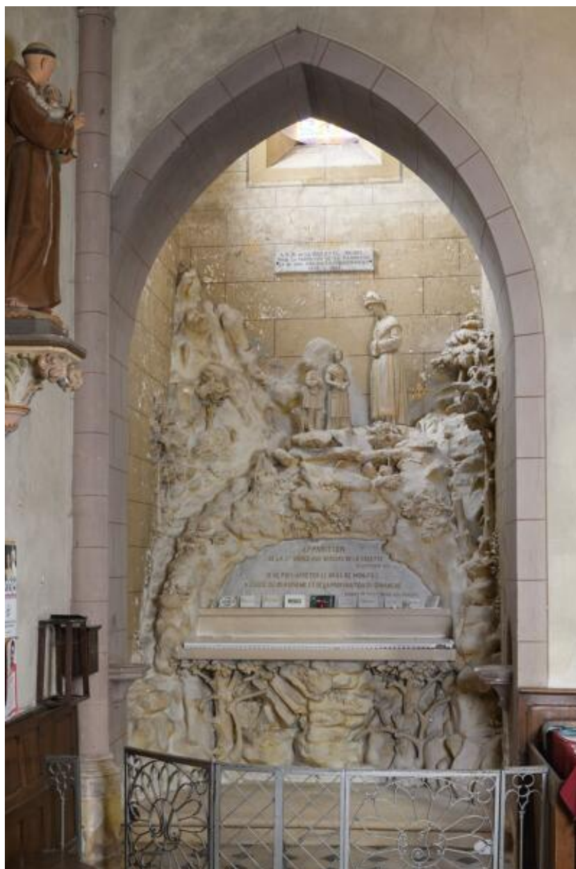
Tour nord : autel de l'apparition de la Vierge aux bergers de la Salette.