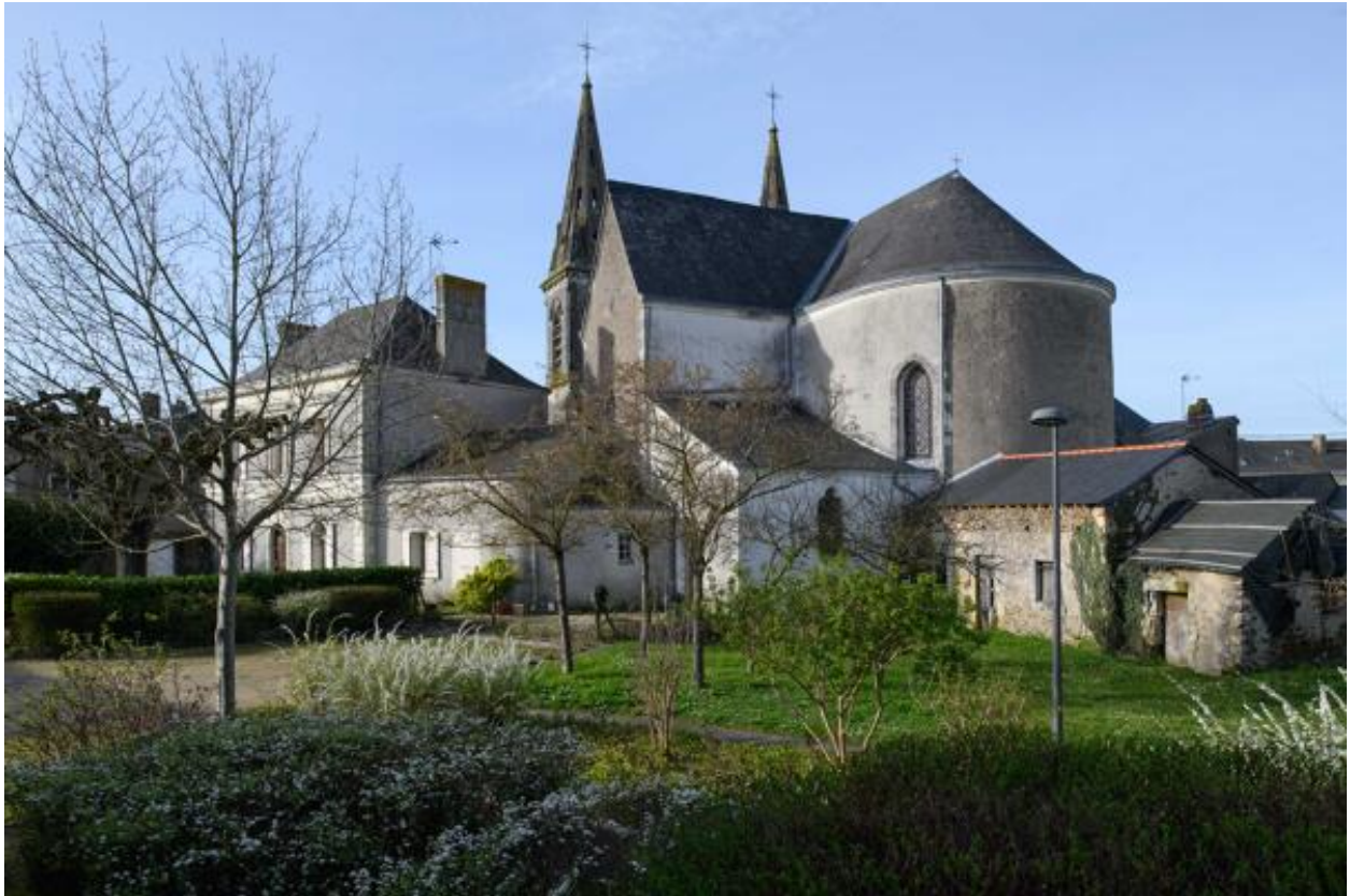
Chevet et bras sud du transept.