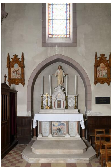
Bras sud du transept : autel privilegié et monument aux morts.

IVR52_20244900446NUCA