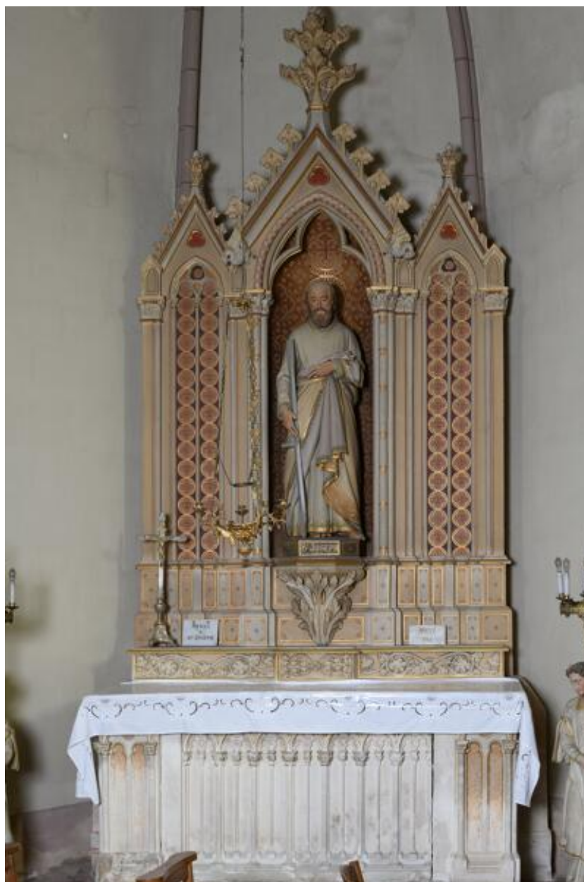
Bras nord du transept : autel et retable de saint Joseph.