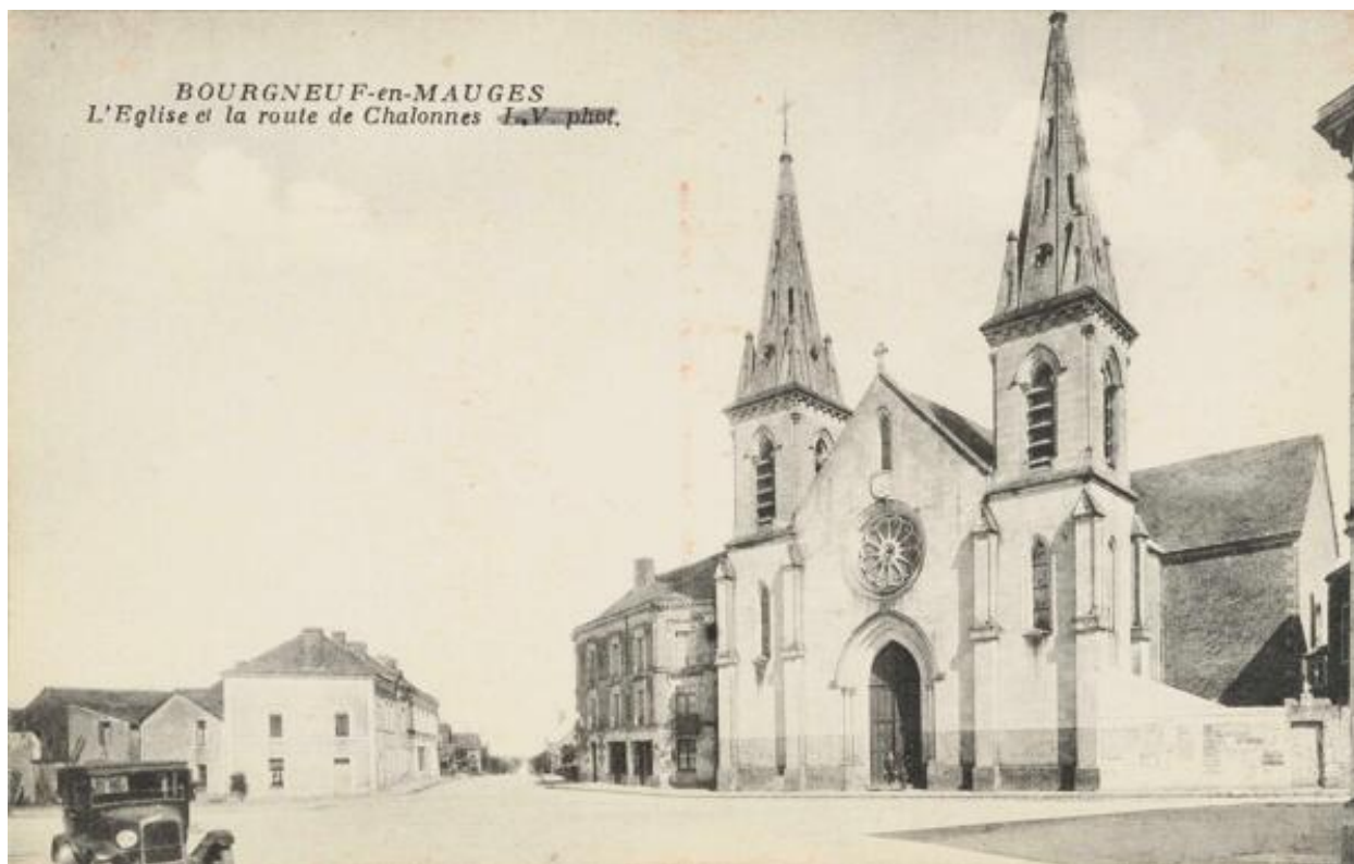
L'église paroissiale Notre-Dame de Bourgneuf et de la route de Chalennes, carte postale, début du XXe siècle.