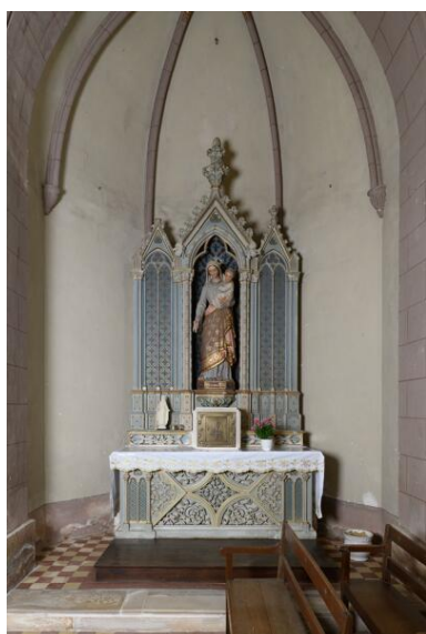
Bras sud du transept : autel et retable de la Vierge.

Phot. Armelle Maugin IVR52_20244900448NUCA