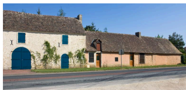
Vue partielle : communs, logement et parties agricoles