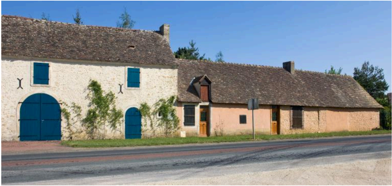
Vue partielle : communs, logement et parties agricoles