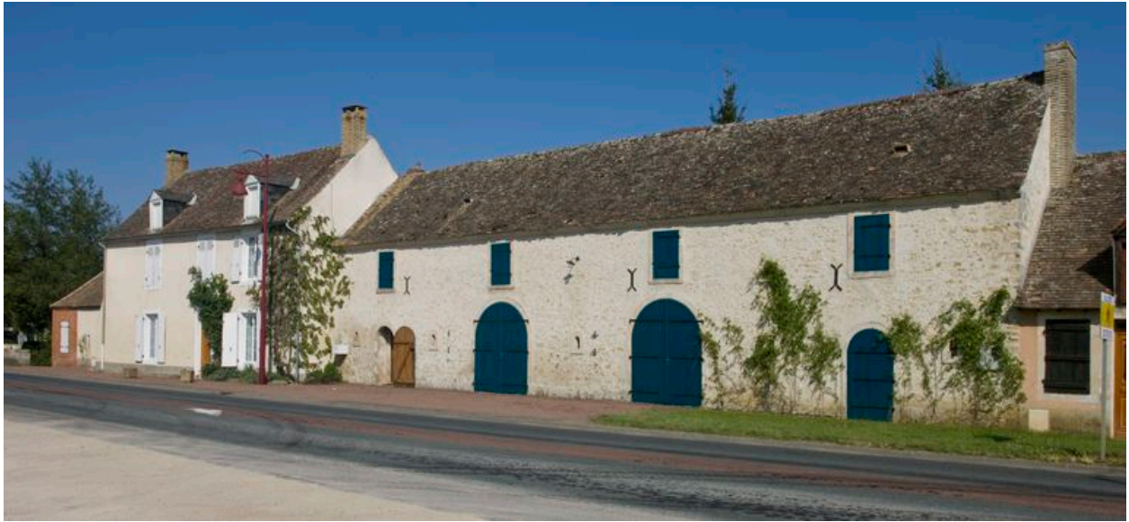
Vue partielle : la maison de maître et les communs, et logement (à gauche)