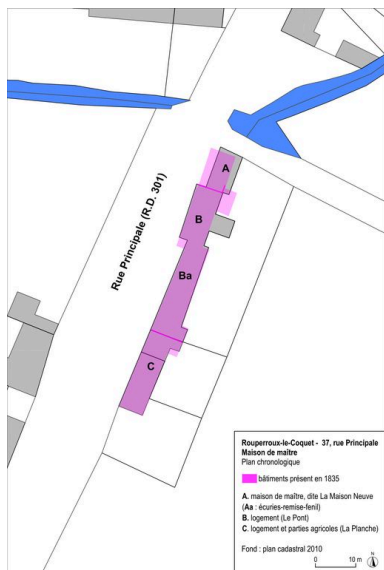
Plan chronologique IVR52_20137200018NUDA