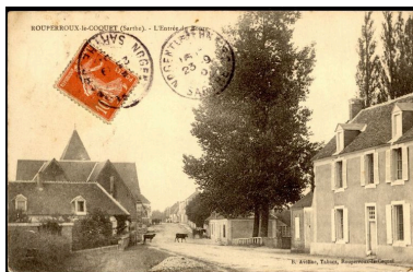
Vue de la maison de maître dans le 1er quart du XXe siècle