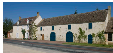
Vue partielle : la maison de maître et les communs, et logement (à gauche)