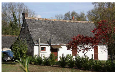
Maison, parcelle 53 : façade antérieure à l'ouest. IVR52_20087202582NUCA