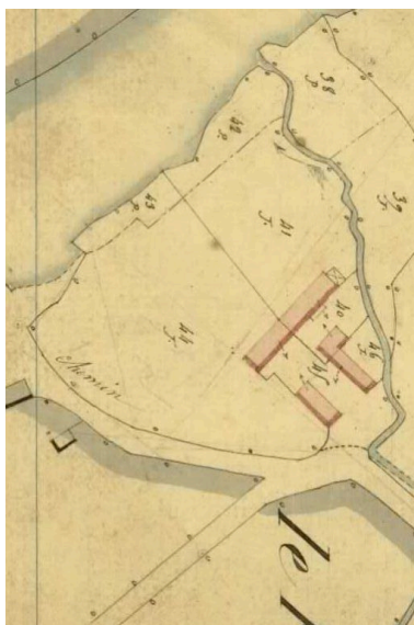
Plan en 1845. IVR52_20057204631NUCA