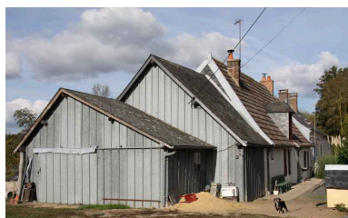
parcelle 396 : maison du XVIe siècle. IVR52_20087202583NUCA