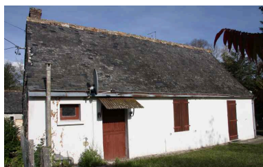
Maison, parcelle 55 : façade sur le chemin. IVR52_20087202590NUCA