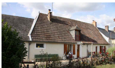
Maison, parcelle 396 : façade sur cour. IVR52_20087202589NUCA