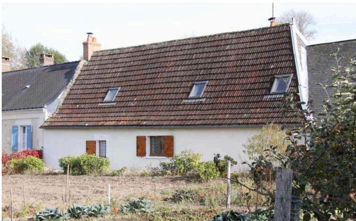
Maison du XVIe siècle, parcelle 396 : façade postérieure.