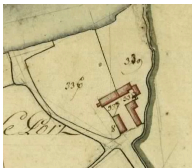
Plan en 1811. IVR52_20057204635NUCA