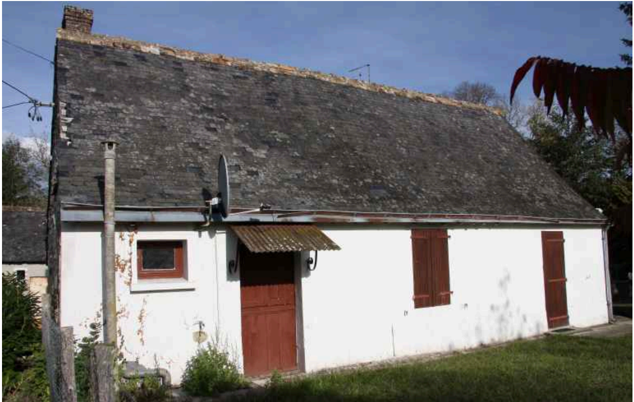
Maison, parcelle 55 : façade sur le chemin.