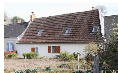
Maison du XVIe siècle, parcelle 396 : façade postérieure.