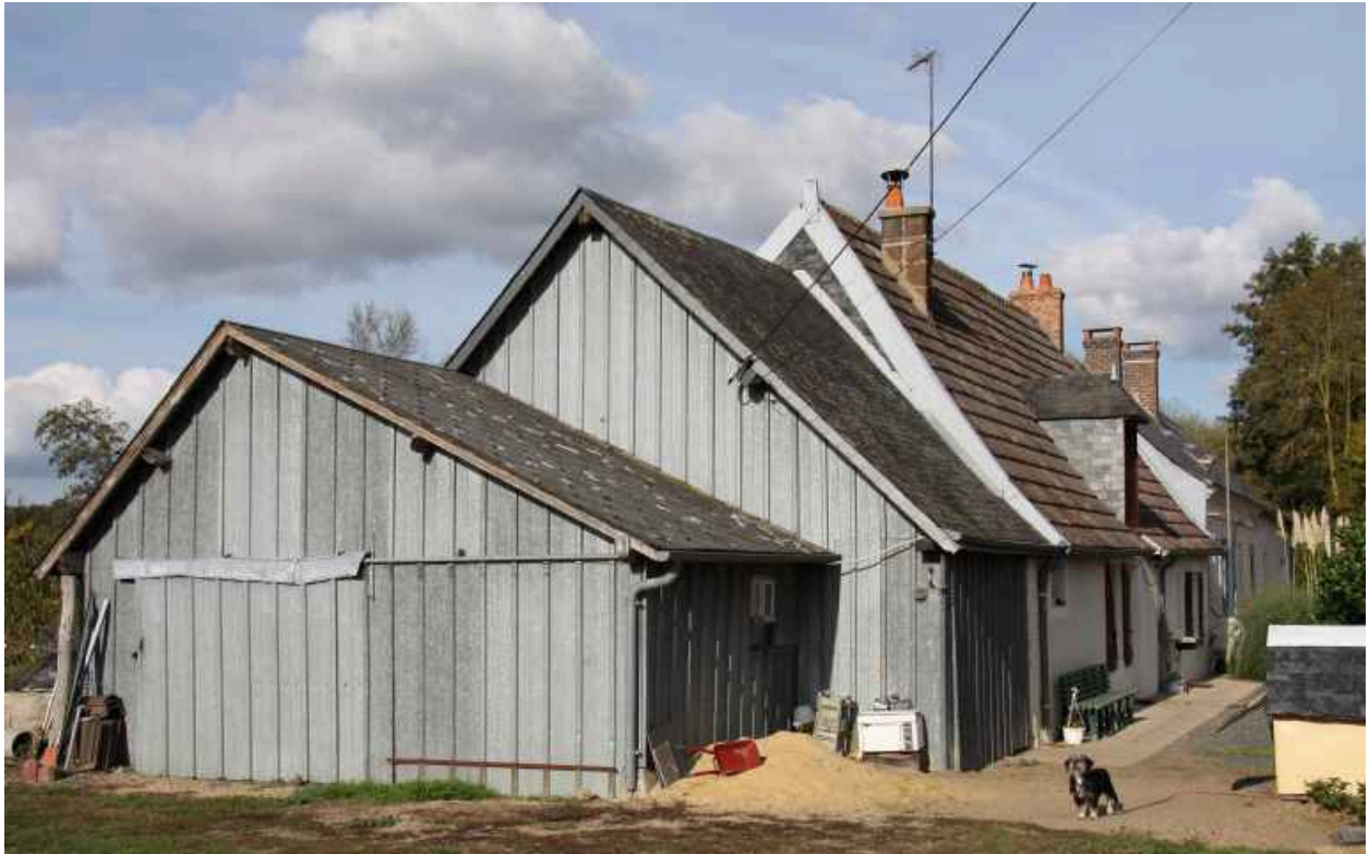
parcelle 396 : maison du XVIe siècle.