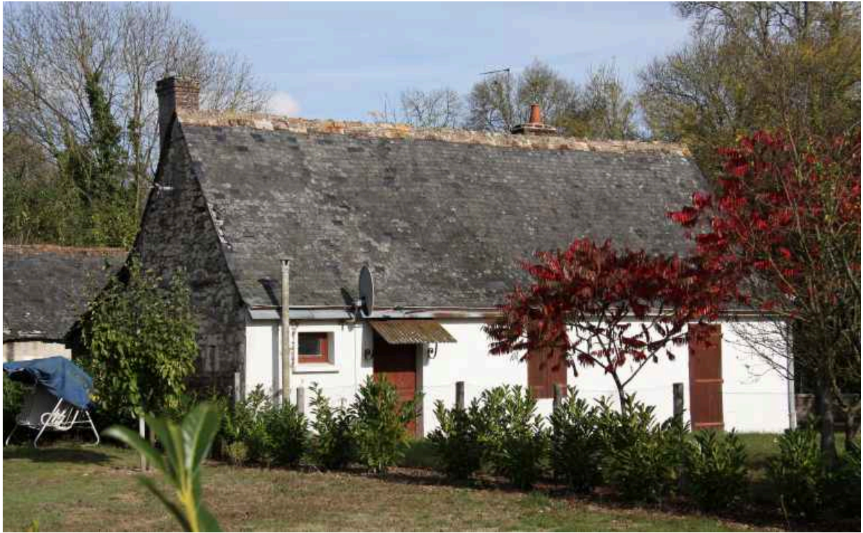
Maison, parcelle 53 : façade antérieure à l'ouest.