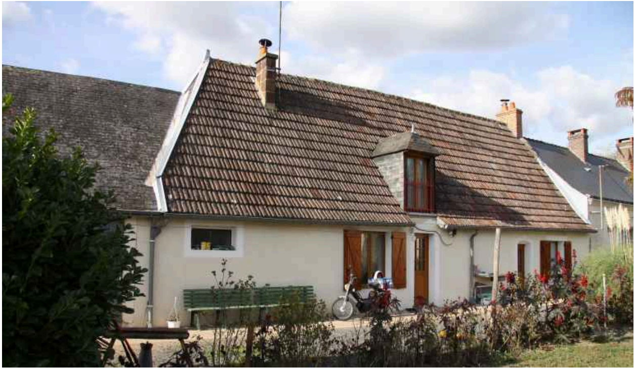
Maison, parcelle 396 : façade sur cour.