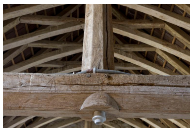
Chapelle, charpente : détail. IVR52_20117200020NUCA