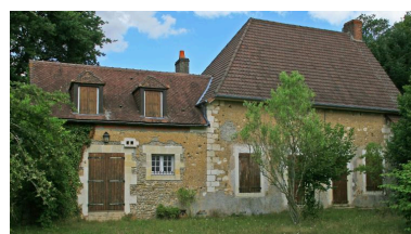
Chapelle Saint-Blaise du Houx (à droite).