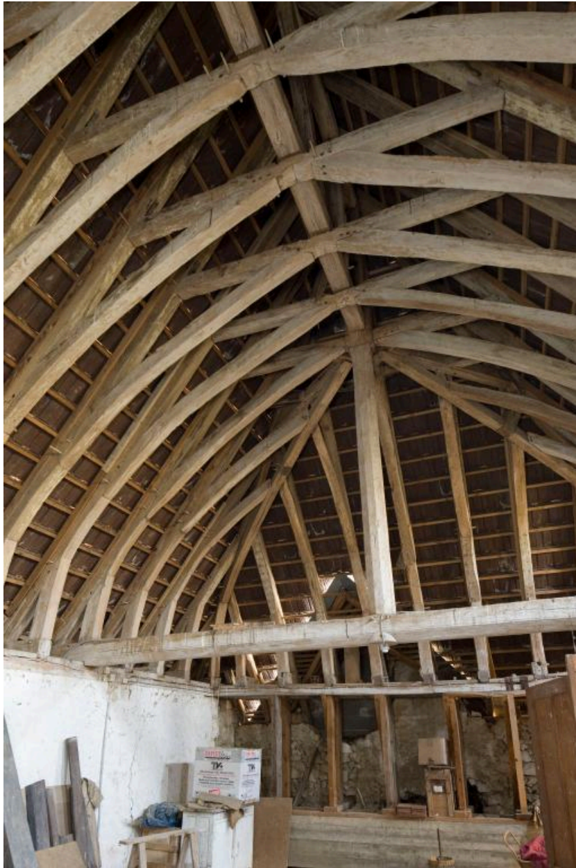
Chapelle : charpente et mur ouest (reconstruit).