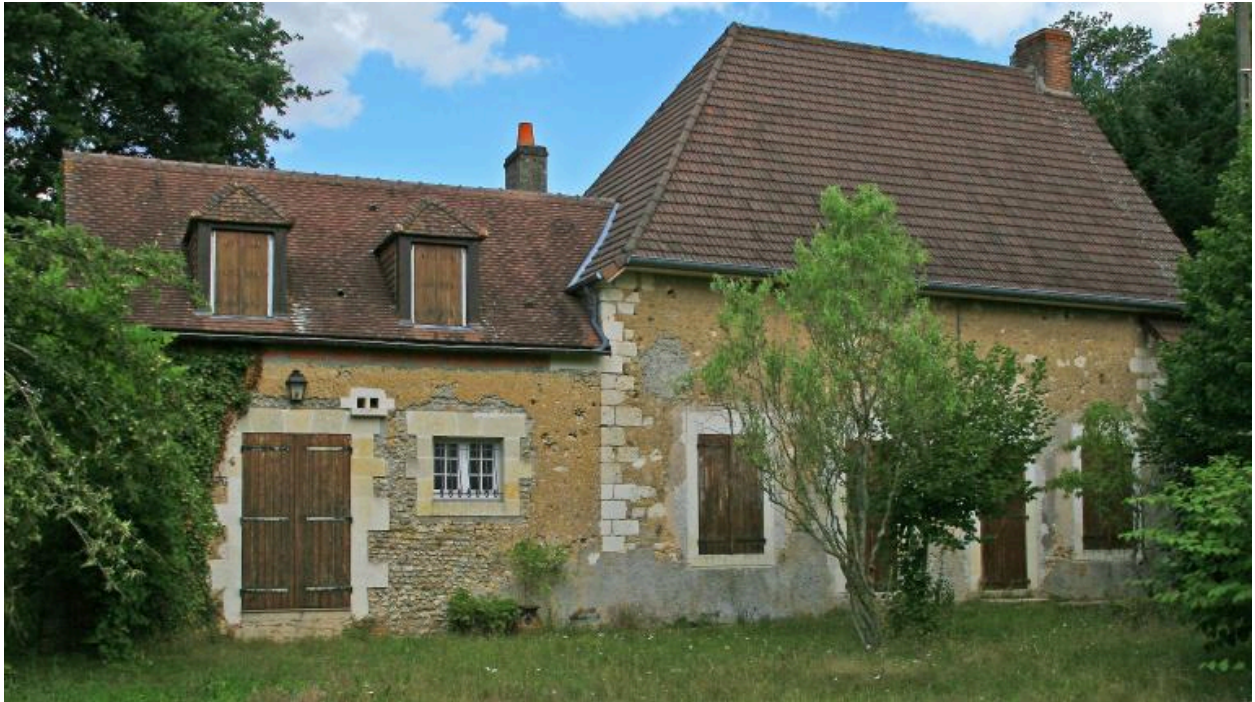
Chapelle Saint-Blaise du Houx (à droite).