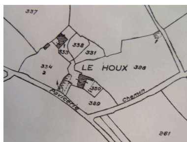
Extrait du plan cadastral de 1982. IVR52_20097202143NUCA