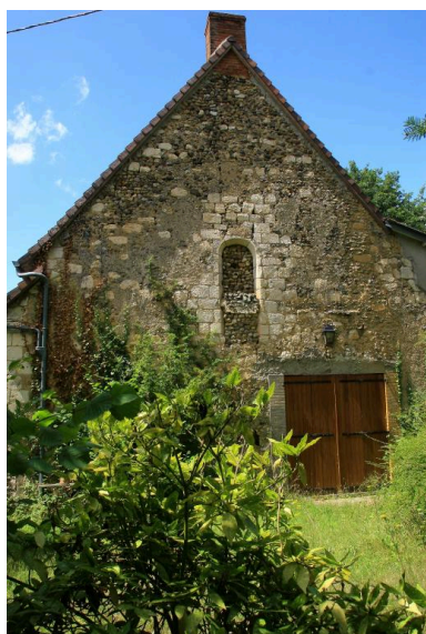
Chevet de la chapelle.