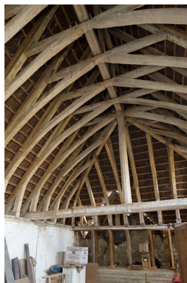
Chapelle : charpente et mur ouest (reconstruit). IVR52_20117200019NUCA