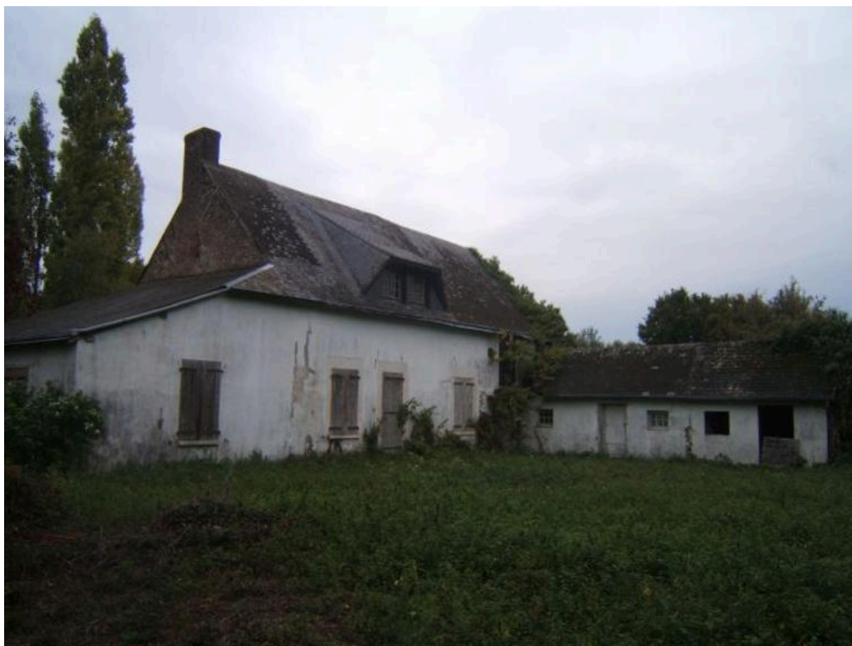
Métairie du prieuré.