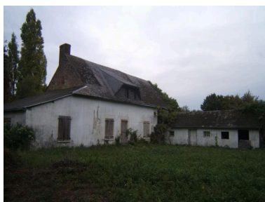
Métairie du prieuré. IVR52_20097202107NUCA