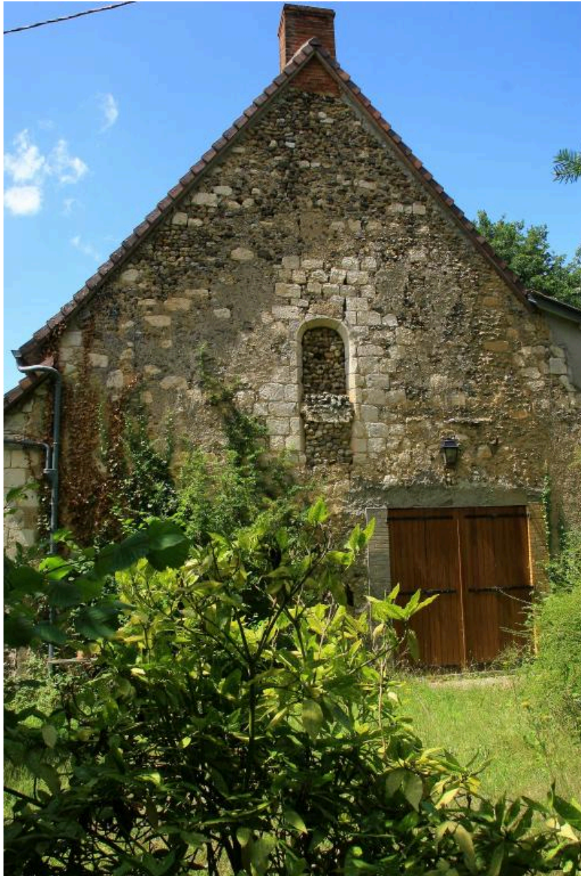
Chevet de la chapelle.