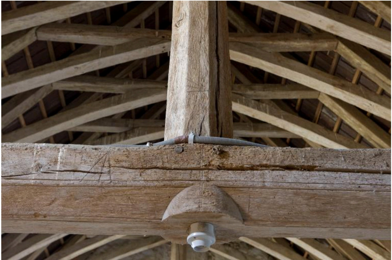
Chapelle, charpente : détail.