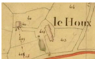
Extrait du plan cadastral de 1818. IVR52_20097202166NUCA