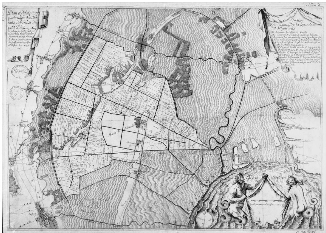
Le canal des Cinq Abbés, en haut et au centre, sur la carte des marais du Petit-Poitou par Siette en 1648.