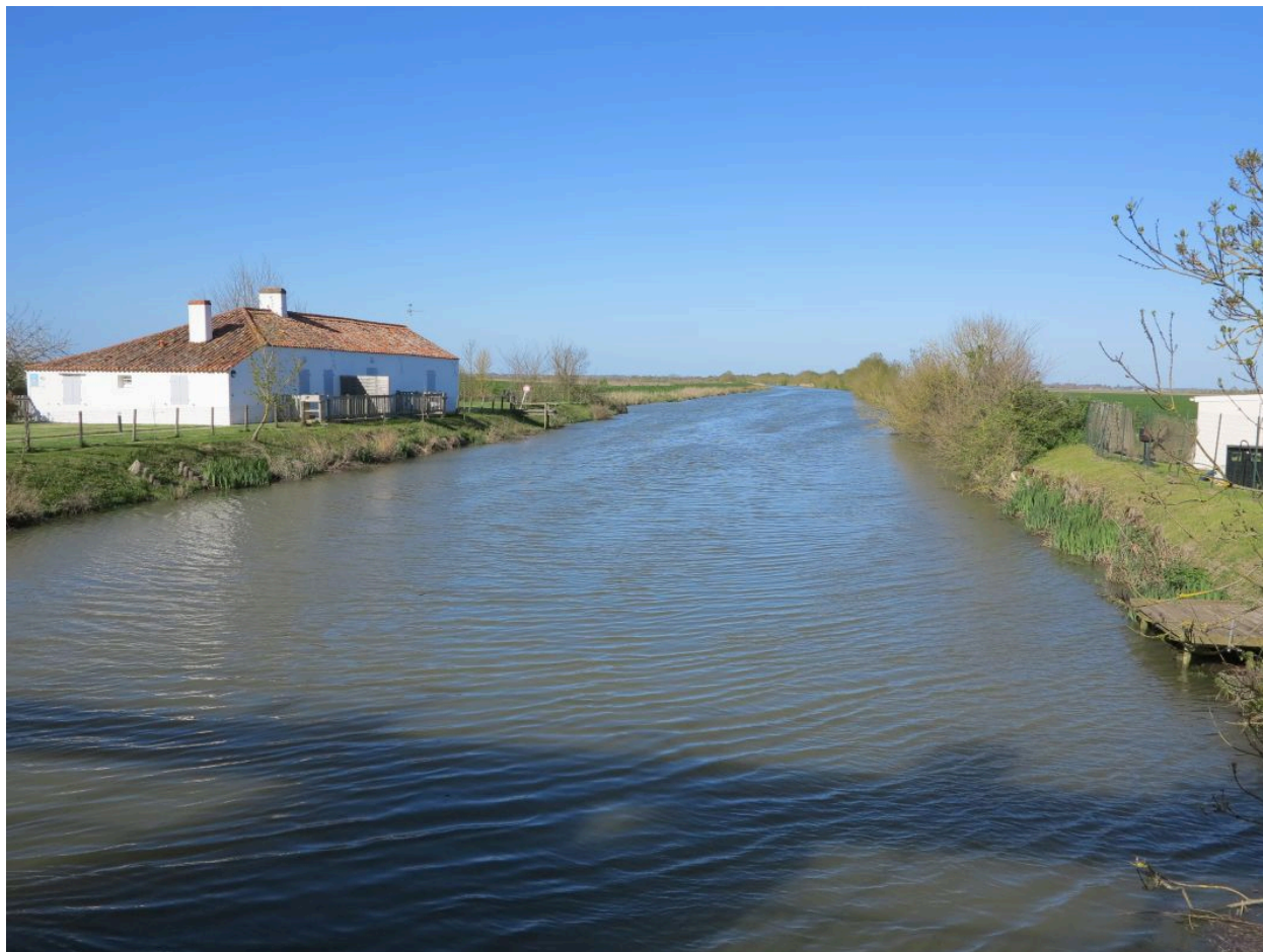
Le canal des Cinq Abbés vu depuis sa porte, en direction du nord-est.