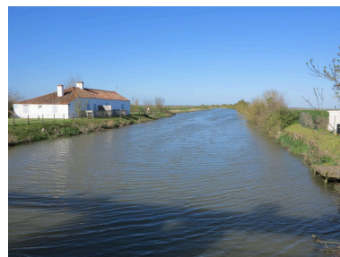
Le canal des Cinq Abbés vu depuis sa porte, en direction du nord-est.

Le canal des Cinq Abbés, en bas à droite, au sein du