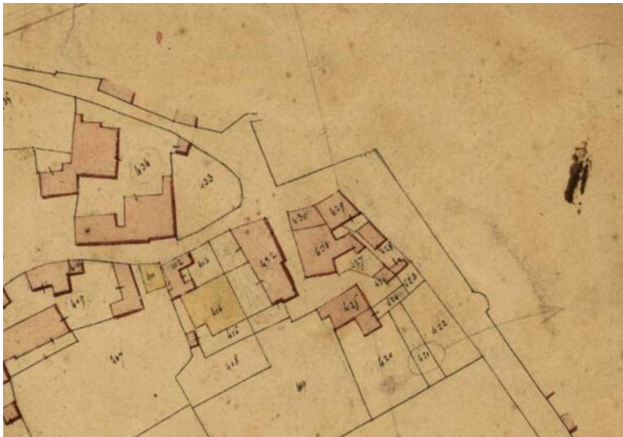
Plan cadastral (détail), 1827, section D1, parcelles 412 à 432. (AD Maine-et-Loire ; 3 P 4/220/12).