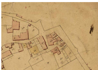
Plan cadastral (détail), 1827, section D1, parcelles 412 à 432. IVR52_20244900895NUCA

IVR52_19834901685X