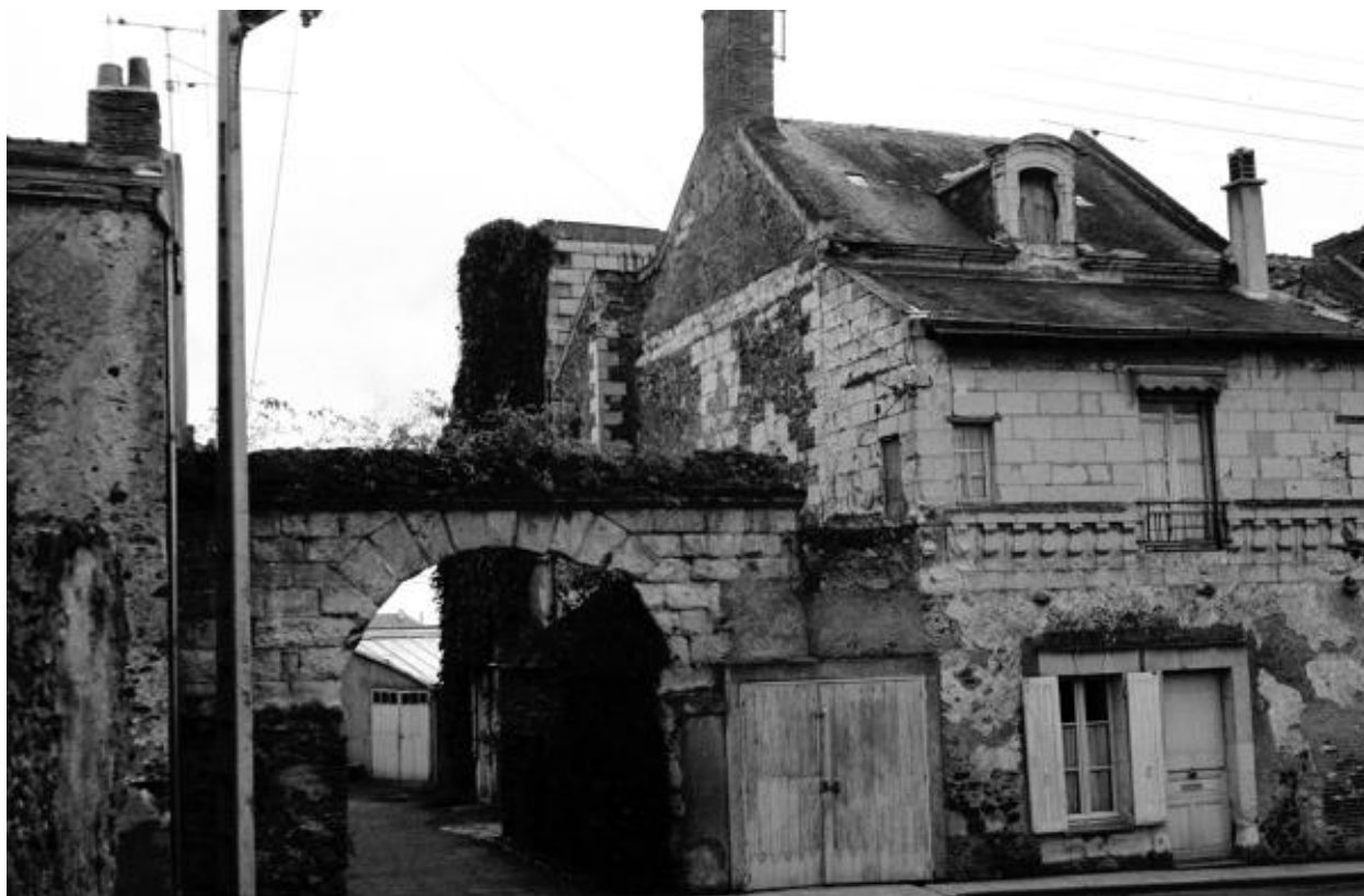
Portail et façade antérieure, avant restauration, 1972.