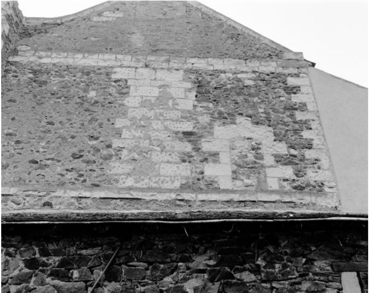
Façade latérale gauche, détail d'ouvertures murées, 1985.