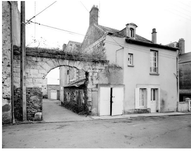
Portail et façade antérieure, après restauration, 1985. IVR52_19854902256V