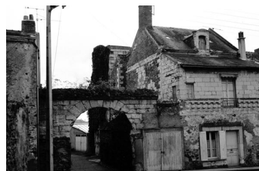
Portail et façade antérieure, avant restauration, 1972. IVR52_19724900372Z