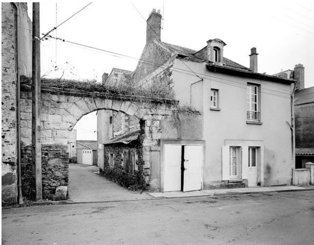
Portail et façade antérieure, après restauration, 1985.