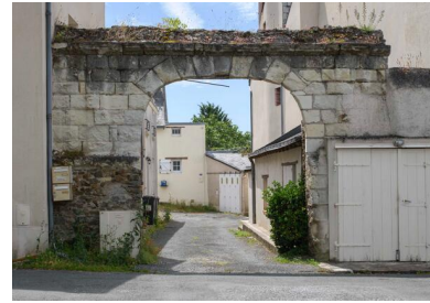
Portail d'entrée.