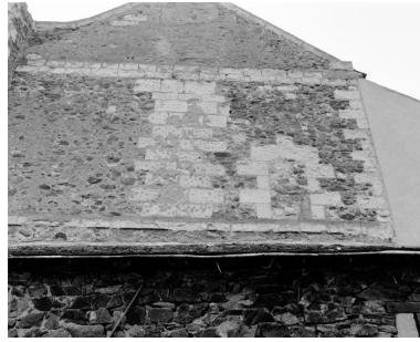
Façade latérale gauche, détail d'ouvertures murées, 1985. IVR52_19854902243X