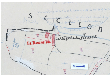
Extrait du plan cadastral de 1936, section E1. IVR52_20045301291NUCA