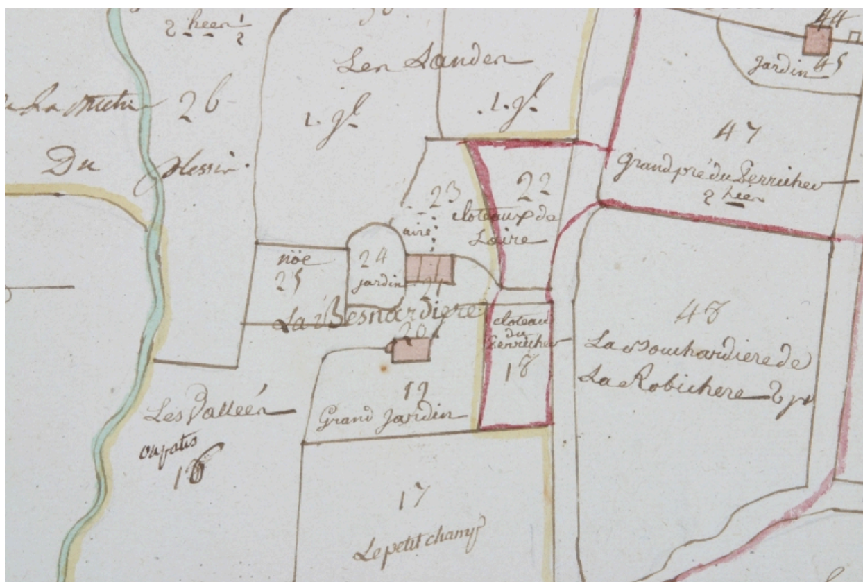
Extrait du plan terrier de la seigneurie d'Aubigné, vers 1772, pl. 7.