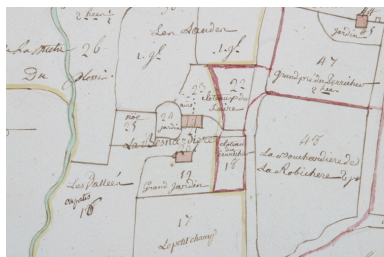
Extrait du plan terrier de la seigneurie d'Aubigné, vers 1772, pl. 7.