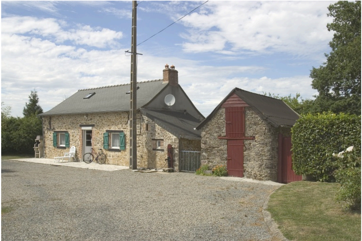
Le logis et la porcherie.