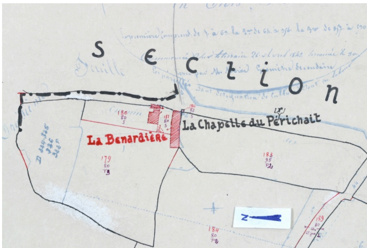
Extrait du plan cadastral de 1936, section E1.