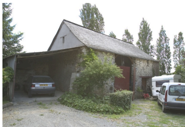
La remise.