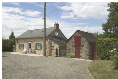
Le logis et la porcherie. IVR52_20045302215NUCA