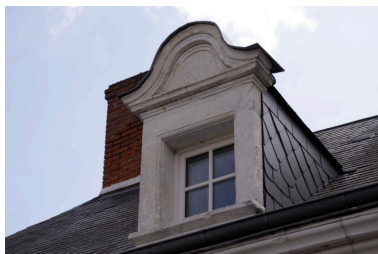
Maison, façade sur rue (chemin de la Fontaine Blineau) : détail de la lucarne. Date portée : 1896. IVR52_20107200826NUCA