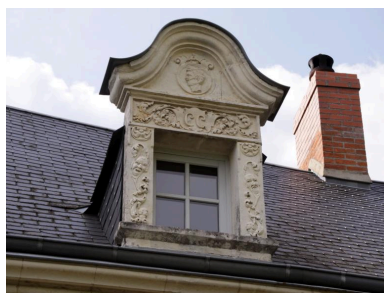
Maison, façade sur cour : détail d'une lucarne (fin XIXe s.). Initiales : CC. IVR52_20107200868NUCA