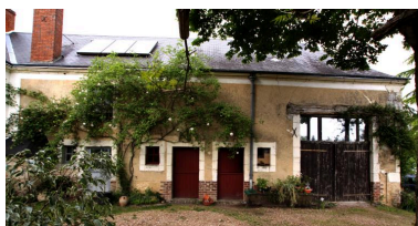
Maison et dépendance, façades sur cour. IVR52_20107200864NUCA