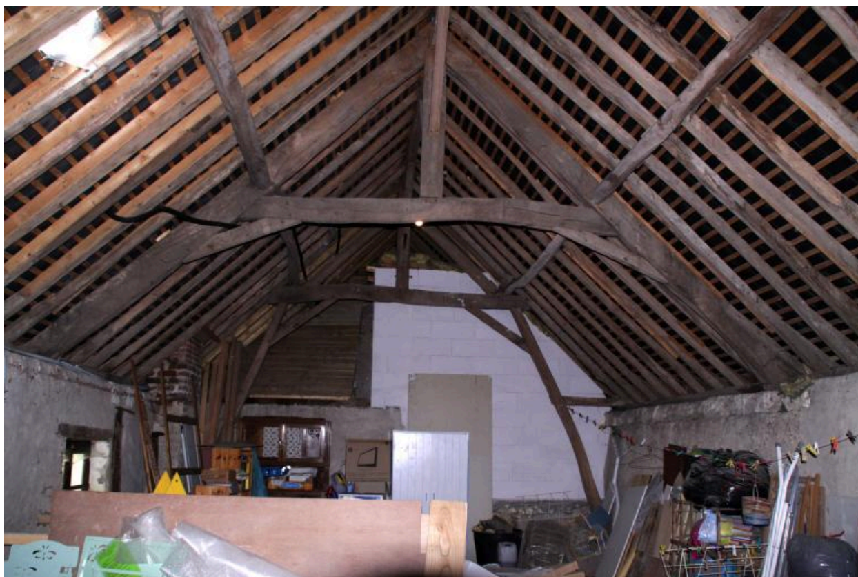
Charpente sur la maison.