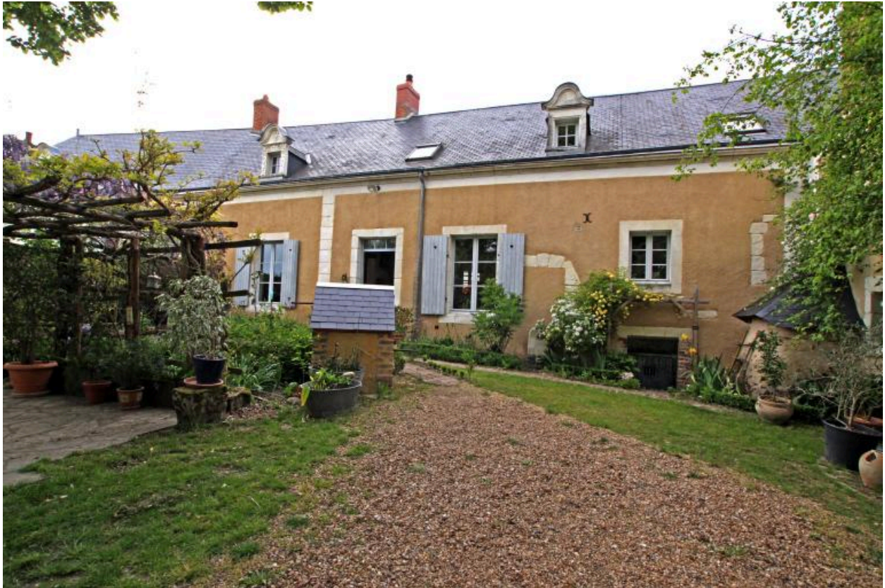
Maison, façade sur cour.