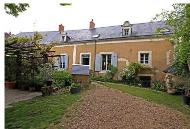
Maison, façade sur cour. IVR52_20107200865NUCA