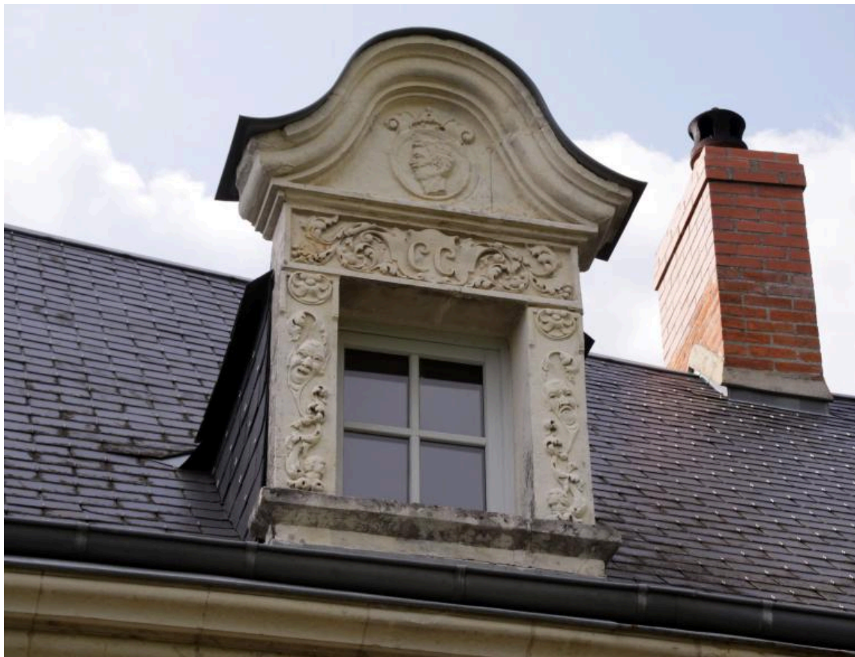
Maison, façade sur cour : détail d'une lucarne (fin XIXe s.). Initiales : CC.