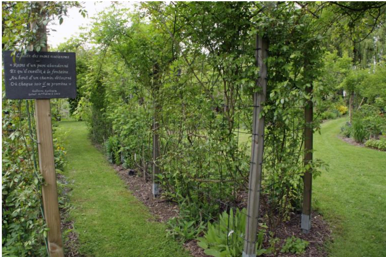
Jardin, allée des roses anciennes.