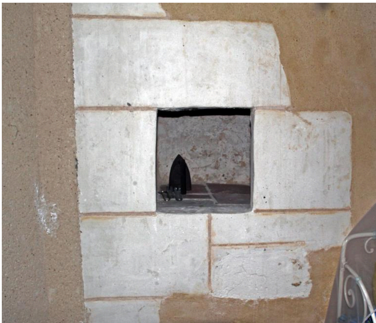
Maison, rez-de-chaussée : niche.