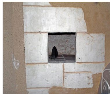
Maison, rez-de-chaussée : niche. IVR52_20107200866NUCA