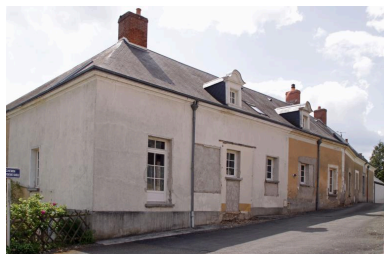
Maison, façade sur rue (chemin de la Fontaine Blineau). IVR52_20107200825NUCA