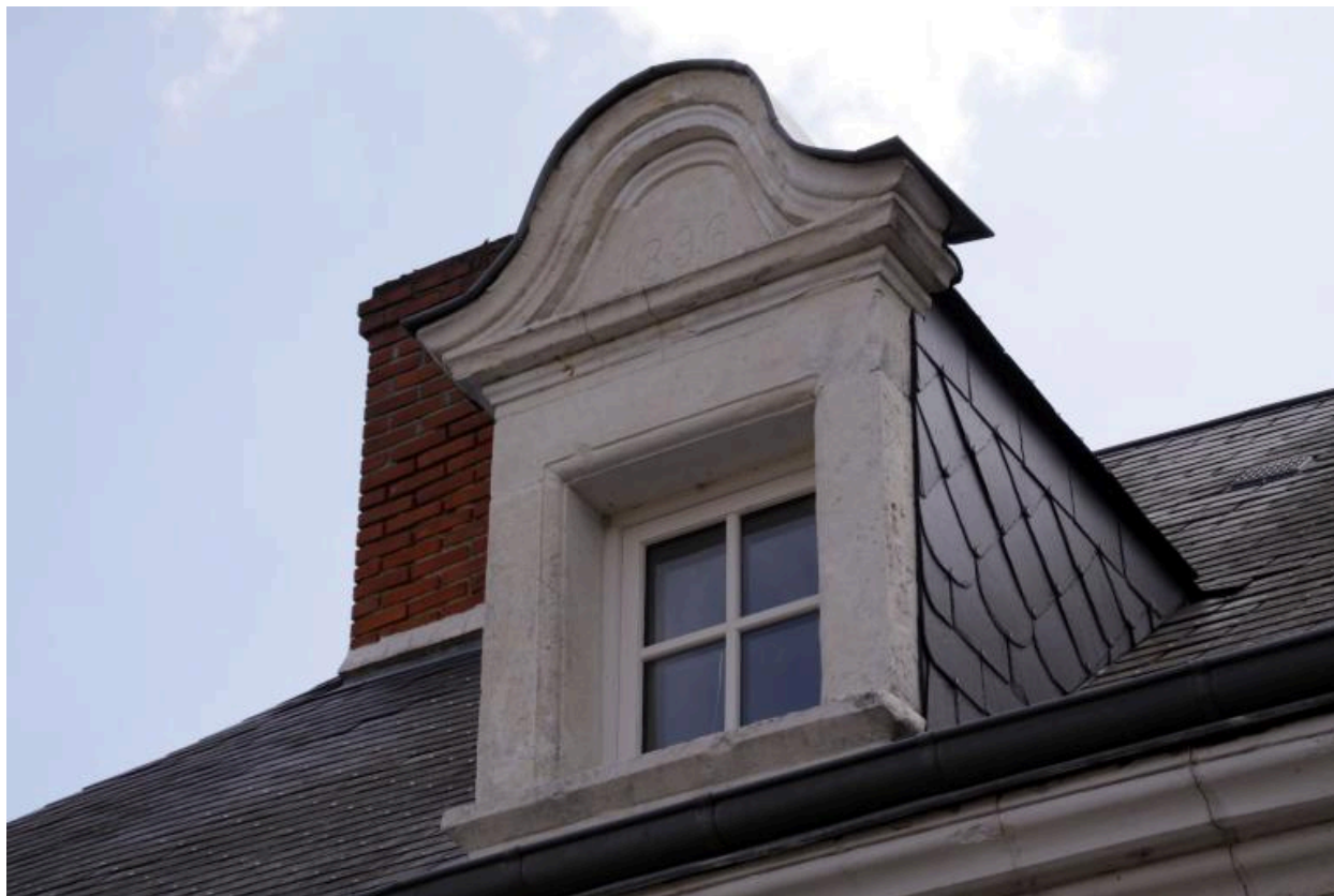
Maison, façade sur rue (chemin de la Fontaine Blineau) : détail de la lucarne. Date portée : 1896.