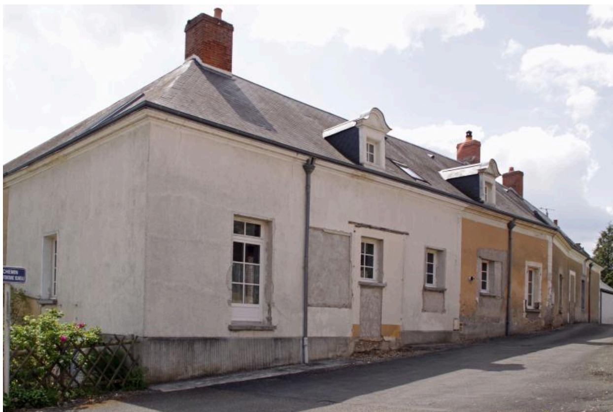
Maison, façade sur rue (chemin de la Fontaine Blineau).