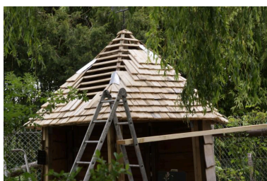
Abri de jardin en construction. IVR52_20107200857NUCA