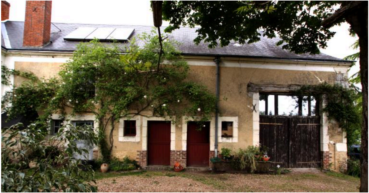
Maison et dépendance, façades sur cour.