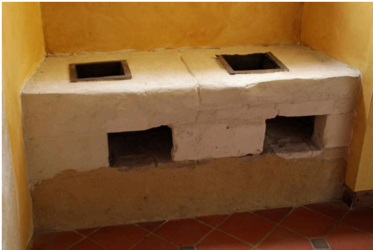
Maison, rez-de-chaussée. Potager pour maintenir les aliment au chaud.