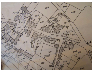
Extrait du plan cadastral de 1996. IVR52_20097202074NUCA