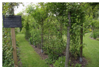
Jardin, allée des roses anciennes. IVR52_20107200858NUCA