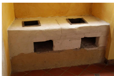
Maison, rez-de-chaussée. Potager pour maintenir les aliments au chaud. IVR52_20107200867NUCA