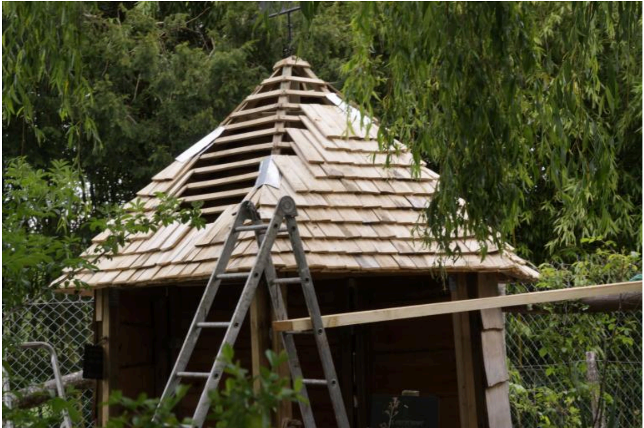
Abri de jardin en construction.