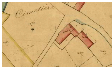
Extrait du plan cadastral de 1834. IVR52_20097201312NUCA