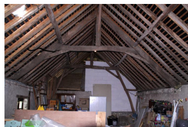
Charpente sur la maison.